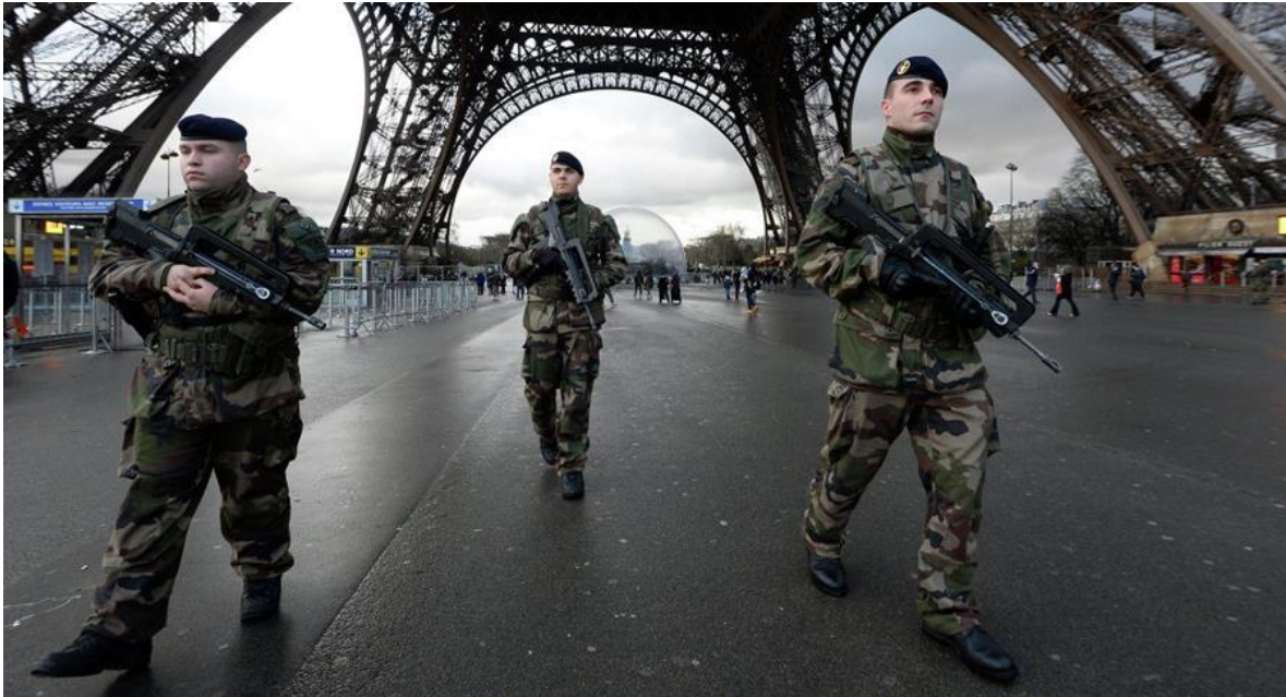
Soldados franceses de patrulla por las calles de París.

Raro es, actualmente, el día que no despertamos con una nueva noticia sobre terrorismo, o sobre situaciones complementarias al mismo. Aunque la internacionalización del terrorismo es un fenómeno relativamente novedoso en las últimas décadas, no podríamos decir lo mismo de la respuesta fragmentada que el mundo está dando en este momento. Un mundo que parece todavía sorprendido de lo que está ocurriendo, aunque llevara predicho mucho tiempo precisamente por aquellos a los que tememos.