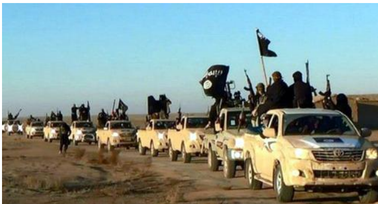
Columna motorizada del DAESH.

La proclamación en Junio de 2014 del Califato por parte de Al Baghdadi, líder del DAESH, puso sobre el tablero geopolítico y estratégico de la zona y del mundo, a un actor menospreciado hasta esa fecha, con una capacidad