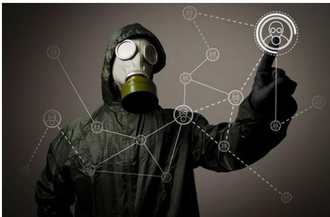
Los ciberterroristas pueden atacar todo tipo de objetivos, incluyendo los servicios básicos.

La finalidad de este artículo de opinión es la de motivar en los lectores un incremento en la observación y en el estudio de la situación actual y de las tendencias del Terrorismo en general y particularmente del Ciber Terrorismo en el Cono Sur del sub continente Sudamericano.