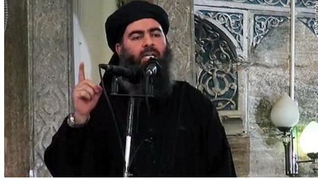
Abu Bakr al-Baghdadi (Samarra, Irak. 28 de julio de 1971).

La violencia, el salvajismo y la indiscriminación de los atentados por parte de ISIS, hizo que Al Qaeda Central a finales de 2013 expulsara de la organización a ISIS como una de sus filiales. Por su parte, Al-Baghdadi no proclamó la independencia de ISIS hasta mitad de 2014, donde él mismo se autoproclamó califa Ibrahim y su soberanía sobre los territorios de Iraq y Siria.