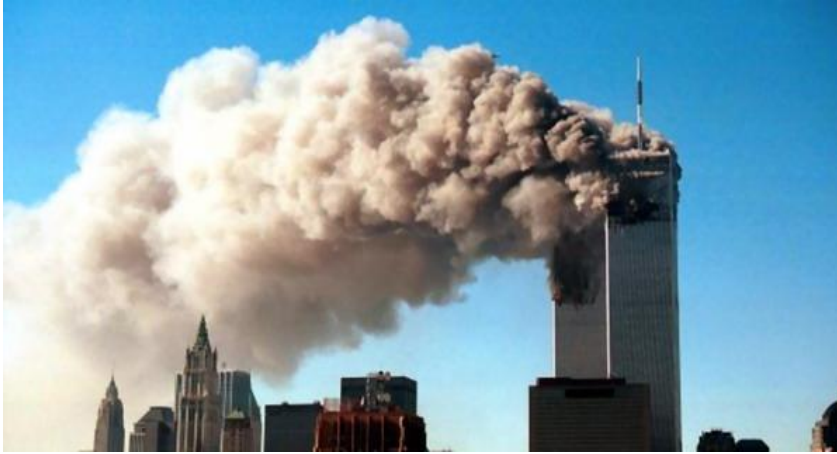
11 de septiembre. Atentado a las torres gemelas.

Los atentados perpetrados en las torres gemelas, supusieron un cambio radical en la forma de dinamizar los flujos migratorios llegados por vía aérea, las estructuras de defensa