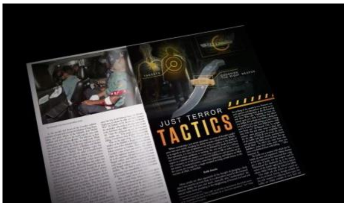
Manual de terrorismo. Imagen tomada de itstime.it

Desde el inicio de la Yihad del ISIS, y del nombramiento de la unidad cibernética del Califato, el UCC, los mecanismos para hacer él mal, han cambiado. Antes, con las guerrillas armadas o los grupos terroristas del momento, se dedicaban a entrenar a sus soldados e instruirlos