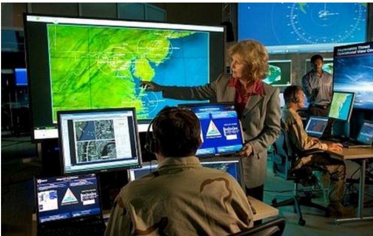
La comunidad de inteligencia tiende a fortalecerse en este entorno cada vez más complejo.

Las noticias sobre terrorismo internacional se actualizan diariamente a un ritmo frenético, sin duda es un factor que influye y preocupa en nuestra sociedad. Éste evoluciona y se adapta rápidamente, de origen dispar, es dinámico y aprovecha las oportunidades que el entorno