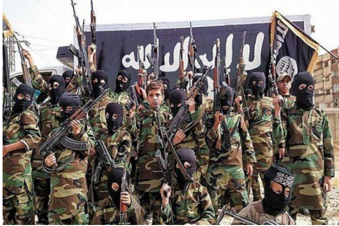
Niños soldado del DAESH.

Los “cachorros del califato” en oriente medio y la nueva “generación yihad” de occidente, son los encargados de portar el valioso testigo del grupo terrorista DAESH. Mantener latente una ideología radical en su lucha armada contra el mundo por conseguir un califato mundial, siendo de suma importancia