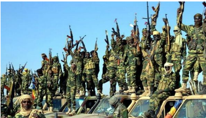
Militantes de Boko Haram en Nigeria.

Se estrelló el 28 de noviembre de 2016 a las 22:15 hs aproximadamente hora local (UTC-5:00). Entre los pasajeros, se encontraba el equipo de fútbol brasileño Chapecoense, que se trasladaba para jugar la final de la Copa Sudamericana 2016 con un equipo Colombiano. Sólo seis personas sobrevivieron al accidente. El informe de los peritos colombianos indicó que el avión viajaba excedido de peso y con el combustible al límite, pero aun así los pilotos decidieron no hacer escalas para repostar. No cumplieron el plan de vuelo, que no había sido aprobado por las autoridades aeroportuarias.