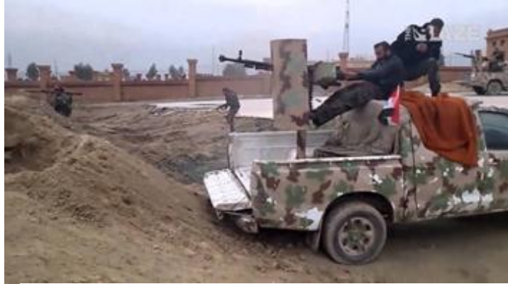
Pick Up del DAESH armada con potente ametralladora.

Las caravanas de Pick Ups del DAESH con milicianos y artilladas con ametralladoras antiaéreas NSV, DHSK incluso ZU-23 y cañones sin retroceso, frente a un ejército Iraquí y Sirio dotados de Carros de Combate de origen