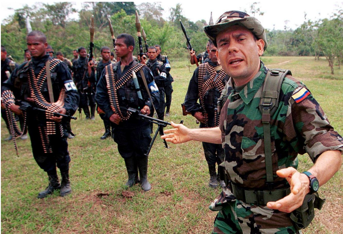
Carlos Castaño Gil, máximo líder de la Autodefensas Unidas de Colombia - AUC

La de Colombia es una historia plagada de violencias. La más dramática, de más larga duración, y que ha tenido un impacto masivo en la población, ha sido la violencia política. Distintos conflictos han degenerado en barbarie, llevando a acciones que hoy serían consideradas sin lugar a dudas como actos terroristas. Ninguno de los grupos que han protagonizado la violencia política en Colombia ha estado exento del salvajismo innecesario contra sus enemigos o contra la población civil.