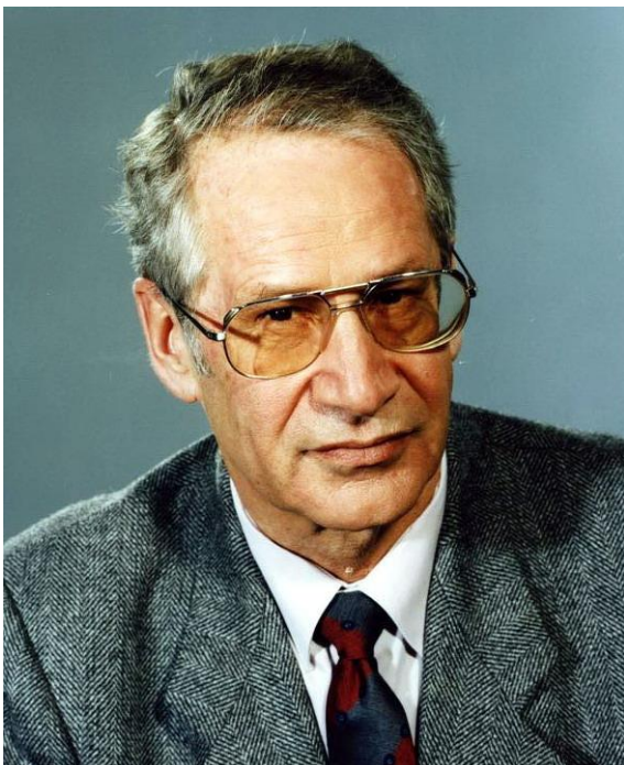
Markus Johannes Wolf, llamado "Mischa Wolf", "Espía Romeo" o "El espía sin rostro". Una historia interesante.

Los bienes más preciados de un servicio de información (o inteligencia) son sus bases de datos y su personal, en este artículo hablaremos del capital humano.