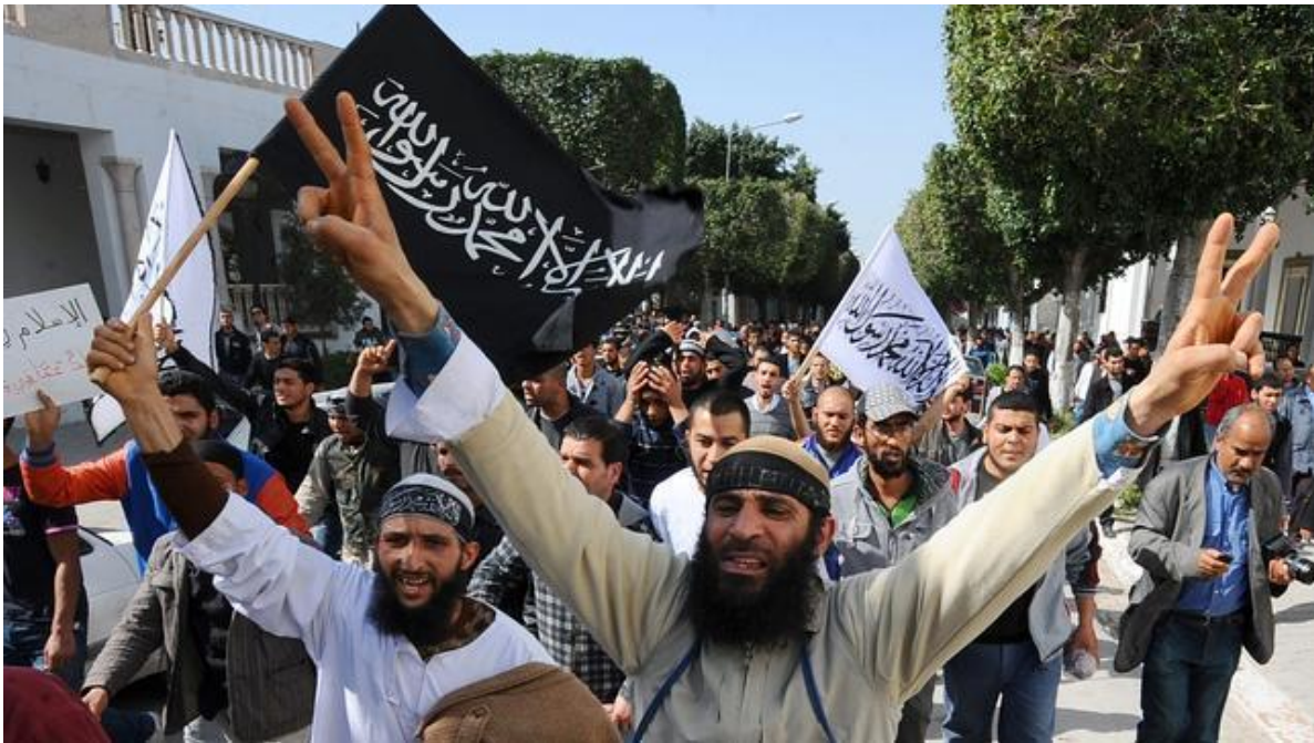
Manifestación de Salafistas en la capital de Túnez.

El salafismo es un movimiento político-religioso fundamentalista sunita, cuyo principal objetivo es volver al origen del Islam. La palabra salafismo, en árabe as-salafiyya, proviene del término “salaf”, y se podría traducir como “predecesor” o “ancestro”. En definitiva, los salafistas quieren regresar al Islam más primitivo u original que procesó aquella primera comunidad musulmana, la cual se concentraba alrededor del profeta Muhammad, y las tres siguientes generaciones a las cuales se les atribuye la gran expansión geográfica y humana del Islam por la “pureza de su fe”. El salafismo, por tanto, se opone a cualquier reforma, y exige la purificación del islam de aquellos elementos considerados extraños.