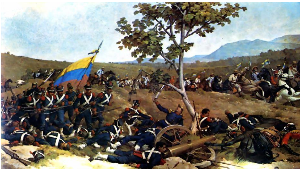
Obra "Carabobo" del pintor Martín Tovar y Tovar (1827-1902), representa lo cruento de la batalla.

Desde su emancipación Colombia ha atravesado por constantes y cruentos enfrentamientos armados internos que han ocasionado miles de muertos y millones de desplazados. Es necesario hacer una breve relación de algunos hitos de la historia del país para comprender la naturaleza y magnitud del problema, y el gran reto que significa formar para la paz y la convivencia en un país contantemente convulsionado por la violencia.