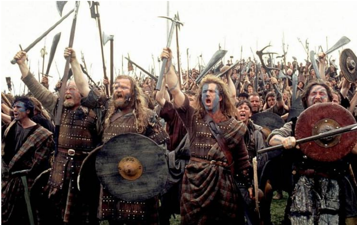
Escena de la película "Corazón Valiente"