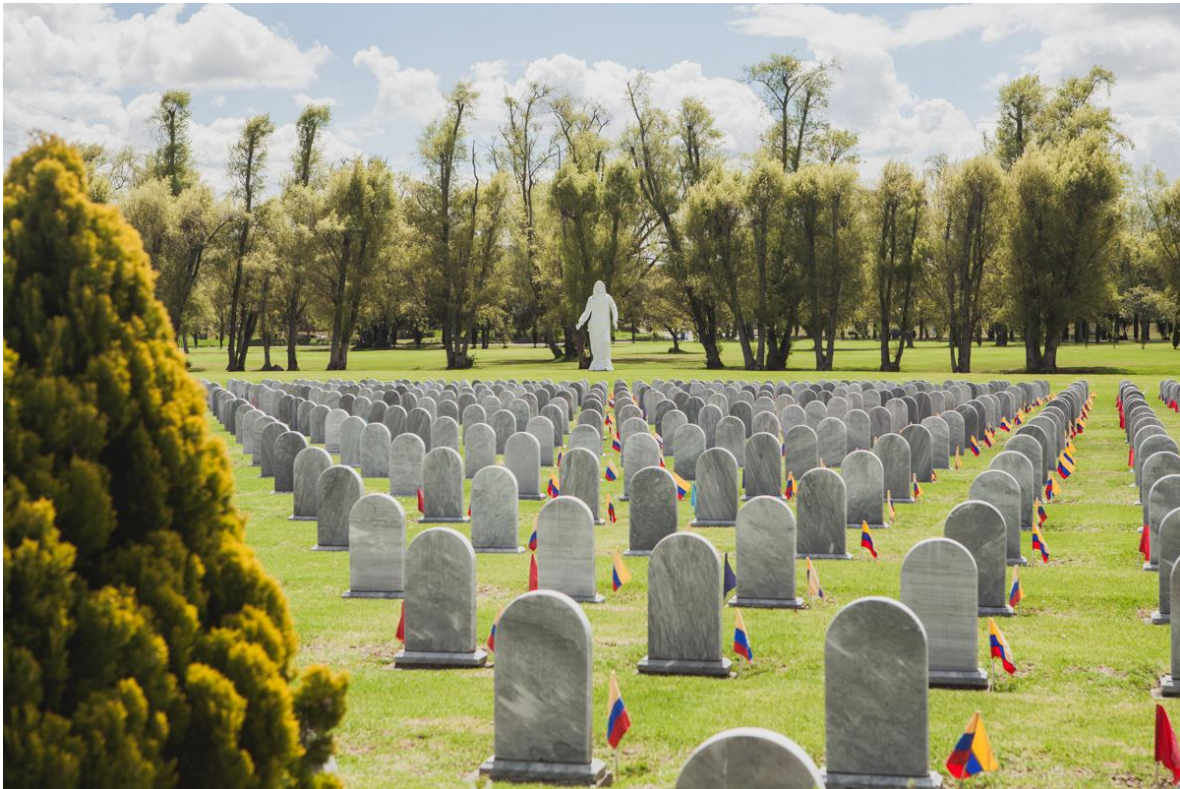
Cementerio militar en la ciudad de Bogotá, Colombia.

Que en paz descanse (02-Febrero-1965 al 31-Agosto-1996)