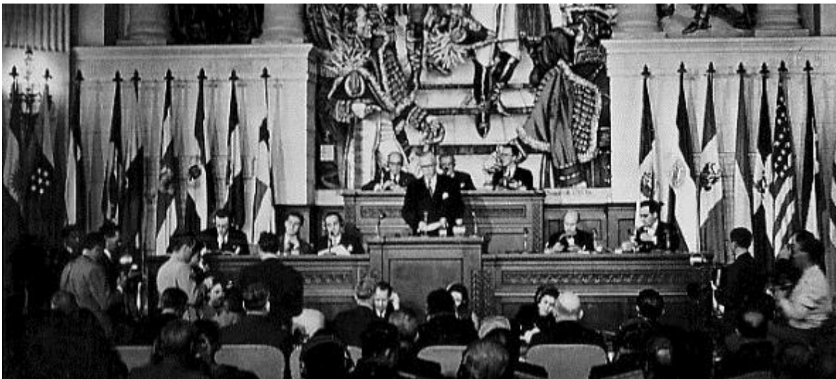
George Marshall se dirige a la Novena Conferencia Panamericana en Bogotá, 1948

Dadas estas circunstancias, las perspectivas de las deliberaciones eran inciertas hasta el 9 de abril, lo cual le permitió a Marshall disciplinar la Conferencia bajo la égida del anticomunismo y el alineamiento pro-norteamericano. Las manos largas de los estadounidenses llegaron hasta sugerir el gabinete bipartidista, el alejamiento de Laureano del gobierno y la calumnia de que los comunistas habían asesinado a Gaitán, la cual Ospina Pérez divulgó ampliamente. (p.22)"