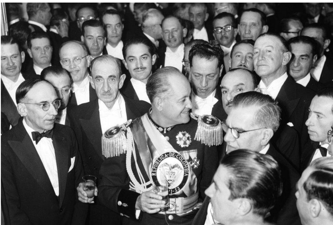
El General Gustavo Rojas Pinilla, con hombres de la alta sociedad bogotana.