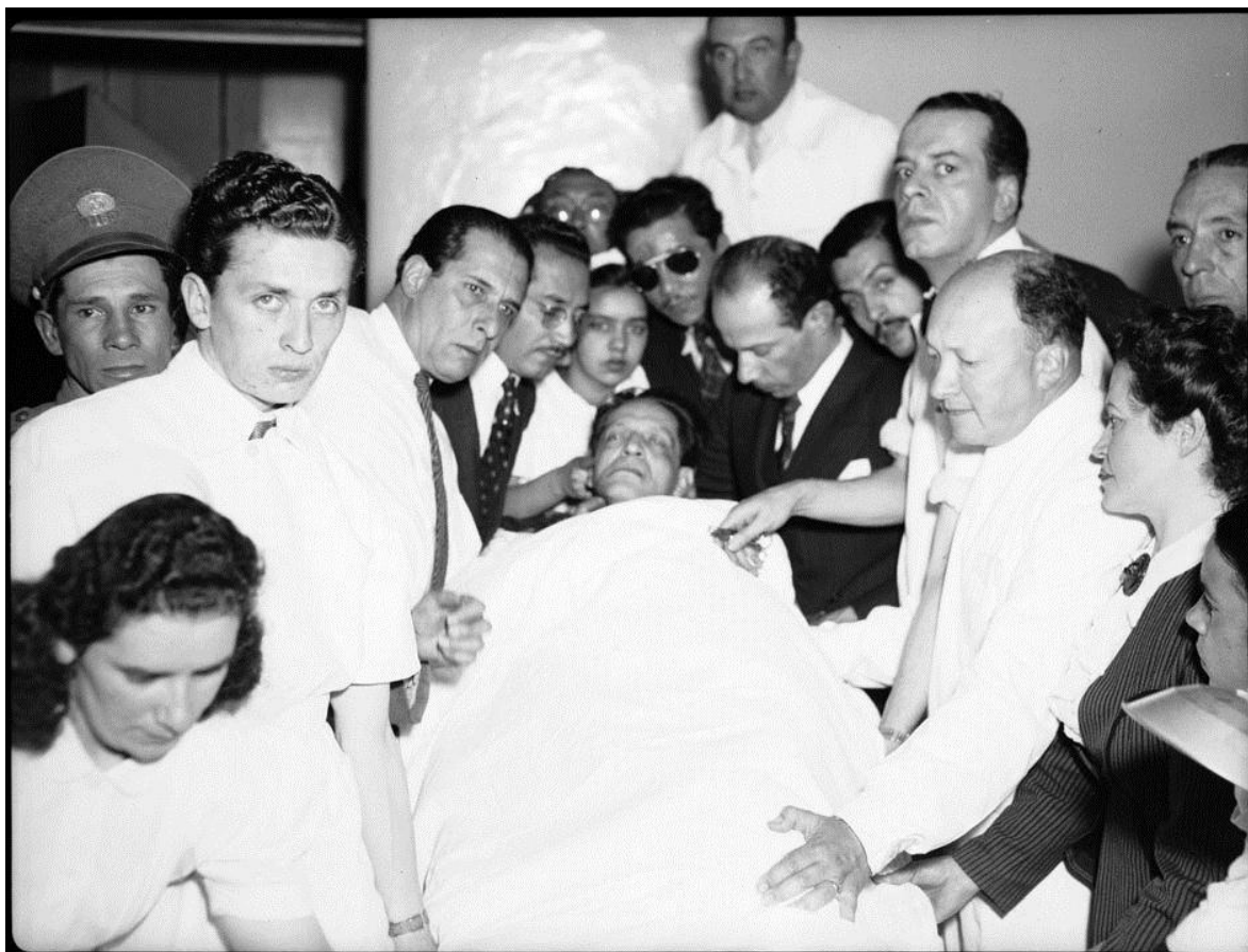
Cadáver de Jorge Eliecer Gaitán junto a médicos, policías y otros funcionarios, quienes decidieron tomarse una macabra “selfie” al interior del centro médico a donde le llevaron.

Al retirarse, el Presidente López Pumarejo permitió que su reemplazo constitucional, Alberto Lleras Camargo, tomara el poder como Designado y convocara elecciones para junio de 1946, mismas que fueron ganadas por el partido conservador.