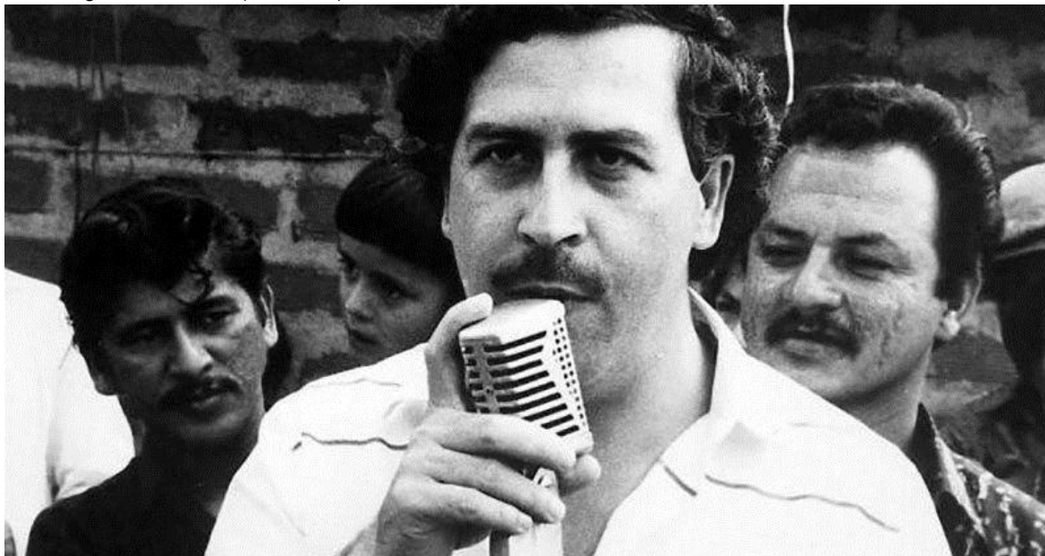
Pablo Emilio Escobar Gaviria, capo del narcotráfico, jefe del Cartel de Medellín.