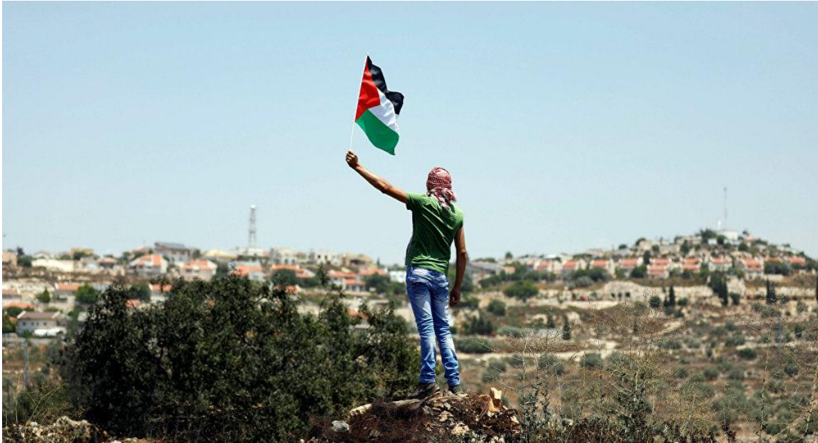
Manifestante solitario ondea la bandera de Palestina, protestando en los territorios ocupados.

En el año 1948, cuando Yassir Arafat creó la O.L.P. (Organización para la Liberación de Palestina), como respuesta al nacimiento del Estado de Israel, nunca habría imaginado como iría mutando este tipo de violencia terrorista, hasta encontrarnos con un modelo actual “altamente sanguinario”. En ese momento se trataba de un tipo de terrorismo, podríamos decir, “doméstico”, circunscripto a la zona del conflicto, es decir, el Oriente Medio.