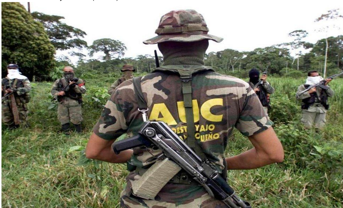
Paramilitares colombianos. Las AUC hoy en día están desmovilizadas.

La falta del cumplimiento de la Ley, del Estado de Derecho y el exceso de impunidad, nos llevan a un Estado sin orden. Cuando los gobiernos no cumplen con su labor, es obvio que empiecen a brotar diversos conflictos sociales, las manifestaciones en las calles se hacen notar considerablemente y los medios de comunicación se saturan de notas acerca de enfrentamientos entre civiles y policías.