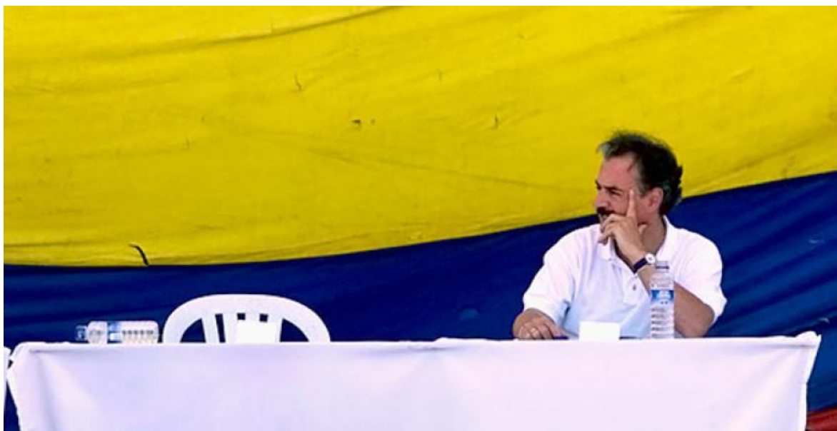
El presidente Andrés Pastrana, solo en la mesa principal en el inicio oficial de los diálogos de paz, pues el máximo jefe de las FARC, alfa "Tirofijo" no asistió por presuntos problemas con la seguridad.