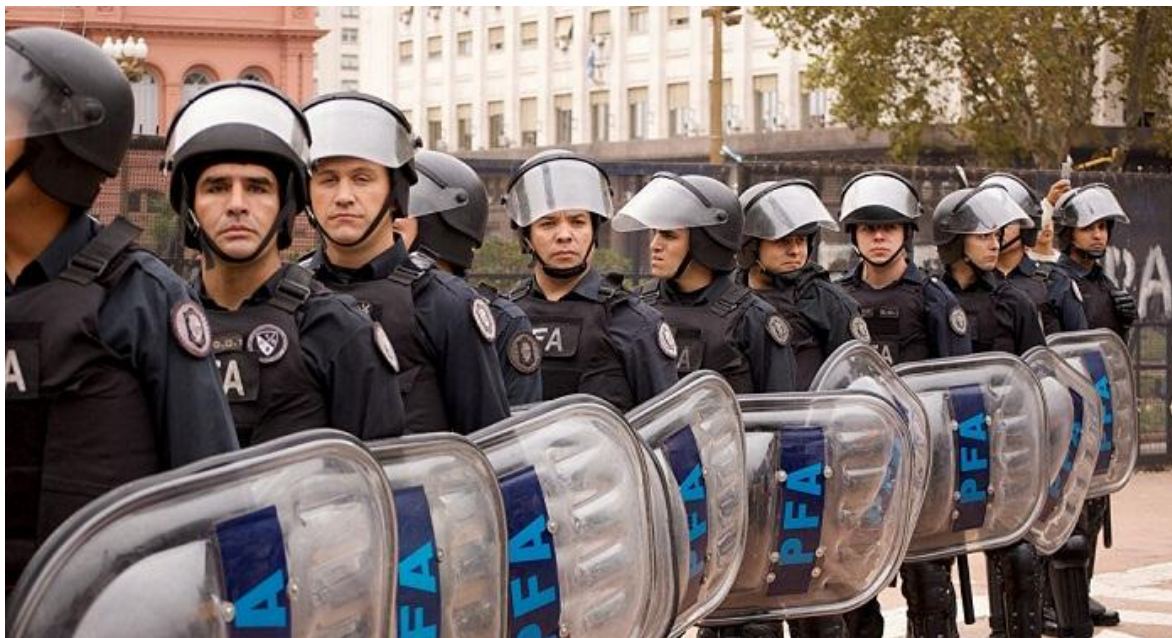
Personal de la Policía Federal Argentina en función antidisturbios.

El 5 de marzo de 2018, se publicó en el Boletín Oficial el Decreto Presidencial N° 174/2018, el cual en realidad realiza una modificación del Decreto N° 357/2002 en el que se encuentra asentada la estructura organizativa (Organigrama y Objetivos) del Poder Ejecutivo de la Nación Argentina.