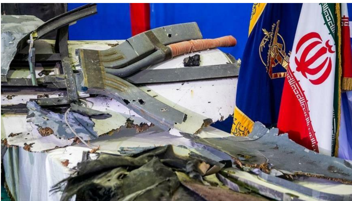
Fragmentos del UAV Global Hawk de los Estados Unidos derribado por Irán en el Golfo de Omán.

La atención internacional se concentra en el extraño minué que Donald Trump baila sobre las aguas del Golfo Pérsico, amenazando, lanzado ataques contra objetivos estratégicos de la República Islámica de Irán, y abortándolos cuándo los bombarderos estaban a 10 minutos de sus objetivos, con un grado de incoherencia e irresponsabilidad que ya no sorprenden del pequeño Hitler nacido en Queens, pero cada día acerca al mundo a la posibilidad de una verdadera catástrofe bélica.