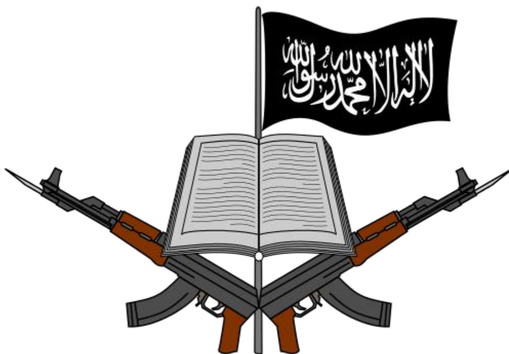
Emblema del grupo terrorista Boko Haram.

La ofensiva de Boko Haram , parece no tener fin. Desde principio de año se han producido casi de manera cotidiana ataques y atentados tanto contra la población civil, como contra objetivos militares.