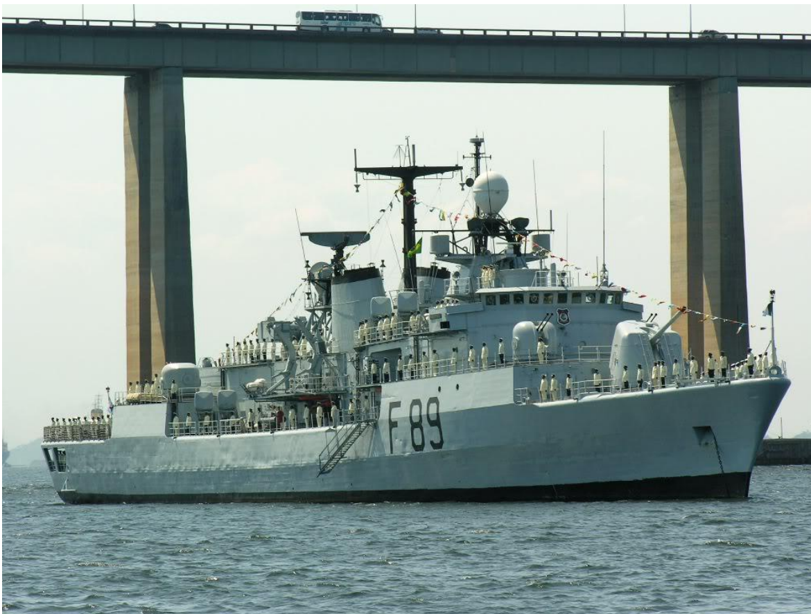
F89 NNS Aradu

4 helicópteros utilitarios embarcados Augusta A109