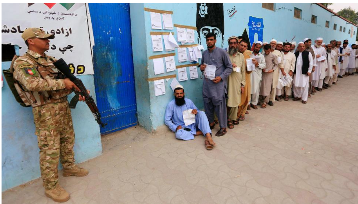
Un grupo de hombres llega para emitir su voto en un colegio electoral en Jalalabad, Afganistán, el 28 de septiembre de 2019.

A pesar que los resultados de las presidenciales se esperaban para el día 19, a casi un mes de realizadas, la Comisión Electoral de Afganistán, sigue sin dar información de los resultados, excusándose en qué sistema de datos biométricos, que se supone evitaría cualquier posibilidad de fraude, ha complicado y retrasado el escrutinio. Al tiempo que los dos bandos que encabezaron las encuestas, la coalición independiente de Ghani y la Coalición Nacional, de Abdullah-Abdullah, se han adjudicado la victoria después de la primera ronda, aunque la comisión electoral cree podrá tener algunos resultados ciertos para el próximo siete de noviembre.