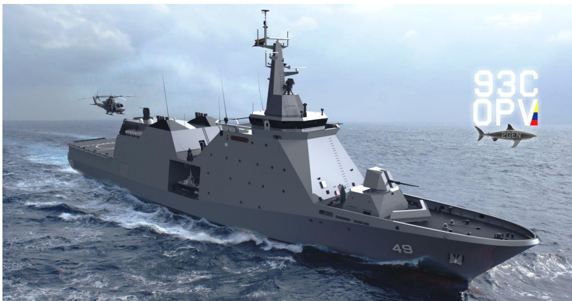
Este es el diseño del OPV-93C, desarrollado a partir del know how adquirido con los OPV-80

Para el ejercicio de su soberanía en mares y ríos, Colombia dependió por décadas de lanchas y buques construidos en otros países. Los buques principales solían ser donaciones o transferencias de embarcaciones de segunda mano de origen estadounidense. Estos buques requerían repotenciones y modernizaciones constantes en sus sistemas de combate, propulsión, navegación, etc. Lo cual resultaba bastante costoso para el país. Con el agravante de que se trataba de unidades concebidas para operar en otros contextos operacionales.