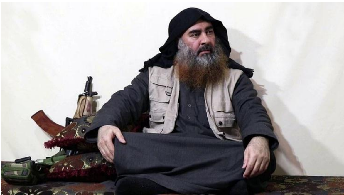
Abu Bakr Al Baghdadi, durante su última aparición en público, en abril de 2019

Con un gran sentido de la oportunidad ha muerto el líder y fundador del Daesh, Abu Bakr al-Baghdadi o el Califa Ibrahim, a manos de un grupo de las fuerzas especiales estadounidenses, tal como lo informó el día domingo 27 de octubre, el presidente norteamericano Donald Trump, tras haberlo anunciado vía twitter el sábado 26 a las 9.23 de la noche: “¡Algo muy grande acaba de suceder!”.