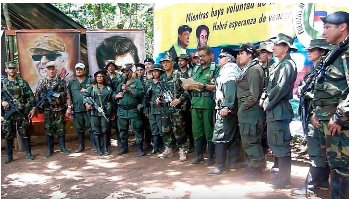
Captura del video donde un sector de las FARC anuncia que retoma las armas.