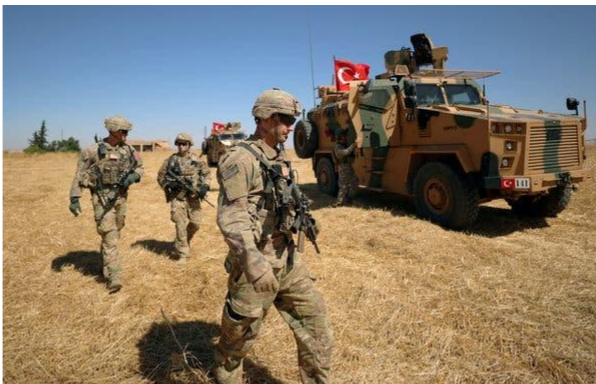
Tropas de Turquía avanzan en territorio sirio.

Es inadmisibles creer que los Estados Unidos no habían tenido en cuenta la consecuencia que podría acarrear su retiro del noreste de Siria y cuál iba ser la actitud del presidente turco Recep Erdogan, que ahora está libre para alejar a los kurdos de la frontera turco-siria y aniquilar Rojava, el enclave kurdo, en el norte sirio, que podría resultar siendo el embrión del tan deseado estado kurdo.