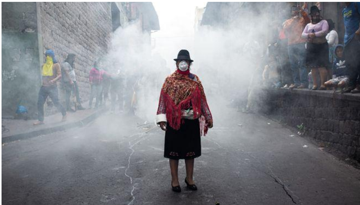
Protestas en Ecuador.