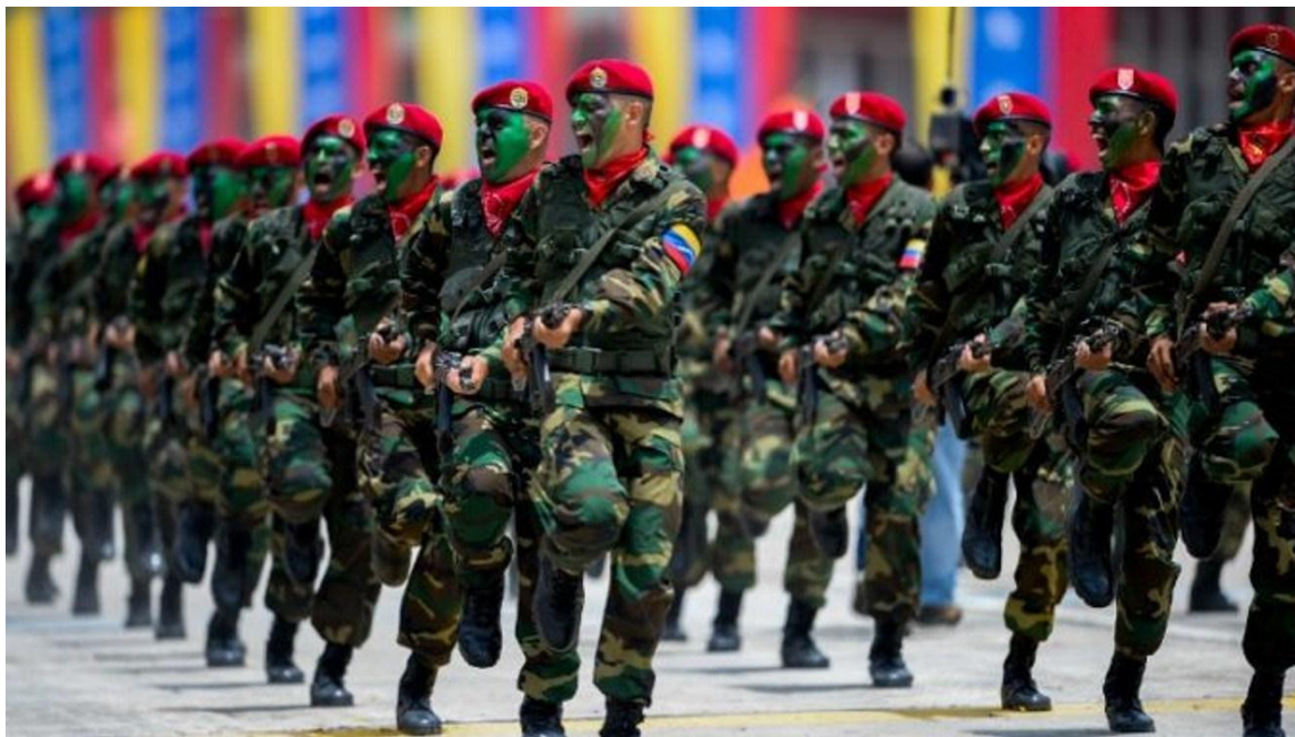
Infantería Paracaidista, Ejército Bolivariano de Venezuela

Por Pablo Escalante, Teniente Coronel (R/A) (Venezuela)