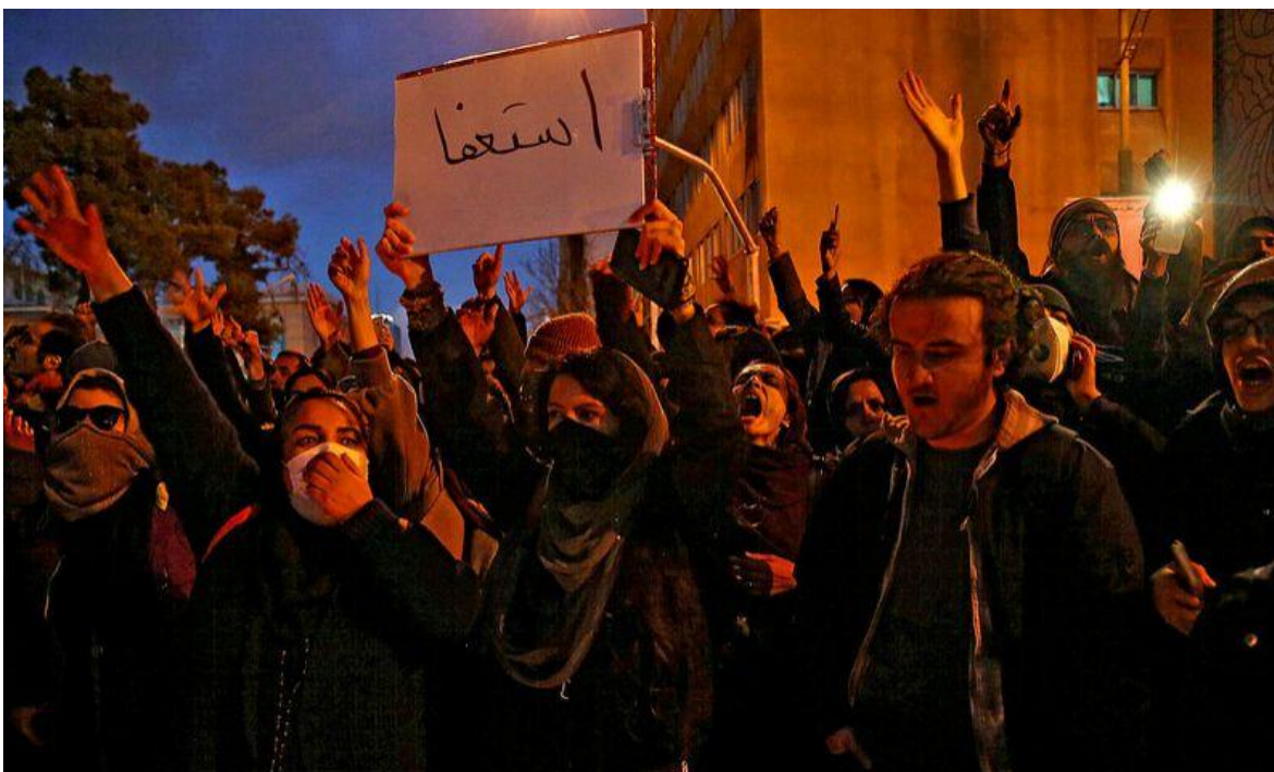
Protestas antigubernamentales en Irán

Mientras Naciones Unidas y todos sus socios mediáticos encubren el etnocidio que una vez más se “celebra” en Bolivia, porque no es más que eso, una verdadera celebración del odio al indio, y disimula la represión pinochetista en Chile o en Ecuador o en Colombia, destaca con grandes titulares y las respectivas denuncias por la represión del gobierno chino en Hong Kong, o el genocidio que Arabia Saudita, provocó en su guerra contra Yemen. El fabuloso mecanismo informativo, alrededor del mundo, se ha puesto en marcha para exponer una vez más a la República Islámica de Irán, que desde el pasado 15 de noviembre, ha tenido que implementar medidas en defensa de su Revolución.