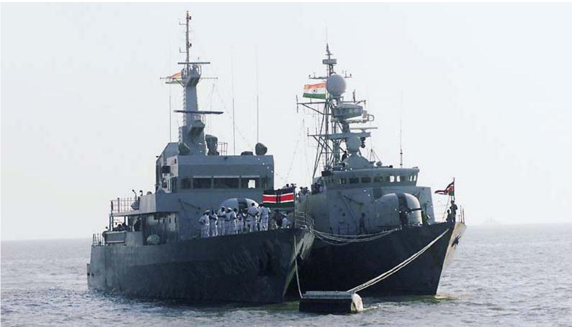
Patrulleros KNS Shujaa y KNS Nyayo de la Armada de Kenia.

La Marina de Kenia se estableció en diciembre de 1964, el cuartel central está ubicado en Mombasa. Tiene bases en Mombasa, Shimoni, Msambweni, Malindi, Kilifi y en Manda (ubicada en el archipiélago de Lamu). La fuerza naval está formada por buques patrulleros, carentes de misiles. El más grande los cuales es el P3124 KNS Jasiri, de origen español, que desplaza 1.400 toneladas y tiene 85 metros de largo.