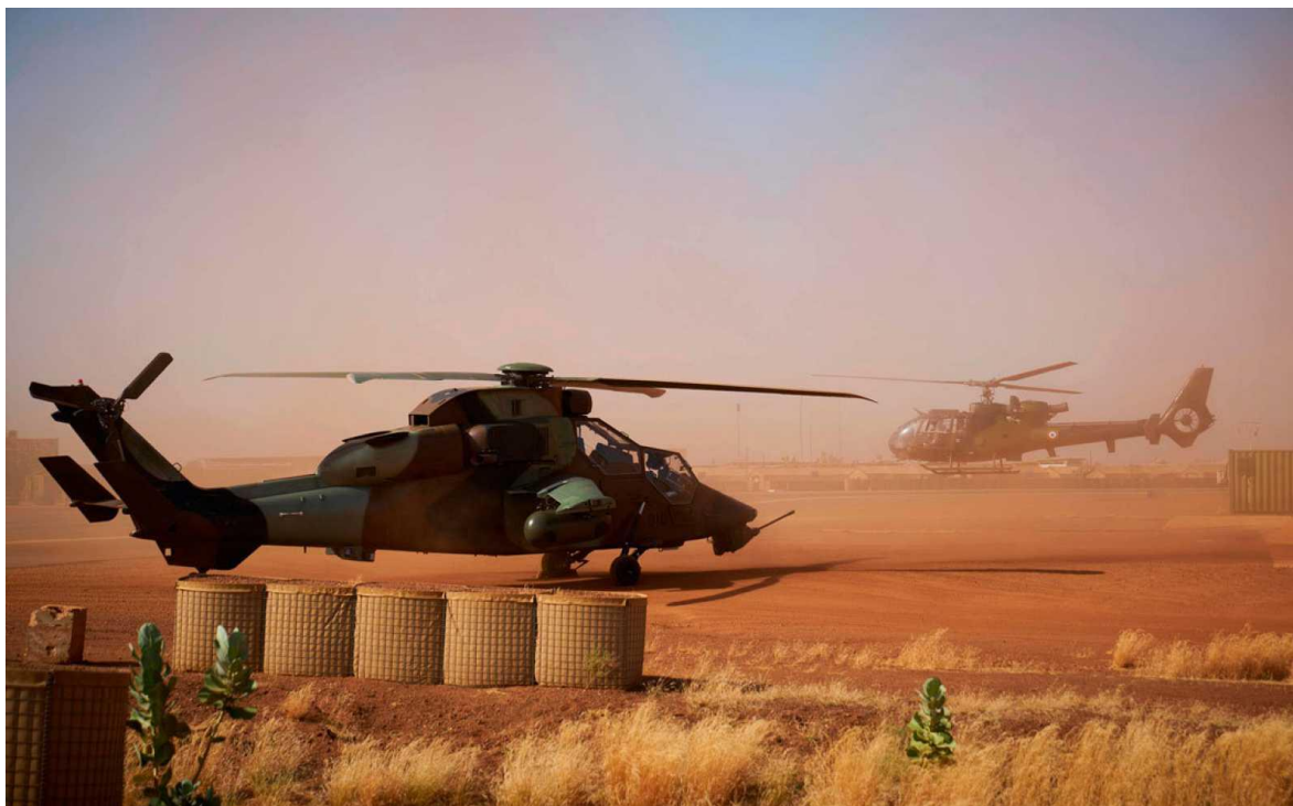
Aeronaves francesas en África. Imagen ilustrativa.

Francia en Vietnam, tras ocho años de guerra (1946-1954), no solo dejó enterrada su condición de imperio, sino también la vida de 93 mil de sus hombres y el honor de su ejército, si alguna vez lo tuvo. Desde 2013, con la operación Serval , y desde 2014, la Barkhane , intenta proteger los intereses de las empresas francesas que explotan los yacimientos de uranio en la frontera entre Mali y Níger y mantener estabilizado al gobierno pro occidental de Bamako, que tras un golpe palaciego, la invasión de los Tuareg , que pretenden recuperar Azawad, su territorio histórico y la irrupción de la insurgencia wahabita , que a partir de los éxitos en Libia, Irak y Siria se extendía por el Islam , como un mal bíblico el terrorismo religioso, comenzaba a golpear con fiereza en el Sahel.