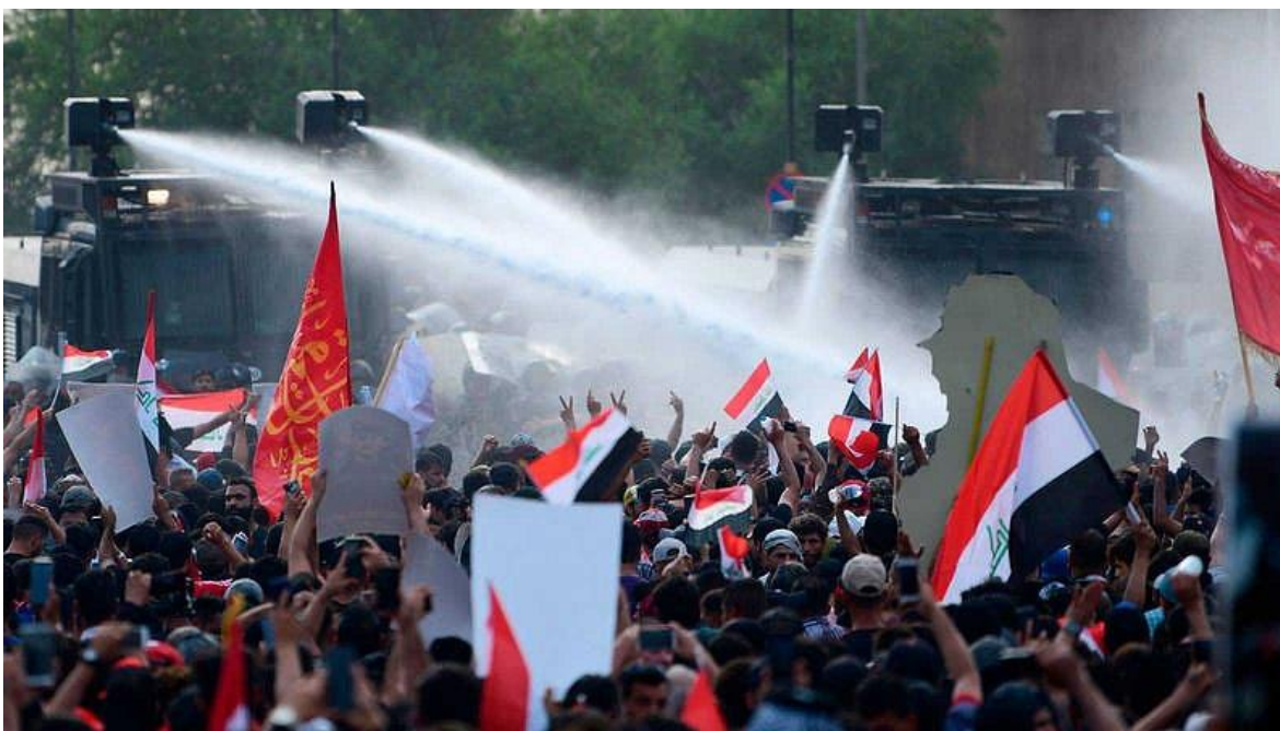
Protestas antigubernamentales en Irak.

El pueblo iraquí ha vivido desde la llegada al poder de Sadam Hussein décadas la represión política. Husein Sadam gobernó el país con puño de hierro durante casi 25 años, (1979-2003) tiempo como para vivir guerras, como la que llevó contra Irán, o la que sufrió tras invadir Kuwait; violencia sectaria, intentos de limpieza étnica contra los kurdos, bloqueos y sanciones económicas. Después, la ocupación militar norteamericana, con el reguero de sangre que abrió, a lo que siguió el terrorismo religioso, que también se confunde en una guerra civil y ahora una especie de estabilidad política en la que los gobiernos más o menos de manera natural, más o menos de manera artificial, se suceden con una democracia al estilo occidental, obligada a funcionar en un sistema tribal, que establecido desde mucho antes que los primeros europeos alcanzarán el Éufrates.