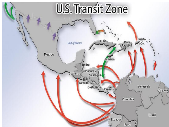
Rutas del Narcotráfico.

En la zona fronteriza de Colombia y Perú interactúan diversas OCT para coordinar el transporte de narcóticos (clorhidrato de cocaína y marihuana), empleando los ríos Putumayo y Amazonas (frontera binacional entre ambos países) así como sus ríos afluentes, para enviar la droga tanto hacia el territorio ecuatoriano (para hacerla llegar por vía terrestre a los puertos y zonas de lanzamiento sobre el Océano Pacífico) como hacia el