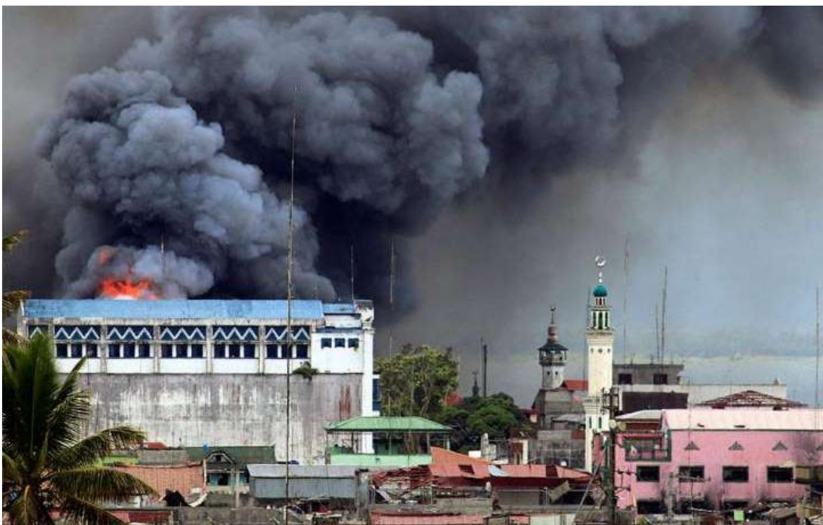
Bombardeo de la ciudad de Marawi por la Fuerza Aérea de Filipinas (15JUN2017)

Las consecuencias hacia el interior del Daesh , tras la muerte de su líder Abu Bakr al-Bagdadí, (Ver: Al-Bagdadí, el muerto oportuno), todavía están muy lejos de dimensionarse para sacar conclusiones, sobre el complejo proceso de sucesión, aunque aparecen ya algunos nombres, pero sería inútil conjeturar al respecto. Más cuando nunca conoceremos cuan penetrada estuvo o sigue estando, la organización terrorista por los servicios de inteligencia y los vínculos reales entre el Califa muerto y los agentes de los servicios de los que dispone el Pentágono, que en algún momento, dado que las acciones del Daesh parecieron estar en concordancia con las necesidades tácticas y estratégicas de los Estados Unidos, en Mali, en Nigeria, Libia o Afganistán, solo por nombrar algunos de los lugares en que Daesh tenía sucursales.