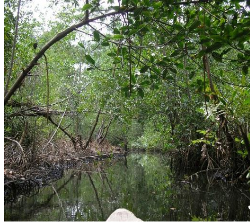
Rutas fluviales

Al respecto el informe semestral 2018 de drogas de la Dirección Contra las Drogas de la Armada Nacional de Colombia (en adelante: DICOD) indica que: “las áreas predilectas para los narcotraficantes siguen siendo los corredores fluviales del Pacífico colombiano, que por su geografía ofrecen espacios con características de ocultamiento ideales para el tráfico de sustancias ilícitas, insumos y precursores. Así mismo, el mencionado informe señala que existe una expansión del tráfico de drogas hacia