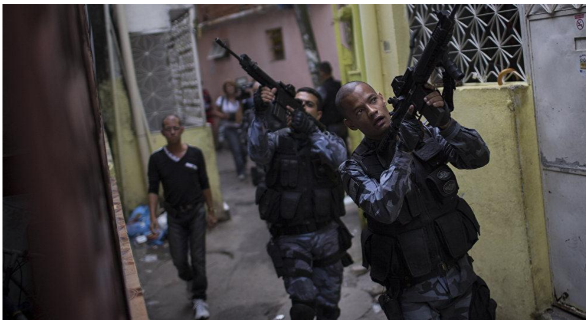
Policías de Rio de Janeiro realizando un operativo en una favela.

De forma similar a los terroristas del Medio Oriente que usan a la población como escudo humano, los narcoterroristas de Rio de Janeiro, Brasil, también usan las personas del barrio pobre para la protección de su negocio.