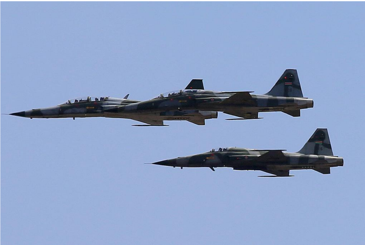
Cazas ligeros F-5 de la Fuerza Aérea de Kenia.

La Fuerza Aérea de Kenia nació en 1964 tras la independencia del país. En la actualidad opera desde las bases de Laikipia en Nanyuki, la base Moi en Eastleigh Nairobi, la de Mombasa, la base de Madera y la de Nyeri. Además de operar los medios aéreos de la nación la fuerza tiene un batallón de defensa antiaérea.