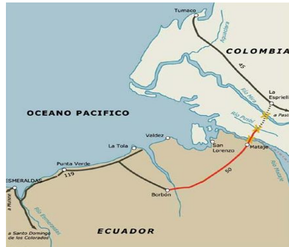
Eje Vial La Espriella - Mataje.

Los objetivos establecidos en el convenio binacional de fortalecimiento de la frontera indican que la ejecución de esa obra afianzará los lazos de hermandad entre las comunidades afro descendientes de Colombia y Ecuador, servirá de salvavidas a la economía de la región y permitirá que los más de 1.000 pequeños productores amplíen sus contactos comerciales.