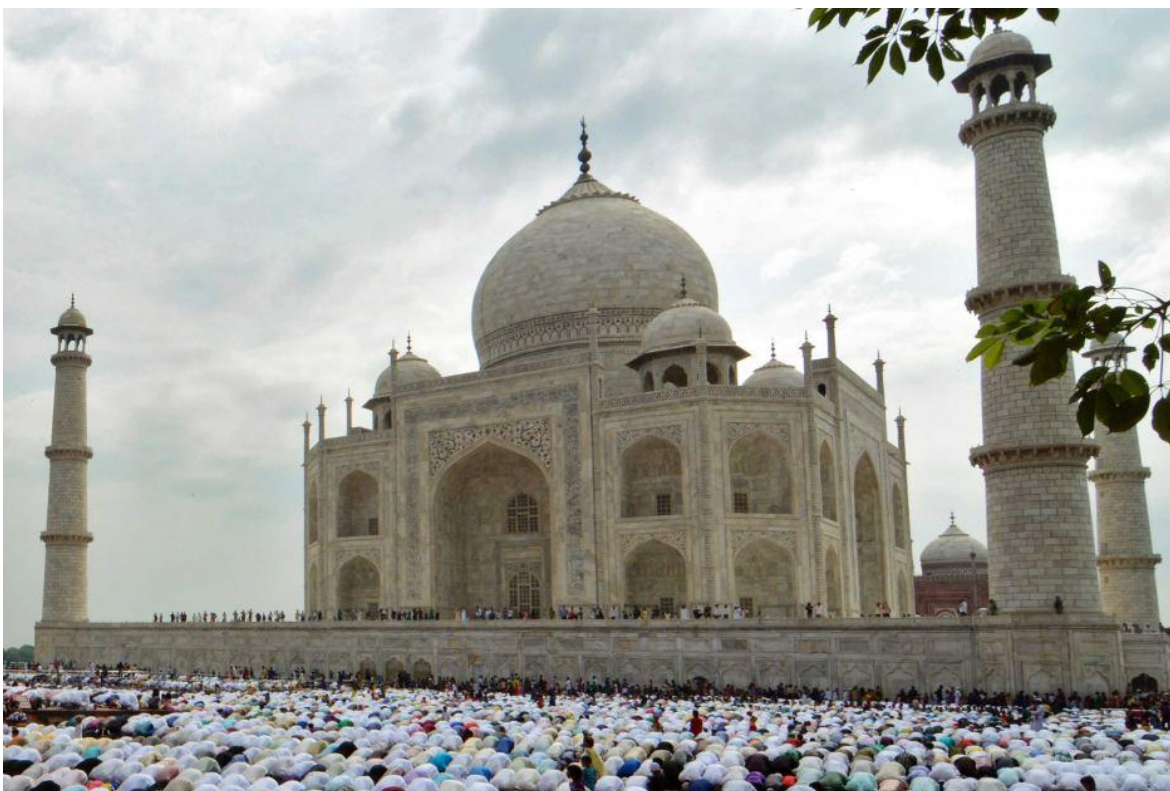
Musulmanes de la India oran frente al Taj Mahal. Esta población que representa el 13 % de la población de ese país, está siendo maltratada por las políticas del primer ministro Narendra Modi.

Desde la partición de la India en 1947, los conflictos entre la mayoría hinduista y la comunidad musulmana local, no ha dejado de encontrar excusas para el enfrentamiento, más allá de la siempre sangrante Cachemira, desde las matanzas a gran escala, ataques aislados y linchamientos espontáneos que han sido una constante, siempre retroalimentada por el odio que vuelve a iniciar el ciclo de venganzas una y otra vez, situación de la que los políticos hindúes han sabido sacar mucha ventaja, por lo que ningún gobernante a excepción de Nerhu, ha intentado detener las crisis periódicas, que terminan de zanjarse con cuotas cada vez más importantes de muertes.