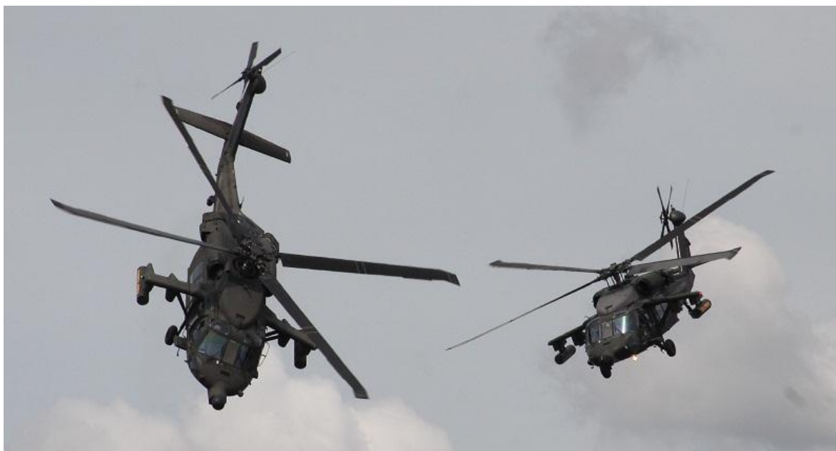
Helicópteros AH-60L Arpia, de la Fuerza Aérea Colombiana.

En horas de la madrugada, la estación de policía del pueblo se estremece con tres explosiones sucesivas, abriendo paso a un nutrido fuego de fusiles y ametralladoras, están siendo atacados por unos doscientos terroristas de las FARC. La situación es bastante desfavorable, pues en la estación apenas trabajan 20 hombres y no todos están de servicio.