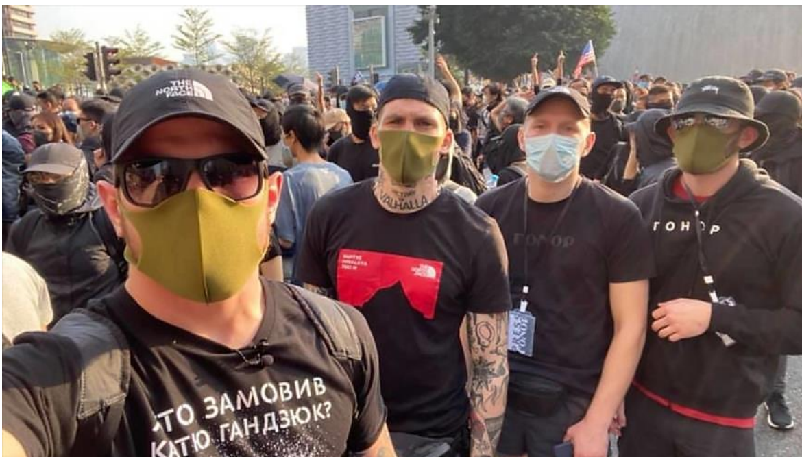
Extremismo de derecha en exportación: los nazis ucranianos del batallón "Azov" aparecieron en las protestas en Hong Kong

Hace cinco años que en Hong Kong, uno de los centros financieros más importantes del mundo, se suceden protestas masivas encabezadas por un difuso colectivo, que ni siquiera parece tener demasiado claro cuáles son los objetivos centrales de sus reclamos. En estos últimos seis meses las manifestaciones fueron continuas, y en ellas la violencia se ha incrementado.