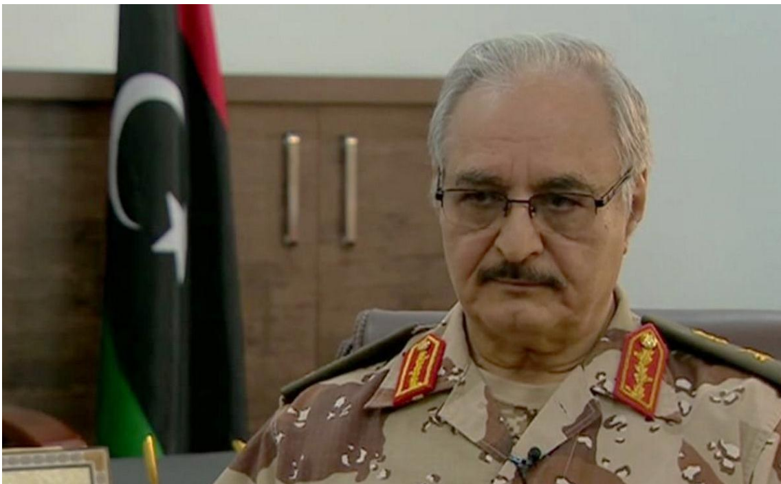
General Khalifa Haftar, uno de los contendores en la guerra que se libra en Libia.

Desde abril, tras el inicio de la ofensiva del general Khalifa Haftar al mando del Ejército Nacional de Libia (LNA) contra Trípoli (Ver: Libia: Más sangre que petróleo), más de 1200 civiles han sido asesinados y cerca de 300 mil desplazados, víctimas de la guerra estancada que se libra, entre las fuerzas de Haftar y las del Gobierno de Acuerdo Nacional (GNA) respaldado por Naciones Unidas (ONU). Los que finalmente fueron los dos bandos vencedores tras la entente occidental, que no solo terminó con el gobierno del Coronel Gadafi, sino que redujo a despojos lo que hasta febrero de 2011 fue la nación más desarrollada de África.