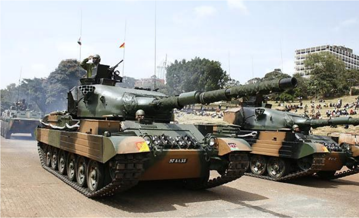
Tanques Vickers Mk-3 del Ejército de Kenia participando en un desfile militar.

La Marina de Kenia se estableció en diciembre de 1964, el cuartel central está ubicado en Mombasa. Tiene bases en Mombasa, Shimoni, Msambweni, Malindi, Kilifi y en Manda (ubicada en el archipiélago de Lamu). La fuerza naval está formada por buques patrulleros, carentes de misiles. El más grande los cuales es el P3124 KNS Jasiri, de origen español, que desplaza 1.400 toneladas y tiene 85 metros de largo.