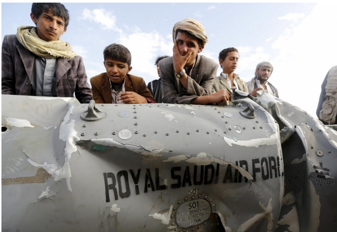
En Yemen, la población civil está en medio del conflicto, atravesando toda clase de penurias.

En marzo próximo se cumplirá cinco años de la bestial embestida que el reino Saudita acometió contra Yemen, que se encontraba entonces inmerso en una guerra civil, entre el grupo Ansarolá (Seguidores de Allah) más conocido Houthis por su líder Hussein Badreddin al-Houthi, una fuerza de milicianos compuestas fundamentalmente por chifés (25 por ciento de la población, frente a un 75 sunita) y amplios sectores sunitas , pobres, de los que se cree reciben apoyo de Irán y el Hezbollah , libanes -aunque en cinco años de guerra los servicios de inteligencia occidentales no han podido mostrar ninguna evidencia concreta-, intentaban derrocar al espurio gobierno de Abd Mansour al-Hadi, quien tras el derrocamiento de presidente Alí Abdullah Saleh, una de las “víctimas” de la Primavera Árabe , en un extraño