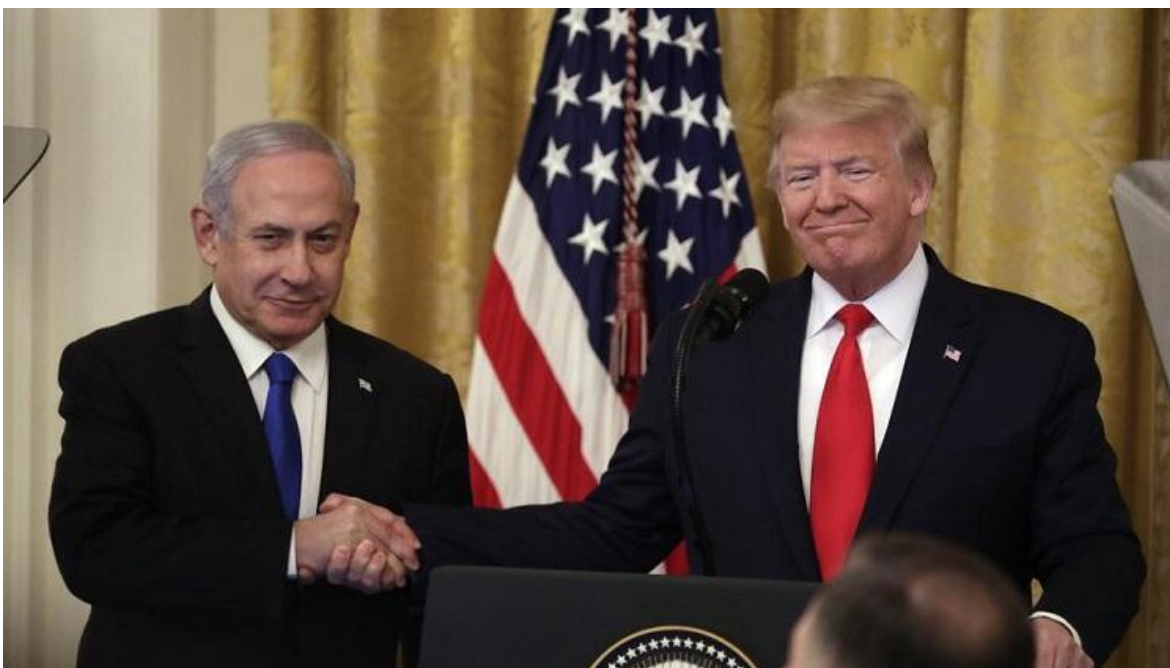
El presidente de Estados Unidos, Donald Trump, y el primer ministro de Israel, Benjamin Netanyahu.

Tras meses de incertidumbre, finalmente el pasado martes 28 el presidente estadounidense Donald Trump, presentó su plan para la paz en el Medio Oriente, en el que según se dijo: “Todos ganan, será la gran oportunidad a la paz tanto para Israel como para Palestina”.