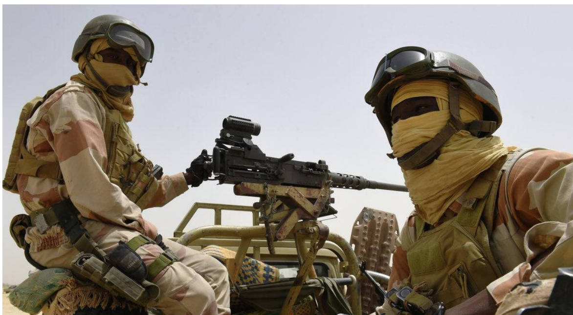
Tropas del ejército de Níger

Disimulado en la catarata de noticias que provocó el magnicidio del general iraní Qassem Soleimani y sus consecuencias, pasó casi desapercibido el ataque contra la base militar del ejército nigerino de Chinagoder, en la localidad de Tillaberi, próximo a la frontera con Burkina Faso, el pasado jueves 8 de enero, que dejó 89 soldados muertos, en el que también, según fuentes oficiales, 77 terroristas habrían perdido la vida.