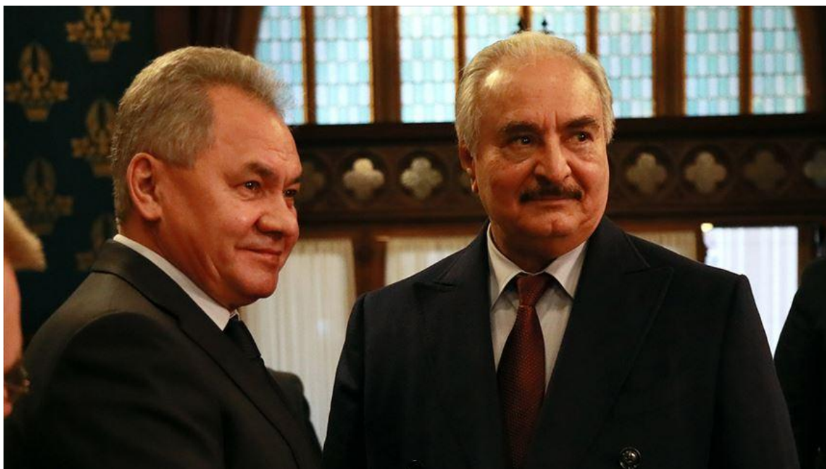
Comandante del Ejército Nacional de Libia (LNA) Khalifa Haftar dándose la mano con el Ministro de Defensa ruso Sergei Shoigu durante su reunión en Moscú, Rusia, el 13 de enero 2020.

Tras haberse retirado de la cumbre de Moscú, sin firmar el acuerdo de alto el fuego permanente, para iniciar un diálogo político, el general Khalifa Haftar líder del Ejército Nacional Libio , (ENL) y principal animador del conflicto, desairó, no solo a sus anfitriones el presidente ruso Vladimir Putin y su par turco Recep Erdogan, quienes habían gestionado la cumbre, sino que también a su contraparte un, hasta ahora, muy debilitado, Fayez al-Sarraj, jefe del Gobierno del Acuerdo Nacional (GNA), un hombre de paja puesto por Naciones Unidas, y cuyas fuerzas apenas controlan un perímetro cada vez más discutido en torno a la vieja capital libia: Trípoli, que sí había firmado el acuerdo. Haftar, tras ocho horas de conversaciones, pidió la noche para reflexionar y sin más abandonó Moscú, así lo declaró el canciller ruso Serguei Lavrov.