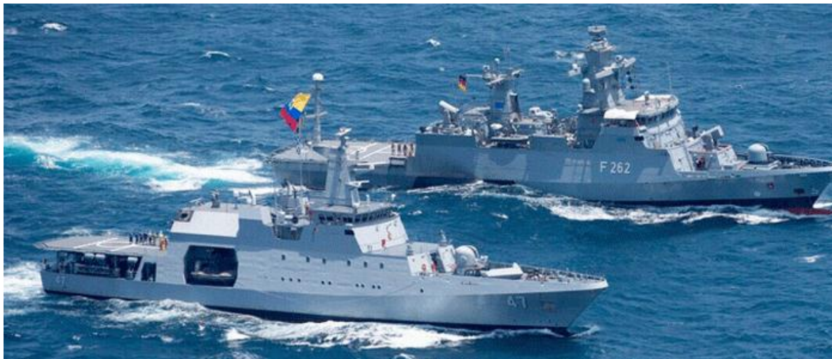
En primer plano el ARC “7 de Agosto” de la Armada Colombiana, detrás el buque “Meteoro” de la Armada Española, en navegación durante la operación Atalanta.

Durante el año 2015 el ARC “7 de Agosto” segunda unidad del modelo OPV-80 fabricado en Colombia por COTECMAR, participó en una operación antipiratería en el Cuerno de África, frente a las costas de Somalia.