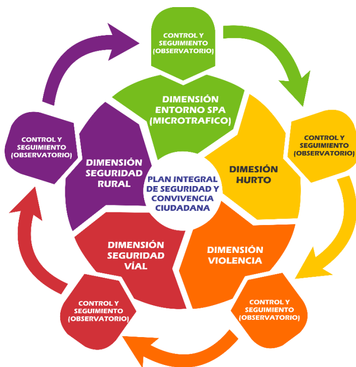
Dimensiones del PISCC del municipio de Yopal (2016). Imagen ilustrativa.

Por Julián David Urrego Atehortúa (Colombia)