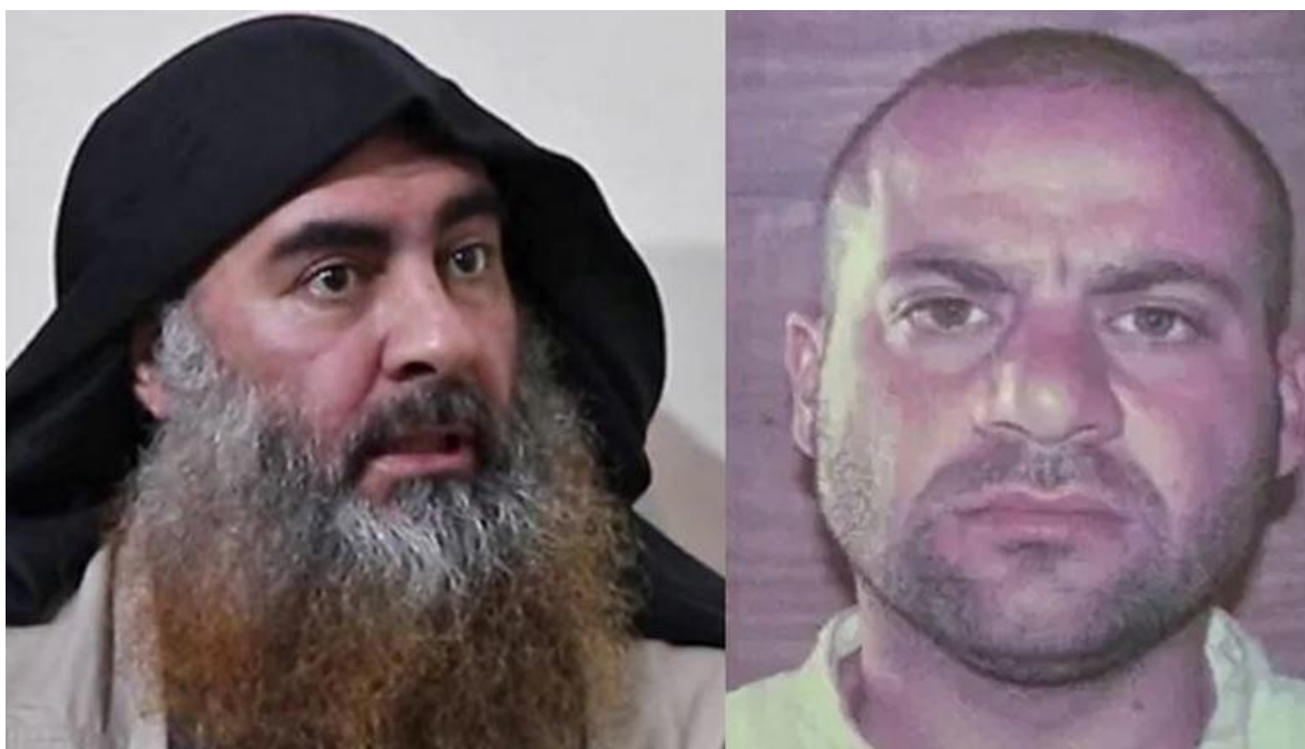
Abu Bakr al-Baghdadi (izq.) y su reemplazo Amir Mohammed Abdul Rahman al-Mawli al-Salbi

Casi de manera casi simultánea, junto a la noticia de la ejecución del líder y fundador del Daesh , Abu Bakr al-Baghdadi, se conoció que el nombre de su reemplazante Abu Ibrahim al-Hashemi al-Qurashi, alias Hajji Abdullah al-Afari, según lo poco que se pudo conocer en ese momento era un iraquí, antiguo oficial del ejército de Saddam Hussein (Ver Al-Baghdadi, el muerto oportuno.), y no mucho más, desorientado no solo a las agencias de inteligencia de todo el mundo, sino a muchos altos jefes de la organización terrorista, los que nunca habían escuchado ese nombre. Además de la identidad. A pesar del rápido relevo, más de una decena de khatibas o brigadas tributarias del Daesh , a lo largo de la geografía musulmana , realizaron su bay'ah o juramento de lealtad al ungido nuevo “emir de los creyentes”. Haciendo conocer videos en los que muyahidines del Boko Haram nigeriano, pasando por los egipcios de la Wilāyat Sina , el Daesh-Khorasan afgano-pakistani o el