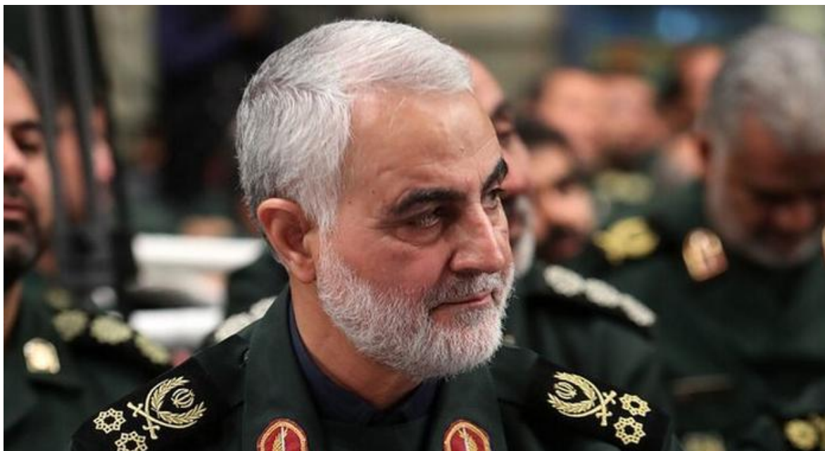
General Qassem Suleimani

Mucho se habló acerca de cómo Irán, iba a vengar la muerte del general Qassem Suleimani, (Ver. Qassem Suleimani ¿quién detendrá a la muerte?) Mucho más cuando pocos días después se conoce el ataque de misiles iraníes contra las bases norteamericanas de Ain al-Asad que Trump visitó a fines de 2018 y donde había drones tipo Reaper , los mismos, con que se había asesinado al general Suleimani, en el aeropuerto de Bagdad. El otro ataque se produjo en una base cercana a la ciudad de Erbil en el kurdistán iraquí. La “Operación Mártir Soleimani”, tuvo demasiado sabor a poco, y más cuando Donald Trump, informó que tras los ataques “estaban todos bien”, al tiempo que se desmentían los informes iraníes que hablaban de al menos 80 estadounidenses muertos y cerca de 200 heridos.