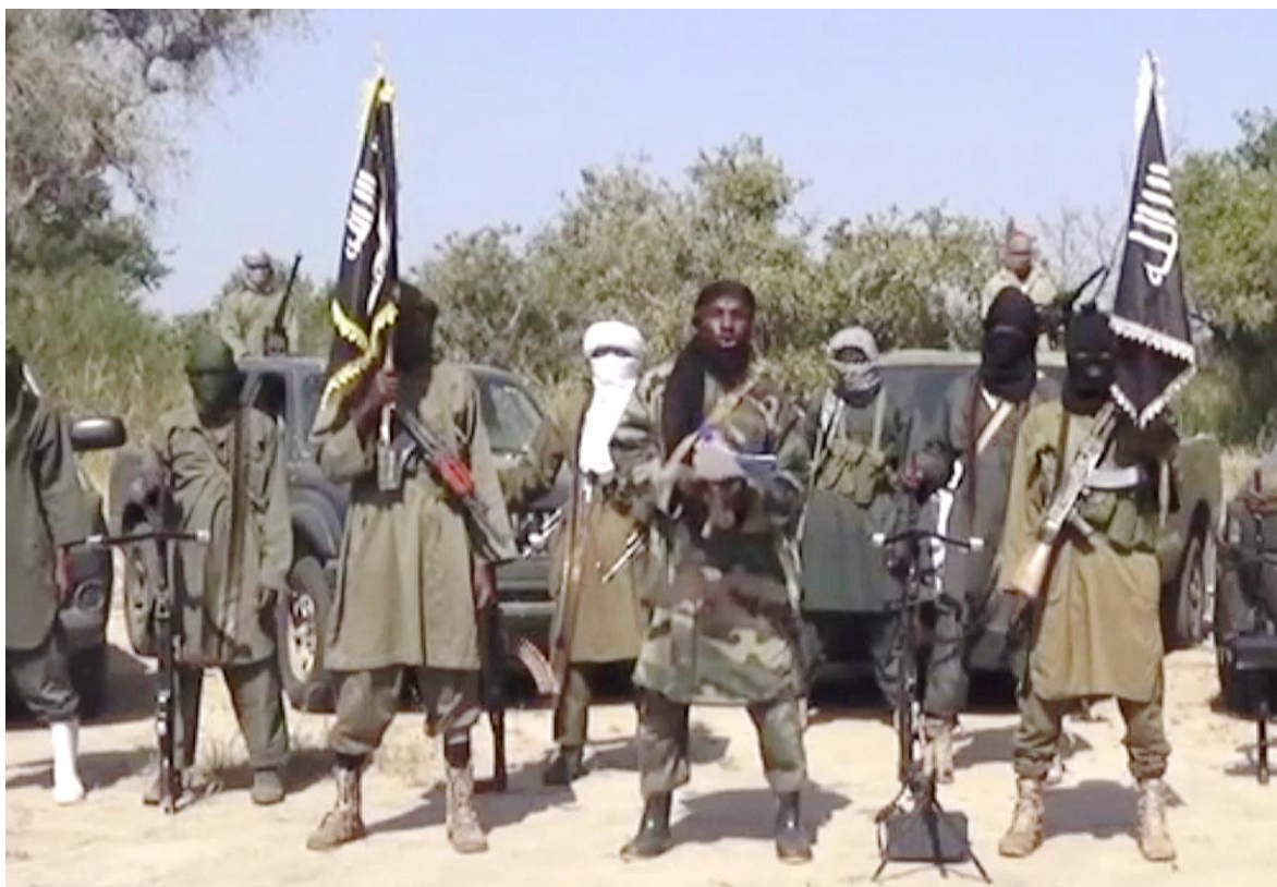
Integrantes del grupo terrorista Boko Haram en un video difundido por esa organización.

La organización fundamentalista Boko Haram, es sin duda la más letal de las que operan en África. El 23 de marzo, en solo dos acciones, separadas unos 500 kilómetros de distancia una de la otra, eliminó a 139 soldados de los ejércitos del Chad y de Nigeria, en una nueva demostración de su capacidad militar, frente a las acciones cada vez más lavadas de la fuerza multinacional que combate a esta insurgencia, la que desde el 2009 no deja de dar golpes rodeados de la estruendosa espectacularidad a la que es tan adepto su mesiánico líder Abubakr Shekau. Desde entonces ya son cerca de 50 mil los muertos, y casi dos millones los desplazados, mientras que otros ocho millones necesitan ayuda humanitaria, en el noreste de Nigeria, por acciones del grupo insurgente.