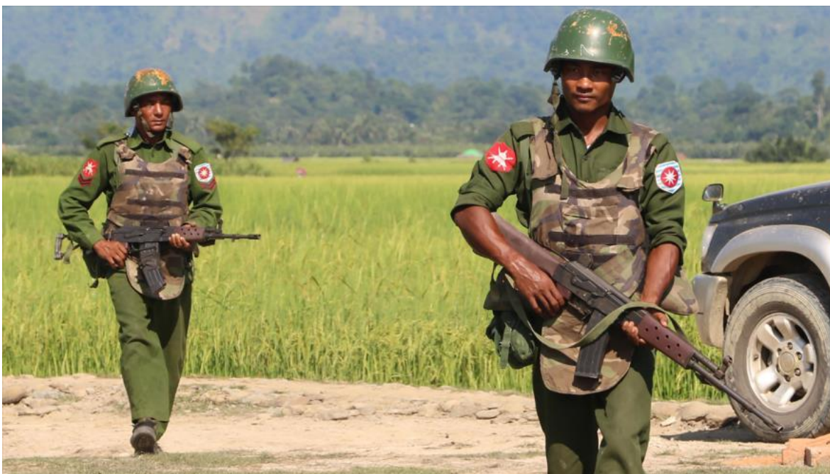
Tropas del Ejército de Birmania en un patrullaje.

A pesar de que el mundo se encuentra sumido, cómo nunca antes en la historia, con terror e impotencia en la tragedia del COVID 19, porque, y fundamentalmente cada uno de nosotros ha pasado del cómodo sillón de espectador a una tensa espera en el patíbulo, en diferentes lugares de mundo siguen librándose acciones igual de trágicas, aunque más acotadas. En el oeste de Birmania, se juegan fuertes intereses estratégicos entre India y China.