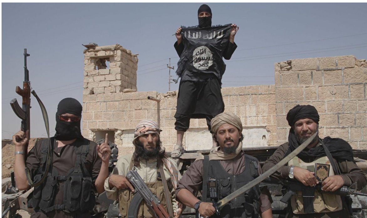
Combatientes del grupo terrorista Daesh.

La virulenta campaña anti islámica del Primer Ministro indio Narendra Modi que se verifica en la violenta represión contra los grupos independentistas de Cachemira, de mayoría musulmana, y la aplicación de la ley la Ley de Enmienda de Ciudadanía (CAA), con la que se procura dejar sin la nacionalidad a quizás millones de musulmanes indios, lo que ha provocado importantes protestas a lo largo de todo el país, durante el pasado mes de febrero, las que se han saldado con docenas de muertos, miles de detenidos, además de cuantiosas pérdidas materiales en barrios y comunidades islámicas, (Ver. India; los Dioses bastardos). A lo que se debe sumar que la constante propaganda del régimen neo nazi de Modi, está provocado también miles de episodios de violencia individual y “espontanea” hacia musulmanes, en comunidades que poco tiempo atrás, convivían en armonía. Se repite cada vez con más frecuencia que ciudadanos comunes de origen hindú, atacan a musulmanes provocando graves heridas y en algunos casos incluso la muerte.