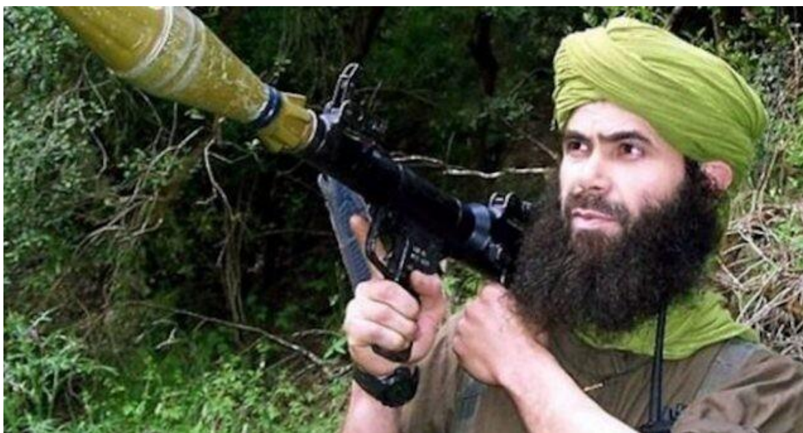
Abdelmalek Droukdel el líder terrorista presuntamente dado de baja.

De confirmarse finalmente la muerte del argelino Abdelmalek Droukdel, ya declarado muerto en varias oportunidades, uno de los emires más importantes de la organización Jama'at Nasr al-Islam wal Muslimin o Frente de Apoyo para el Islam y los Musulmanes, (JNIM, por sus siglas en inglés) una coalición tributaria de al-Qaeda global, sería el logro más importante conseguido por la Operación Barkhane, la dotación cercana a los más de 5 mil efectivos del ejército francés que desde el 2014 tratan, con poco éxito, de contener el terrorismo islámico en el norte de Mali, que ya ha desbordado de manera decisiva a Níger, Chad y Burkina Faso.