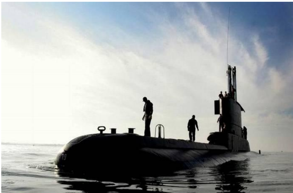
Submarino Océánico ARC "Pijao" de la Armada Nacional de Colombia

El Gobierno Colombiano encargó dos submarinos U-209/1200 al astillero alemán Howaldtswere Deutsche Werft (HDW), el primero de ellos fue abanderado y bautizado el 14 de abril de 1975 recibiendo el nombre de ARC "Pijao", mientras que el segundo se abanderó y bautizó el 18 de julio de 1975, recibiendo el nombre de ARC "Tayrona". En ambos casos la ceremonia especial se realizó el Kiel, ciudad sede del astillero HDW, desde donde los submarinos emprendieron el viaje a Cartagena de Indias, ciudad ubicada a orillas del Caribe colombiano, que es la sede de la Flotilla de Submarinos de la Armada Nacional.