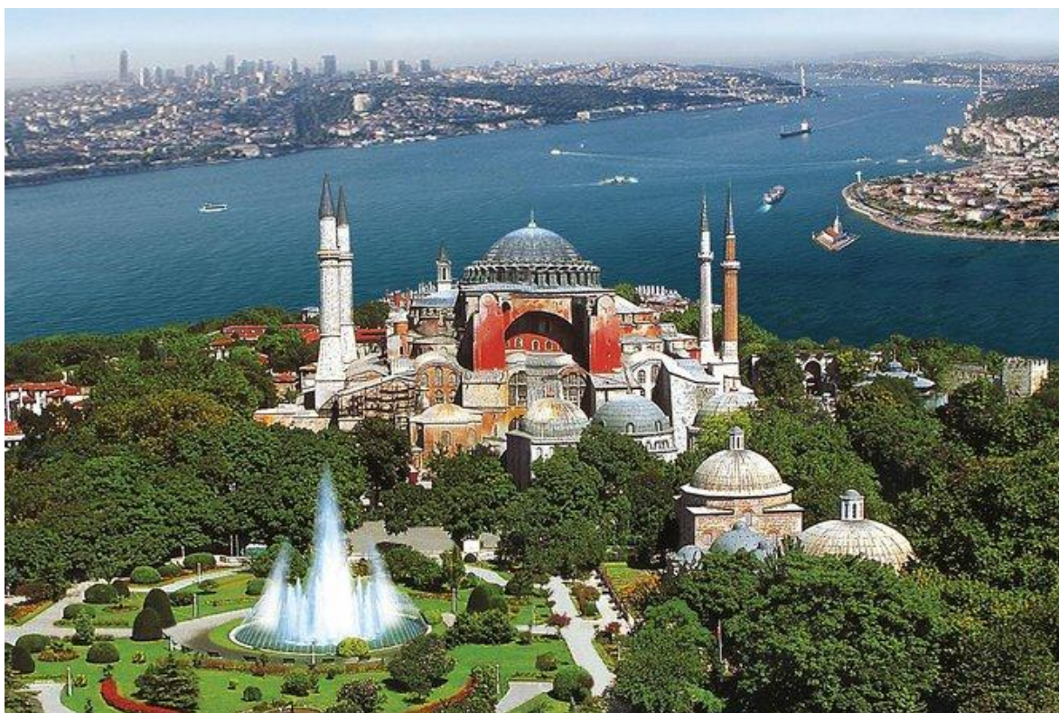
Hagia Sophia, en Estambul

Irak, Siria, Somalia, Libia, el Mediterráneo y ahora en el mismísimo Estambul, son los lugares donde en los últimos años el presidente turco Recep Tayyip Erdogan, saca músculo para mostrarse en el mundo un nuevo sultán, para conseguir el resurgimiento de un nuevo Imperio Otomano, quien se derrumbó con el fin de la Primera Guerra Mundial, y que prácticamente había regido al mundo musulmán desde el 1300.