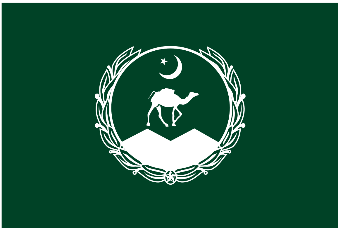
Bandera de Beluchistán, provincia Pakistán con aspiraciones independentistas.

El pasado lunes 29, un comando del grupo étnico-insurgente Ejército de Liberación de Beluchistán, (BLA), atacó el edificio de la Bolsa de Valores en Karachi, la capital económica de Pakistán. Dicha operación permite más especulaciones, que la de una simple acción terrorista.