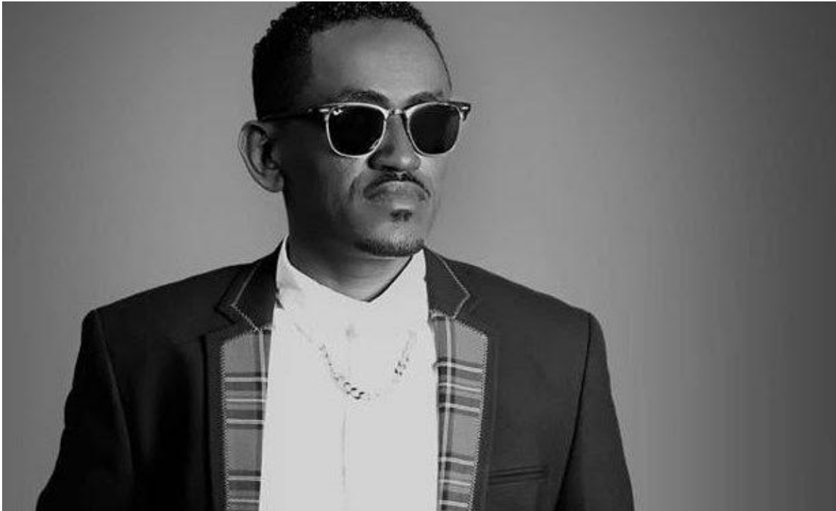
Hachalu Hundessa, cantante etíope asesinado presuntamente por motivos políticos.

Miles de jóvenes recorren las calles de Addis Abeba, la capital de Etiopia, con remeras negras que rezan “Yo también soy Hachalu”, en recordación de la estrella musical Hachalu Hundessa, de 35 años, quien en un hecho no esclarecido, tras ser herido de varios disparos en su automóvil, la noche del pasado 29 de junio, en el área de Gelan, un suburbio capitalino, moría horas más tarde en el Hospital General Tirunesh Beijing.