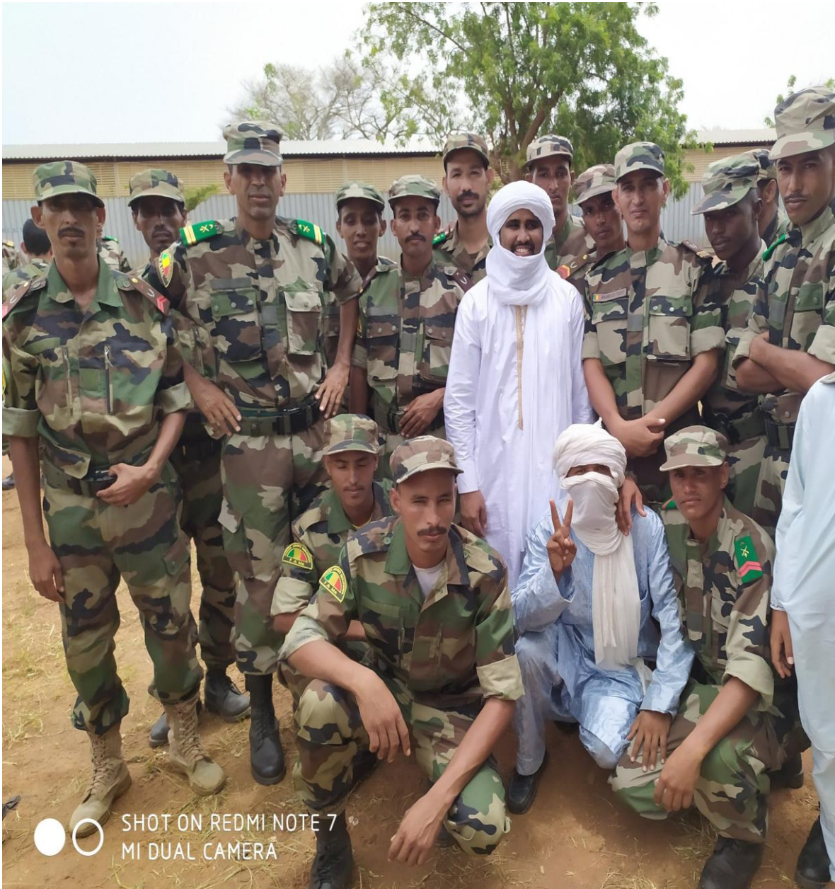
22JUL2019: Atentado suicida. Coche bomba contra punto de control principal, cuartel de las fuerzas francesas "Operación Barkhane" en Gao. 6 heridos soldados franceses y estonios.

18JUN2019: 41 muertos y 3 heridos. Ataques terroristas Fulani en Yoro y Dangafani II. Robaron el ganado y quemaron casas.