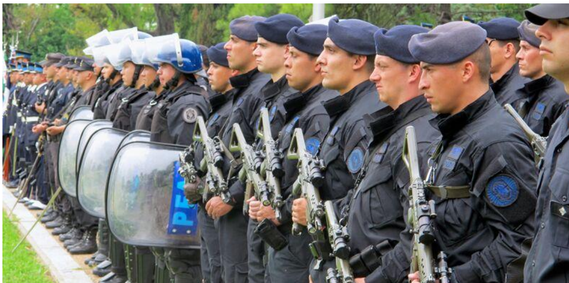
Miembros de la Policía Federal Argentina, mostrando sus distintas especialidades.

En estos días es muy frecuente estar frente al debate sobre qué tipo de Policía es lo que la sociedad pretende tener. Ciertamente el caso de la Policía de Minneapolis en la que está involucrado Derek Chauvin, ha sido un fuerte disparador del asunto, pero lo cierto es que éste es un debate que lleva muchos lustros en el casillero de pendientes. En muchas oportunidades vamos a escuchar o leer comentarios que se refieren a su eficacia, al modo de su correcta actuación o del empleo de los medios que utiliza o tan simple como si hace lo que debe hacer. Otros de los temas recurrentes, al menos en estos últimos tiempos, es si las Policías tienen una mayor o menor proximidad con los ciudadanos y el aumento de la Militarización de las Policías.