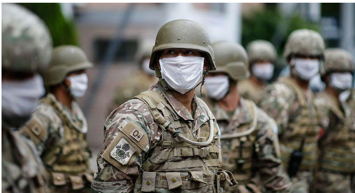
Soldados de la República Argentina. Imagen ilustrativa.

Comprendo que el título pueda generar confusión.