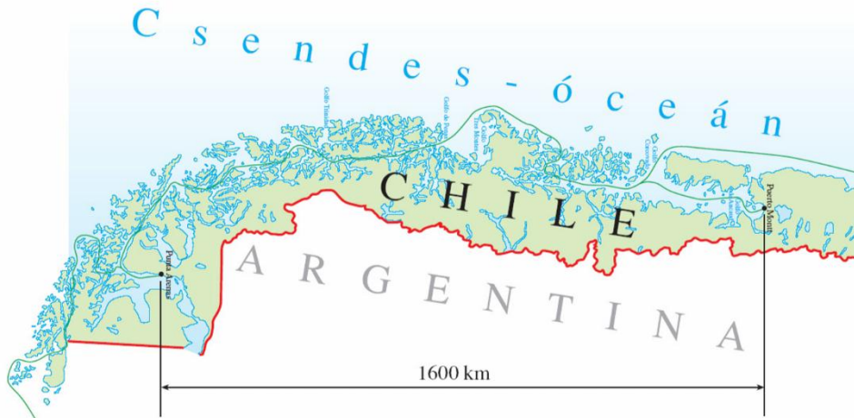
Figura 3. Las rutas de entrenamiento militar de los cruceros escuela de la Marina de Guerra alemana ( Berlin 1925, Emden 1927, Karlsruhe 1932, 1935, Schlesien 1938) en el gemelo geográfico de los fiordes noruegos, en los canales del Sur de Chile y de la Tierra del Fuego (1925-1938)