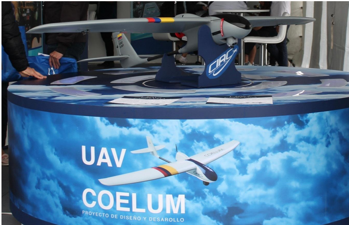
Aeronave Remotamente Tripulada Coelum de la CIAC.

La Corporación de la Industria Aeronáutica Colombiana - CIAC, empresa perteneciente al Grupo Social y Empresarial de la Defensa - GSED, lidera en el país la investigación y desarrollo en el tema de las Aeronaves Remotamente Tripuladas (ART). Hay que recordar que las ART tienen aplicación militar, pero también civil, son de “uso dual”, por ello el mercado es bastante amplio. En la revista Dinero (2018) se señala que, a juicio de los expertos, en el año 2050 es posible que el 80% de los ingresos del sector aéreo, provengan del diseño y fabricación de drones. A propósito, la misma fuente cita al General (r) Flavio Ulloa, quien para el momento era el gerente de la CIAC, cuando asegura ““Por cada dólar que se invierte hoy en este tipo de desarrollos se recaudarán US$10, una vez se implementen los sistemas y las líneas de producción”