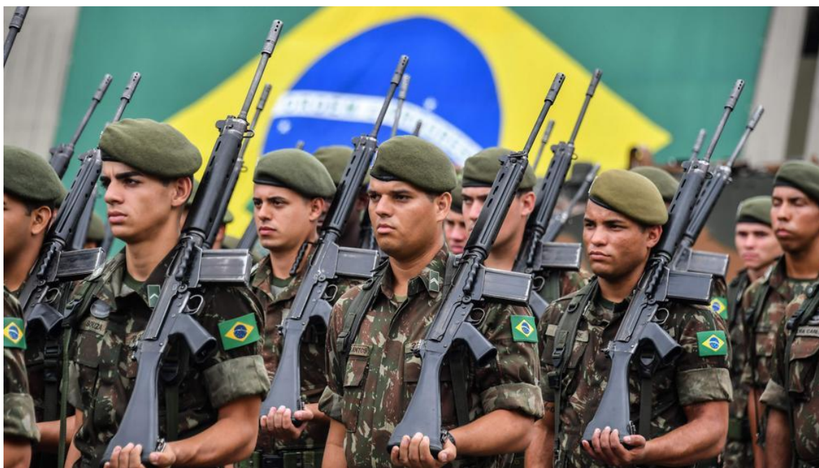
Soldados del Ejército Brasileiro. Imagen ilustrativa.

La frase del primer ministro francés de finales de la 1ª Guerra Mundial que disse “ La guerra es demasiado importante para dejarla en manos de los generales ” a que lideró la Francia en los años finales de la 1ª Guerra Mundial, sigue completamente vigente y puede adaptarse para el actual escenario político brasileiro. Podemos afirmar que la defensa nacional es demasiado importante para dejarla sólo en manos de militares.