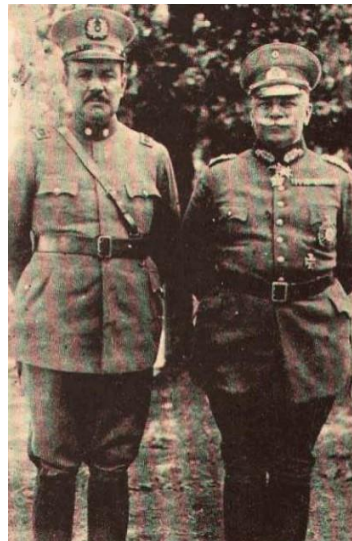
Presidente de Chile Gral. Carlos Ibáñez, con el Gral. Wilhelm Heye, 1929.