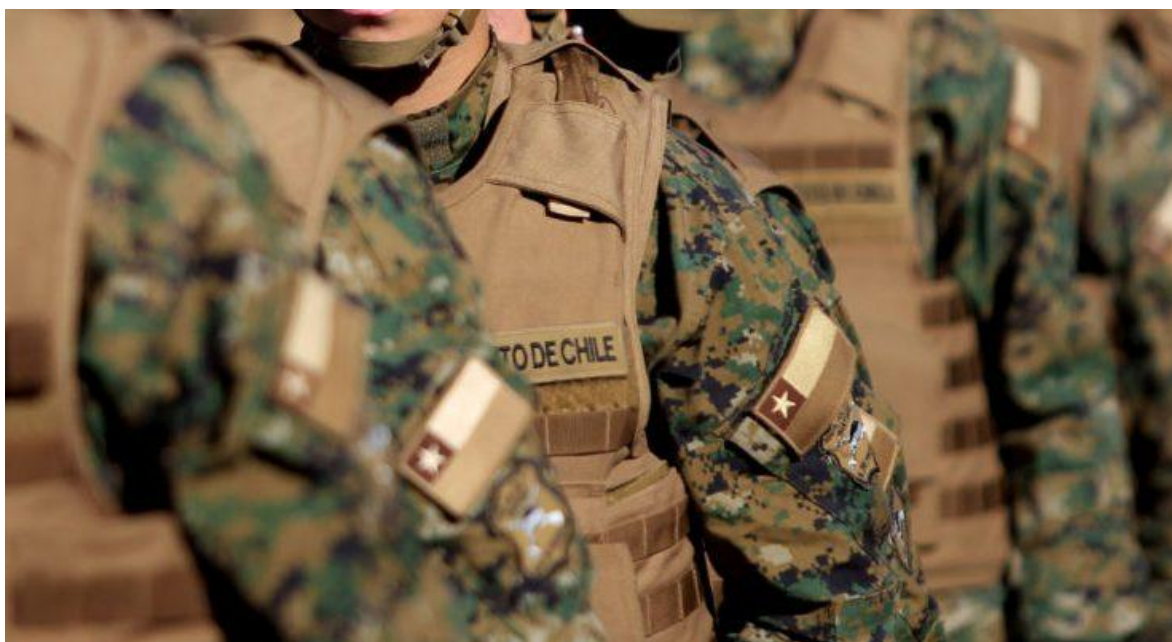
Soldados del Ejército de Chile. Imagen ilustrativa.

Estábamos por el año 2005, tenía unos 35 años y había terminado mi carrera policial siendo Especialista en Operaciones Policiales de Carabineros de Chile. Buscaba trabajo en alguna empresa privada al tiempo que además estaba terminando mi carrera profesional como Ingeniero en Administración de Empresas y desde algún lugar conocí que se estaban requiriendo ex comandos de las Fuerzas Armadas o Policiales para integrarse a Empresas Privadas de Seguridad Internacionales con trabajos disponibles en Medio Oriente, Europa y América, entre otros varios destinos.