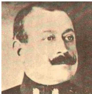
Gral. Francisco Javier Díaz Valderrama, 1927.

Las maniobras elaboradas por Díaz en realidad mostraban la manera en la que el alto mando alemán podía sobreponerse a las fortalezas de hormigón defensivas que se establecían en ese tiempo en Europa. Los ejercicios chilenos no simulaban ningún escenario en el que el ejército de ese país pudiera llegar a operar. De hecho, Perú y Bolivia no tenían una cadena de defensas de hormigón como las de los ejercicios y, en el caso de Argentina, los ríos iban en paralelo al eje del avance chileno en un hipotético caso de guerra.