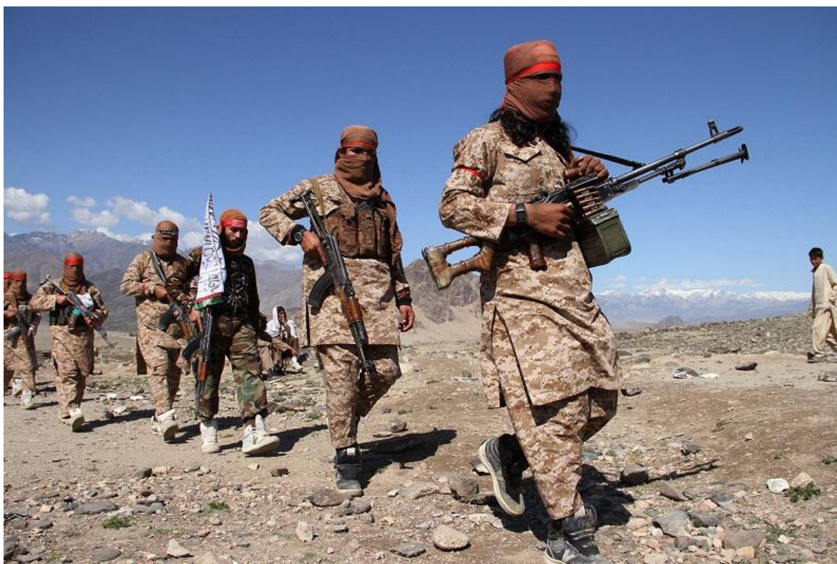
Talibanes en Afganistán.

El ataque a la prisión de la ciudad de Jalalabad, capital de la provincia de Nangarhar, a 150 kilómetros al este de Kabul, del pasado domingo dos, dejó no solo 29 muertos y cincuenta heridos sino una profunda duda sobre si la paz alguna vez será alcanzada en Afganistán.