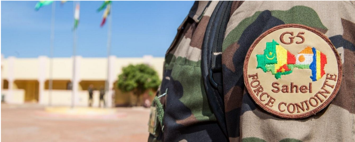
La coalición G5 Sahel (G5S) la conforman los ejércitos de Burkina Faso, Chad, Mauritania, Mali, y Níger.

El pasado 9 de agosto, hombres armados en motocicletas, atacaron el vehículo en el que viajaban seis voluntarios franceses de la ONG ACTED ( Agence d'Aide à la Coopération Technique Et au Développement ) junto a su guía y un chofer ambos nigerinos, cuando atravesaba la reserva de jirafas de Koure, a 65 kilómetros Niamey, la capital de Níger.