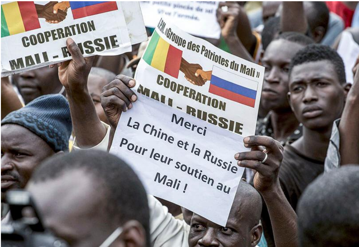
Pancartas que agradecen a Rusia y a China por su apoyo, presentes en manifestaciones en Mali.

Todavía es muy temprano, para evaluar las consecuencias del golpe del martes 18 de agosto, contra el presidente Ibrahim Boubacar Keïta (IBK), y que depositó en el poder al autodenominado Comité Nacional para la Salvación del Pueblo , (CNSP) un grupo de jóvenes coroneles, veteranos de la guerra que se libra en el norte del país desde 2012, contra dos importantes e intrincados conglomerados terroristas conocidos como Jamā'at nuṣrat al-islām wal-muslimīn (Frente de Apoyo para el Islam y los Musulmanes) o JNIM, tributarios de al-Qaeda y el Estado Islámico (Daesh) en el Gran Sáhara (ISGS) desde donde se han irradiado a varias países vecinos: Burkina faso, Níger y Chad.