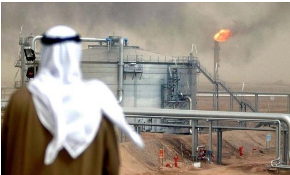
El desarrollo de Arabia Saudí, ha requerido de mano de obra extranjera para realizar distintas labores.

Se sabe que son todos pobres, migrantes que llegaron desde todos los rincones del islām , en procura de conseguir un trabajo para mantener a sus familias que quedaron quizás tan lejos como el sur de Filipinas, el norte de India, el Punjab pakistaní o en alguna remota aldea de Etiopía o Somalia, no se sabe cuántos son, ni cuantos han muerto, ni cuantos sobrevivirán al encierro al que están siendo sometidos, en condiciones absolutamente deplorables, a falta de alguna palabra que pueda describir mejor el infierno al que miles de trabajadores, acusados de expandir el Covid-19 , fueron encerrados al arbitrio de la tiranía más próspera y reverenciada del mundo: Arabia Saudita.