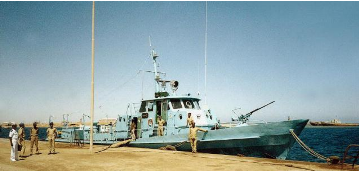
Lancha patrullera clase Kadir

La fuerza naval fue establecida en 1962, opera sobre el Mar Rojo, desde las bases navales de Marsa Gwayawi y el Rio Nilo, tiene entre sus filas unos 1800 efectivos.