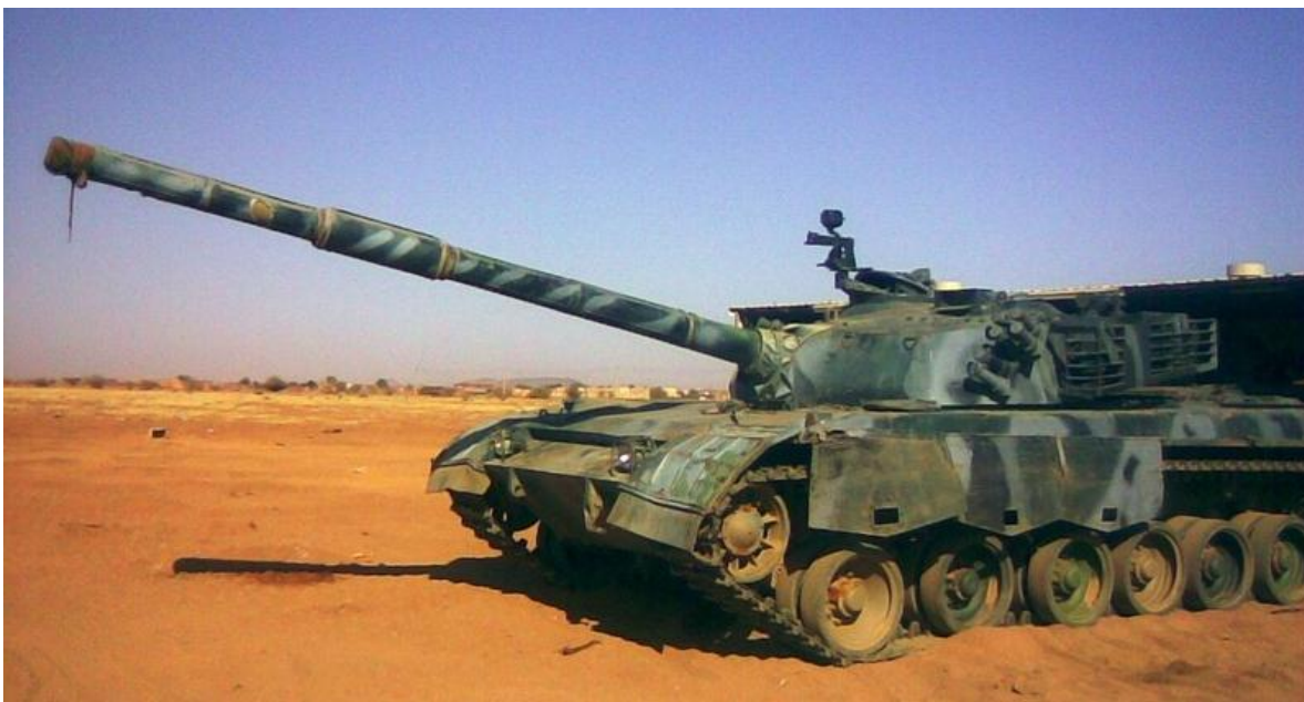
MBT Al Bashier (Tipo 85M-II)