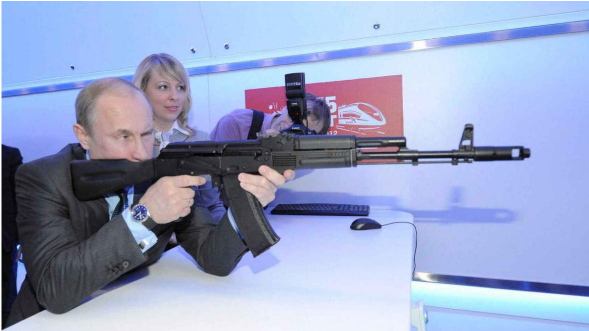
Vladimir Putin, el "asesino" del mundo unipolar.

Con la firmeza y lucidez del tío borracho en esa reunión familiar en las que hace décadas nadie lo escucha, el presidente norteamericano, Joe Biden, contestó a la sutil pregunta del periodista George Stephanopoulos, quién faltó de inspiración buscaba un título: "¿Es Putin un asesino?" La respuesta ya es mundialmente conocida: "Sí" y agregó, con la templanza característica de los pro hombres norteamericanos: "El precio que va a pagar, lo verá en breve", agregó sin dar más detalles: Lo que podría significar, si seguimos el razonamiento de sus predecesores, que solo nos queda esperar que pronto invadirá la Federación de Rusia, como lo ha hecho con Irak o Afganistán, en que miles de nativos se empeñaron en morir bajo las bombas democráticas de la aviación norteamericana, o quizás envíe un comando de tropas especiales para secuestrar al presidente ruso, y someterlo a la