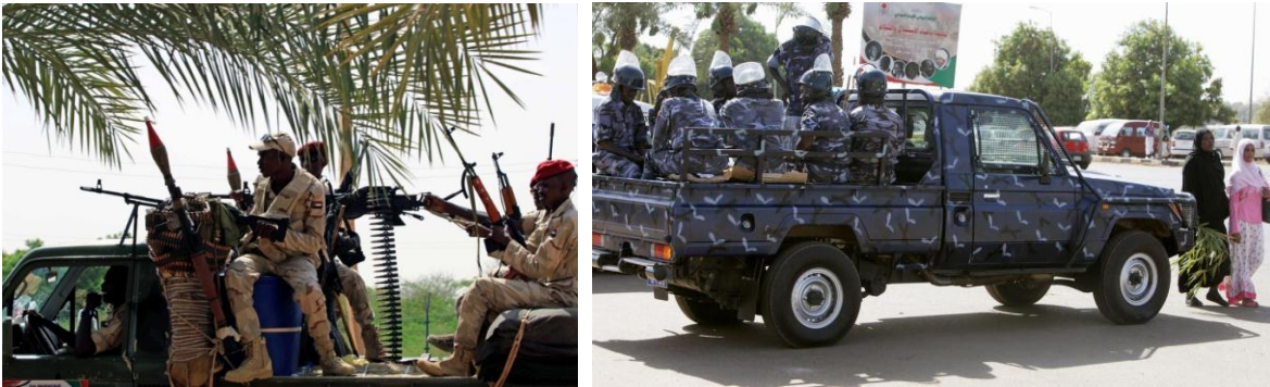
Tropas sudanesas en patrullaje rural y urbano.

República Federal Presidencialista, independiente de Gran Bretaña desde el 1ero de enero de 1956, la mayoría de sus habitantes profesan la religión islamista, el idioma oficial es el árabe y el inglés.