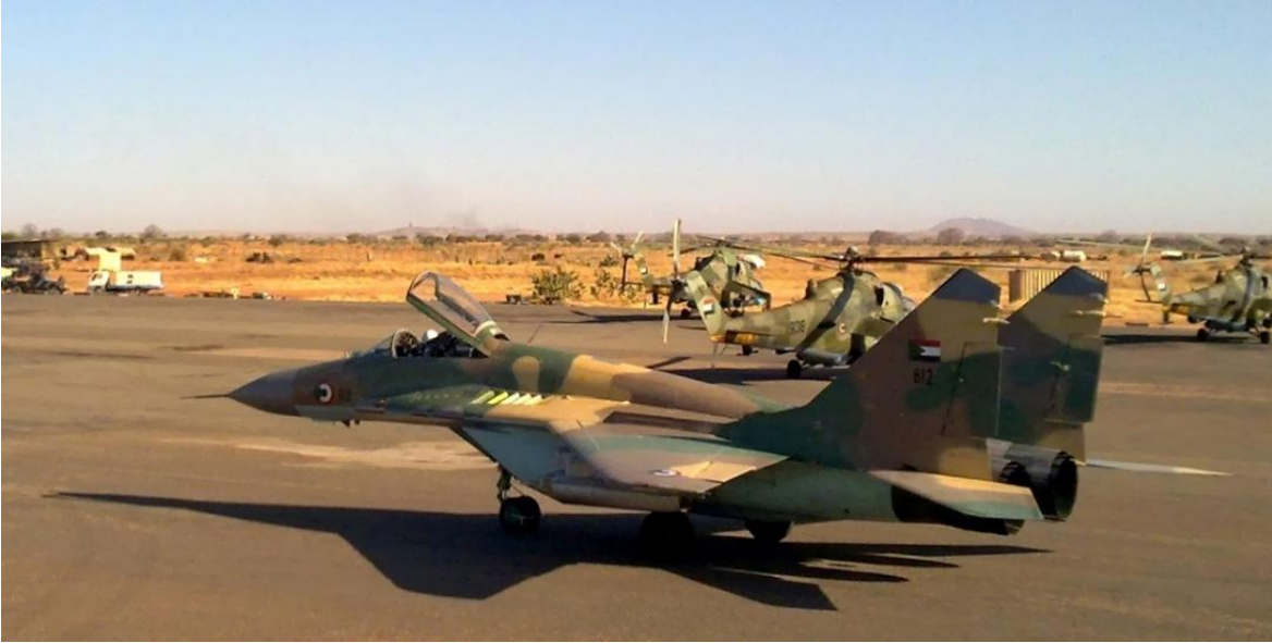
Caza Mig-29 de la Fuerza Aérea de Sudán

Creada en 1956 tras la independencia, con asistencia británica, la fuerza tiene hoy entre sus filas unos 13.000 efectivos.