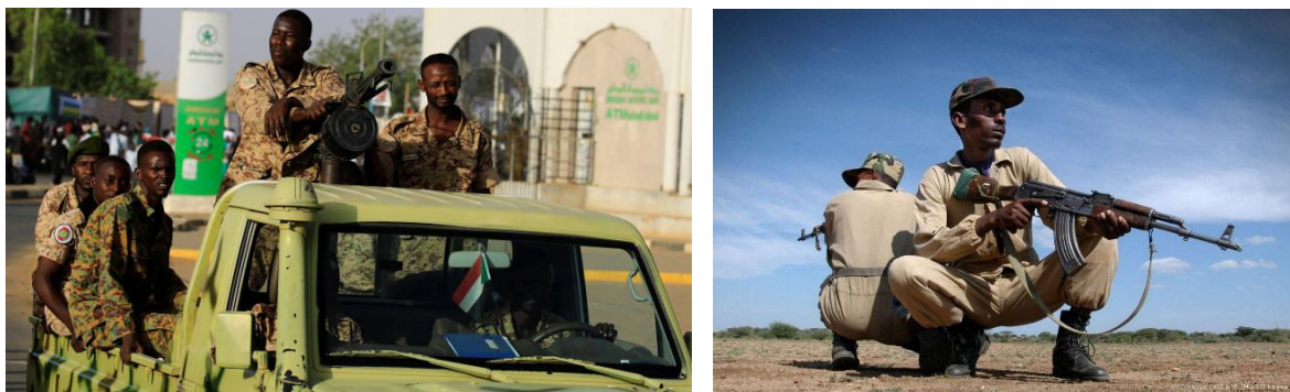
Tropas sudanesas en patrullaje rural y urbano.

Sudán es un país sub desarrollado, con más de 30 años de guerras internas que limitan el avance económico. Hoy 3/4 partes de su población vive de la agricultura, fundamentalmente de los valles a ambas costas del río Nilo. Desde mediados de los años 70 ha incrementado su producción y exportación de petróleo y derivados, desde hace una década son la principal fuente de ingresos de divisas de la nación, esto le permite llevar a cabo un importante desarrollo en infraestructura.