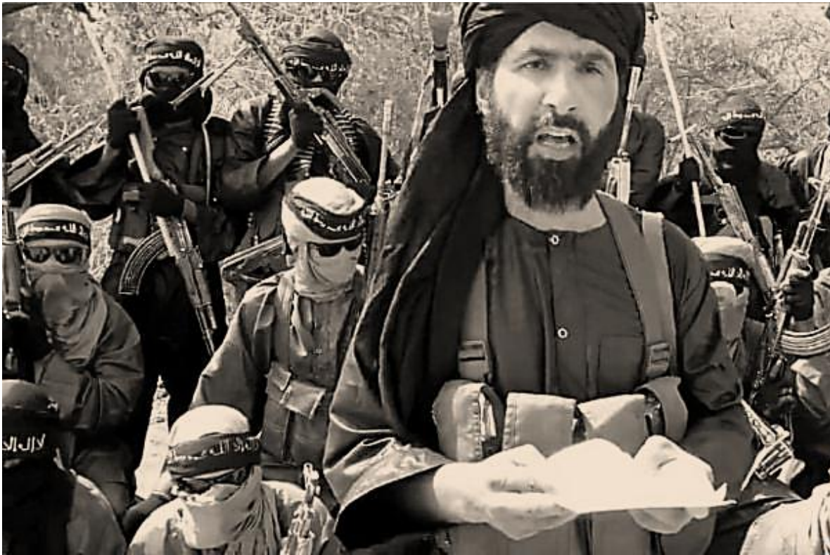
Adnan Abu al Walid al Sahraoui

Desde hace varias semanas, se rumoreaba que finalmente las fuerzas francesas que operan en el Sahel, localizaron y consiguieron “neutralizar” al emir del Estado Islámico en el Gran Sahara (EIGS), lo que recién fue confirmado este último miércoles 15 de septiembre por el presidente francés Emanuel Macron, en un twitter, en el que confirma la muerte de Adnan Abu al-Walid al-Sahraoui y califica dicha operación como un “gran éxito”, de los efectivos de la Operación Barkhane , que desde hace nueve años están intentando derrotar con la insurgencia fundamentalista que estalló en 2012 en el norte de Mali, y desde entonces, no sólo ha permeado con muchísima fuerza las fronteras de Burkina Faso, donde prácticamente han paralizado todo el norte de ese país, y hacía Níger, donde los