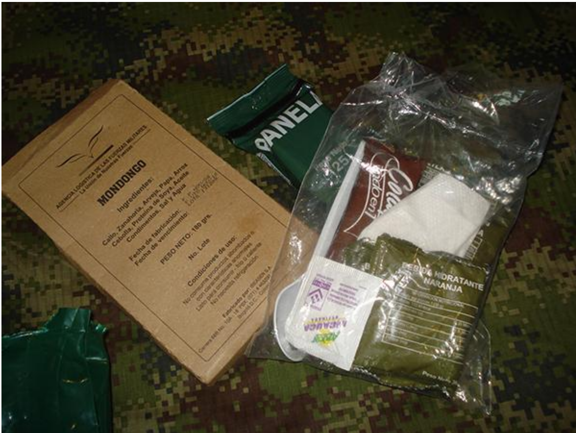
Allí se observa una ración individual de “mondongo”, un plato típico colombiano, y una porción de “panela”.

La frase “un ejército marcha sobre su estómago” atribuida a Napoleón, da cuenta de la importancia de la logística militar. Sin una buena logística que provea al ejército de todo lo necesario, las operaciones militares fracasarán. La frase citada, hace alusión directa al tema de la alimentación, por encima de las municiones y otros pertrechos. Siendo qué, ofrecer a la tropa una alimentación deficiente o inadecuada, no solo bajará la moral, sino que debilitará físicamente al personal. Demás está decir que la ausencia de alimentos conducirá inexorablemente al fracaso de la campaña, y a la derrota.