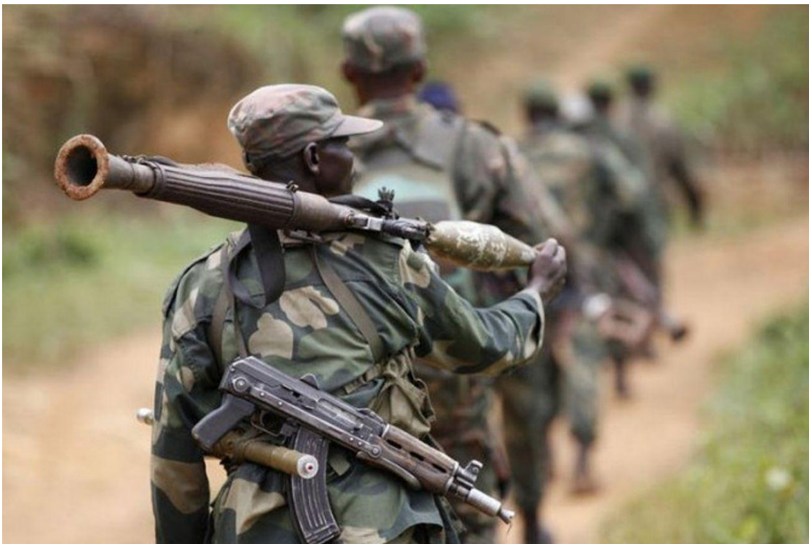
Combatientes congoleños de patrulla.

Casi de manera imperceptible, para la gran prensa internacional, el Daesh o Estado Islámico (ISCAP), también llamado Fuerzas Democráticas Aliadas (ADF), no solo se ha instalado en la República Democrática del Congo, sino que, con ataques constantes, se expande al tiempo que afianza lazos con organizaciones “hermanas”, que operan en el resto del continente.