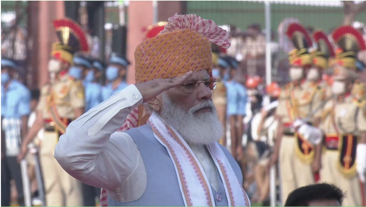
Narendra Modi, Primer Ministro de la India.

India corre el riesgo de incendiarse en una guerra multireligiosa, de la que su mayor responsable es el Primer Ministro Narendra Modi, quien ya desde sus primeros años como gobernador del estado de Gujarat, agitó las diferencias religiosas como un arma política para imponer sus concepciones neoliberales en lo económico y ultra conservadoras, seudo fascistas en la organización social. Postulados que el Bharatiya Janata Party (BJP), que lo ha llevado dos veces a la gobernación Gujarat, (2001-2014) como la convertirlo por dos periodos, desde el 2014 al 2019 y su segundo periodo que se extenderá hasta el 2024 como la máxima autoridad de la Unión India.