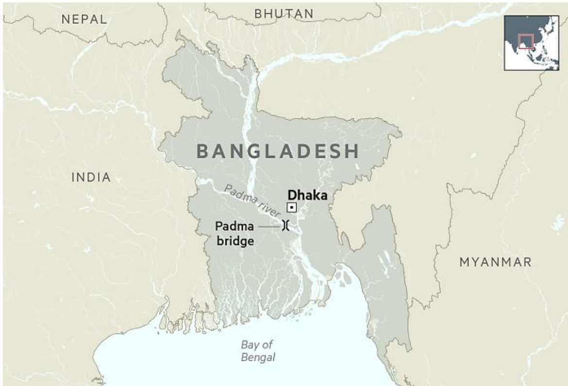
Referencia geográfica de Bangladesh.

No sabemos si los estallidos de violencia religiosa que desde hace un par de semanas estallaron en Bangladesh e India, alentados por las políticas anti musulmanes del Primer Ministro indio Narendra Modi, están a tiempo de ser controlados. Desde el pasado trece de octubre en Bangladesh, la ola de ataques a diferentes mandires (santuarios hindúes ), no han logrado ser detenidos. (Ver: India: Guerra a los Dioses).