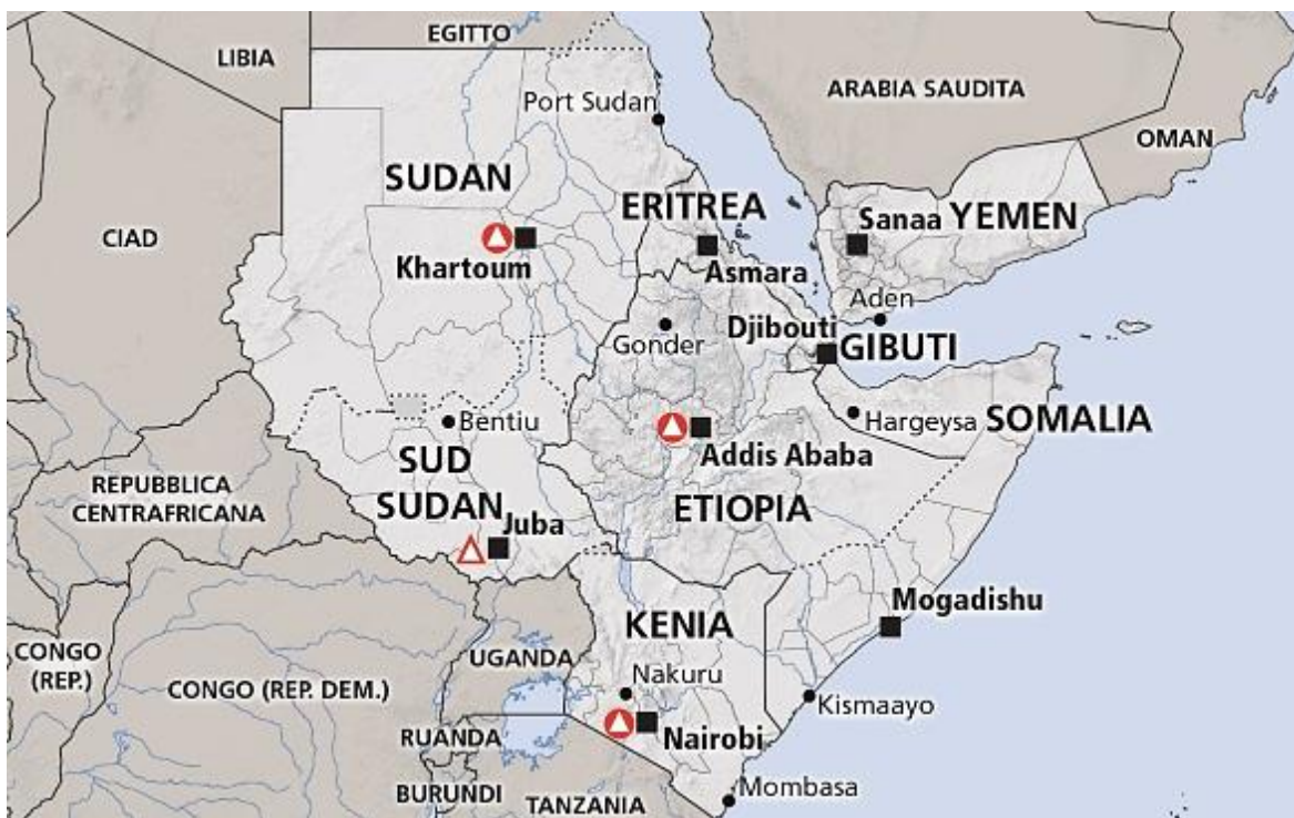
Referencia geográfica del Cuerno de África.

Una vez más un golpe de estado sacude a una nación africana, en la mañana del lunes 25 de octubre, se conoció que las fuerzas armadas sudanesas, durante las primeras horas de ese día, detuvieron y trasladaron a un lugar desconocido al Primer Ministro, Abdalla Hamdok, junto a la mayoría de los ministros del gabinete y funcionarios civiles del Consejo de Soberanía, que desde el golpe de 2019, contra Omar al-Bashir, tras treinta años en el poder, se habían comprometido a llevar al país a la institucionalización, teniendo como mira las elecciones programadas para el 2023.