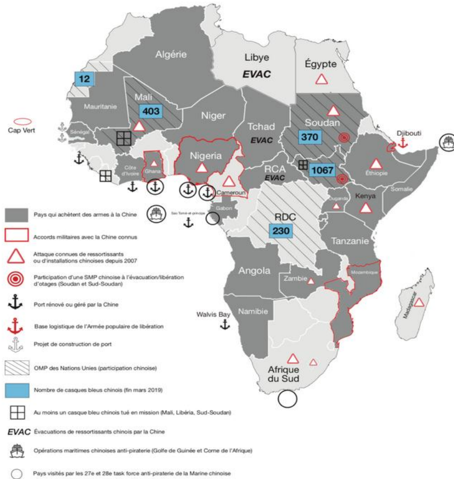
Influencia De la China en África