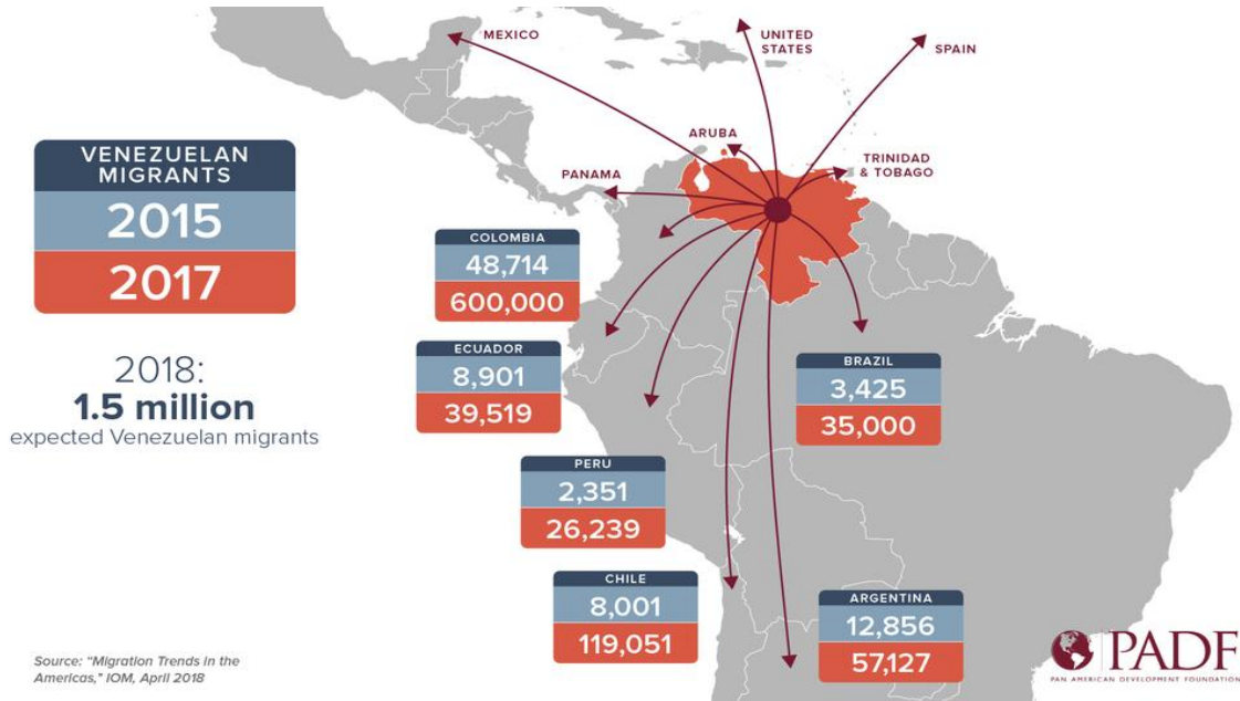
Migración de Venezuela a América del Sur

Sin embargo, el problema de América del Sur hoy es el de Venezuela. Venezuela inició su giro político hacia el socialismo con el expresidente Hugo Chaves. Después de Chaves, Nicolás Maduro ahora conduce a este país todos los días hacia una política contra el capitalismo y contra Occidente. Venezuela es un país rico en petróleo, pero en los últimos años su economía ha caído drásticamente. Entonces su población comenzó a escapar a Brasil y otros países de América del Sur.