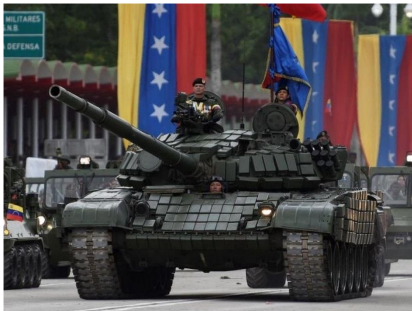
Tanque T-72 del Ejército Venezolano

En los últimos años Venezuela ha incrementado sus relaciones con Rusia y como resultado hoy en día existe equipamiento militar ruso en el continente sudamericano. Según el sitio web de Global Fire Power , que cuenta las capacidades militares en todo el mundo, Venezuela puede tener 92 T-72 de origen ruso. Estas cifras nos muestran que el vínculo político y de las ideologías Rusia-Venezuela ya está hoy vinculado a una capacidad militar en el continente.