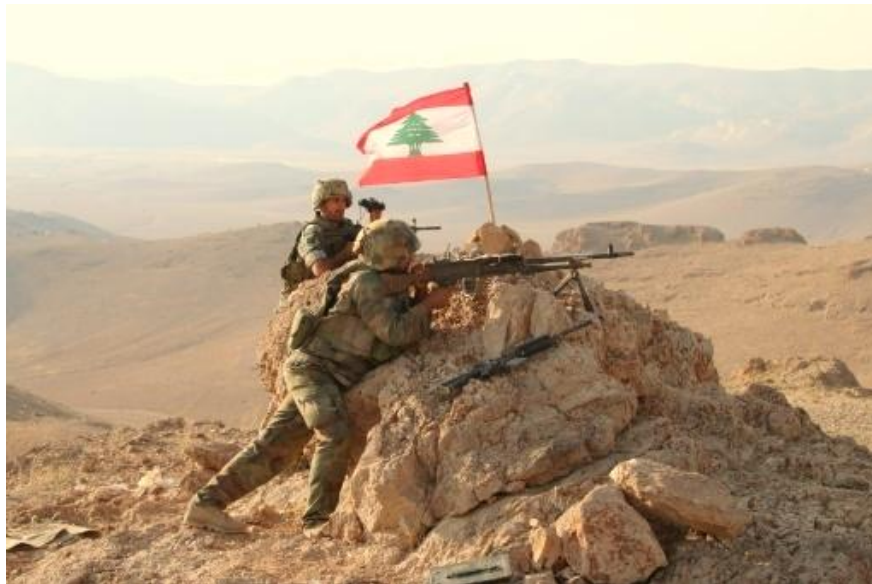
El ejército libanés en acción contra los yihadistas

La estabilización alrededor de Israel hoy se debe a la asociación entre Israel e Inglaterra y los Estados Unidos y también principalmente a la mejora de las fuerzas terrestres de Jordania y Líbano por parte de Francia. Es obvio que la estabilización de estos países juega un papel fundamental en la protección del territorio de Israel.