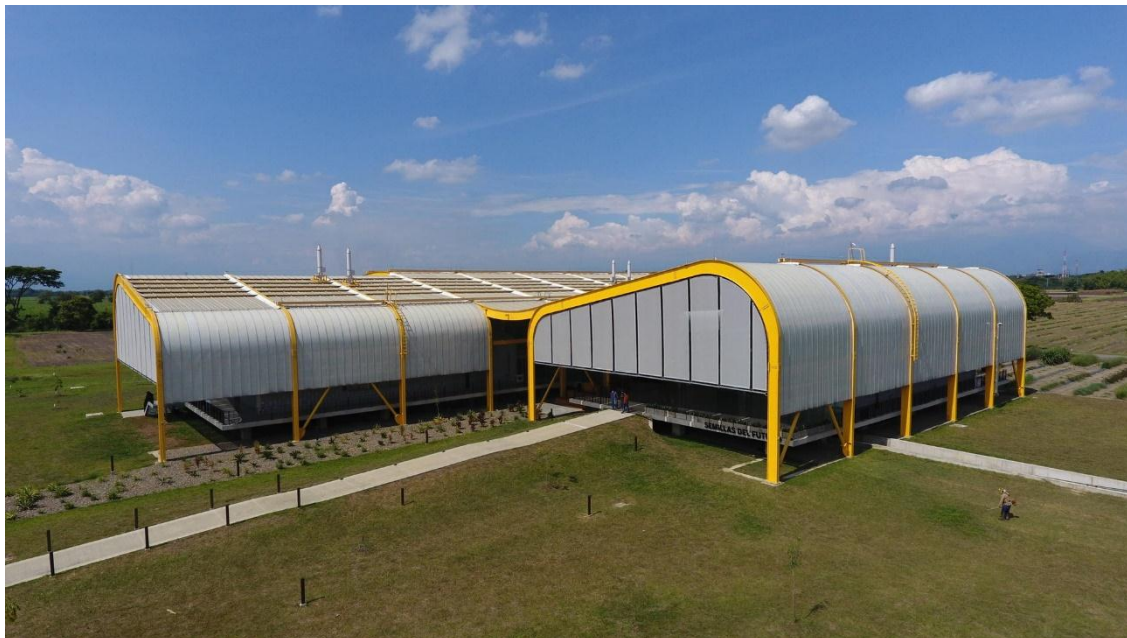
Instalaciones de Semillas para el Futuro, en Palmira, Valle del Cauca, Colombia.

En Colombia tenemos el “Banco de Semillas para el Futuro”, que almacena las colecciones más importantes del mundo de frijol, yuca y forrajes tropicales. Semillas para el futuro tiene en Svalbard una copia de seguridad del 90% de su colección (2020).