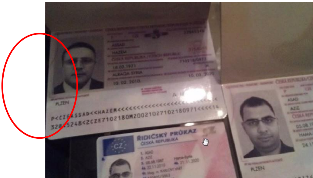
En círculo rojo el búlgaro y en el resto de las fotos el sirio

Como ya he comentado en alguna de mis colaboraciones, me encontré sirviendo al mundo de bien; ya obvio lo de país, patria, pues me siento bastante apátrida; lo llaman "democrático",... -sin comentarios-, entre los años 2012 y 2015 en el conflicto sirio, y fui testigo directo de muchas cosas, entre otras lo que yo denomine la "ruta búlgara", ruta de infiltración de refugiados y no refugiados en la Europa comunitaria a través de usurpación de identidades (adjunto una foto de mi colección, recogida sobre el terreno, donde un sirio sustituye con éxito a un búlgaro fallecido).