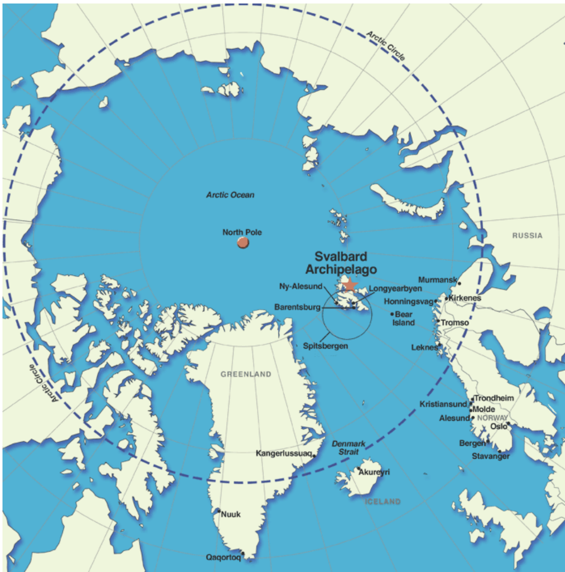
Ubicación geográfica del archipiélago de Svalbard..

El Banco Mundial de Semillas se encuentra en un archipiélago llamado Svalbard, ubicado dentro del círculo polar ártico. En Svalbard se almacenan muestras de la agrobiodiversidad mundial. Los bancos de germoplasma del mundo guardan allí duplicados de sus colecciones. Es decir que, en este lugar, se resguarda la suma de agrobiodiversidad del mundo, por ello fue diseñado con el fin de resistir guerras y un conjunto de catástrofes globales, incluyendo eventos de extinción masiva, y servir de apoyo para la reconstrucción de la civilización humana. Por eso también se le llama “Bóveda del fin del mundo”.