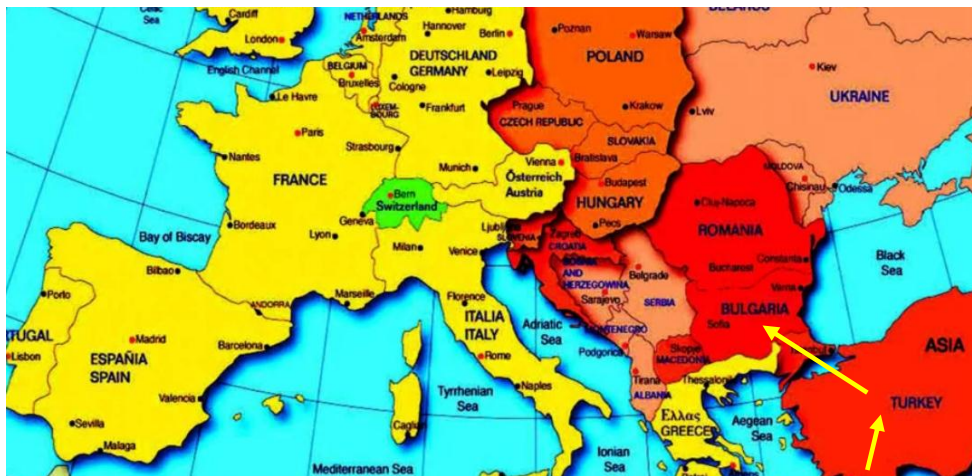
Ruta búlgara. Recordar que Siria limita con Turquía y ésta con Bulgaria. A mi servicio de inteligencia no pareció interesarle mucho este asunto.

Cómo decía al comienzo, la película versa sobre la utilización de lo que se denominan "bombas sucias" para acciones terroristas. ¿Qué es una bomba sucia? No llegan a ser bombas o artefactos "profesionales", pero