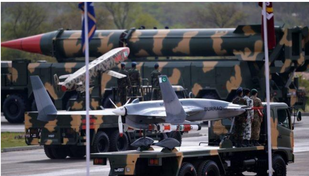
Paquistán es un país con capacidad nuclear y fuertemente armado.

Mientras Pakistán se bate con las consecuencias de la monstruosa crisis climática, que a la velocidad del rayo, se cierne también sobre el resto del mundo, lidiando primero con olas de calor desconocidas que terminaron de manera brutal con la primavera. Produciendo un magro rendimiento de los cultivos e incrementando el derretimiento de sus glaciares. Lo que, combinado con la temporada de los Monzones , la que todavía no ha terminado, hicieron que este año, las lluvias no solo fueran más extensas en el tiempo, sino también, mucho más virulentas. La situación provocó daños prácticamente en toda la geografía pakistani, ya que más de un tercio del país ha sufrido de manera directa esta combinación, dejando cerca de 1.500 muertos y afectado a más de treinta y tres millones de personas. La particular virulencia de las aguas que han destruido prácticamente el noventa por ciento de los sembradíos en la provincia de Sindh, la mayor productora de alimentos, mientras que la tres cuartas partes de la provincia de Baluchistán, la más extensa del