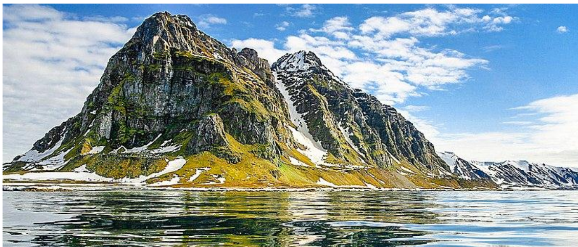
Panorámica de una de las islas del archipiélago de Svalbard.

Por otro lado, las colecciones que tenemos en Colombia son muy importantes, pero no son suficientes para proveer la seguridad alimentaria de nuestra propia población. Colombia debe garantizar la continuidad de sus actuales bancos de germoplasma, y aumentar, no solo sus capacidades, sino también el número de colecciones e incluir otras especies, incrementando la agrobiodiversidad allí conservada y protegida.