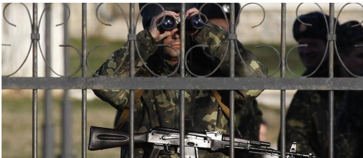
Los talibanes en el poder, deben extremar medidas de seguridad, frente a potenciales ataques terroristas.

Un nuevo suceso ha vuelto a poner en vilo la realidad afgana y reavivar la guerra que el Daesh Khorasan , viene librando contra el Talibán , desde que el grupo fundado por Abu Bakr al-Bagdadí, en 2014, logró instalarse en el norte de Afganistán, según la inteligencia iraní, con ayuda de la CIA, en 2015.