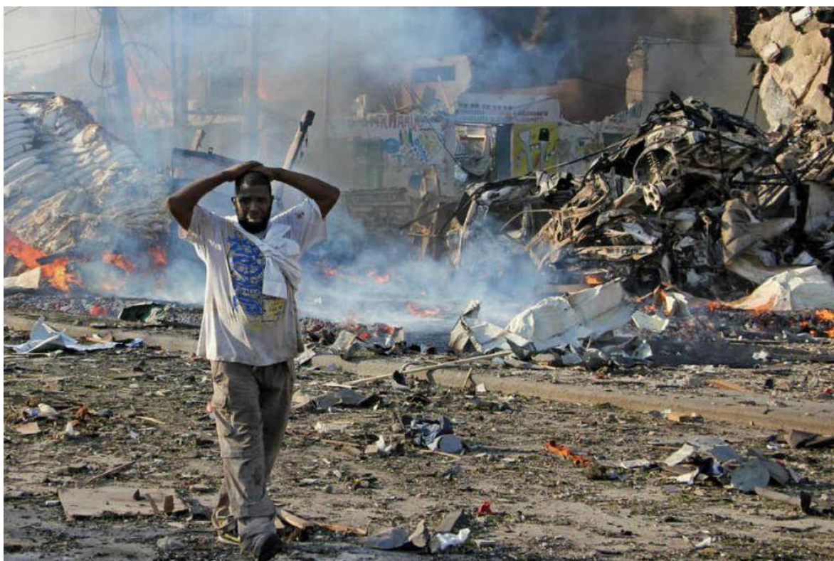
Imágenes de muerte y destrucción que se repiten una y otra vez en Somalia.

Con una operación, ya clásica, del grupo fundamentalista somalí al-Shabaab , la franquicia de al-Qaeda en el cuerno de África, durante la noche del viernes diecinueve, inmediatamente después del Magreb , la oración del atardecer, un grupo de sus muyahidines tomó el hotel Hayat , ubicado en pleno centro de Mogadiscio, la capital del país, tras lo que se inició el asedio de las tropas gubernamentales que se prolongó por unas treinta horas, dejando un saldo de 21 muertos y 130 heridos, muestra de la intensidad de los combates es que gran parte de la estructura del edificio ha sido prácticamente demolida. Lo que convirtió a este ataque en el más sangriento de los últimos meses. Desafiando las políticas del nuevo presidente somalí, Hassan Sheikh Mohamud, quien fue elegido a mediados de mayo y asumió el cargo a principios de agosto, en su plan