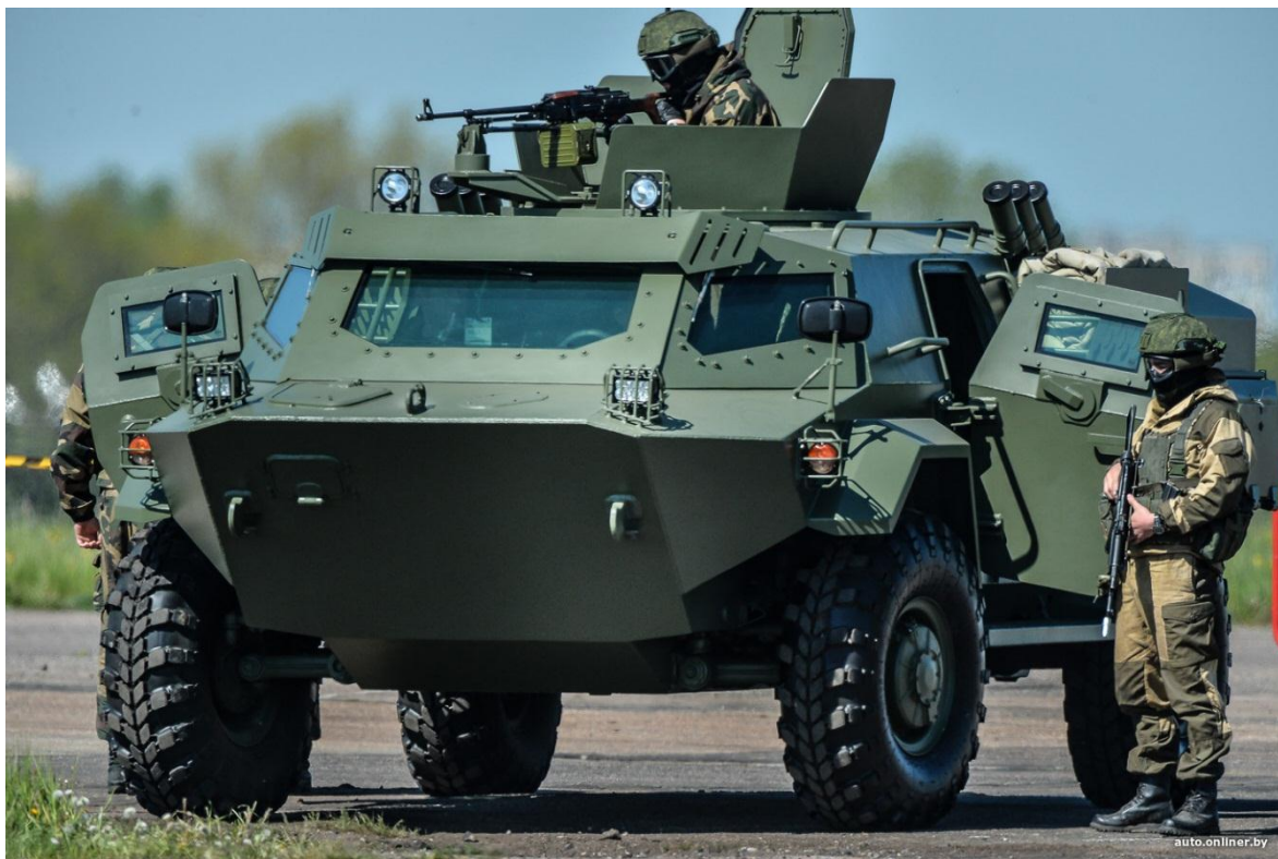
Blindado Caimán, de diseño y fabricación bielorrusa.