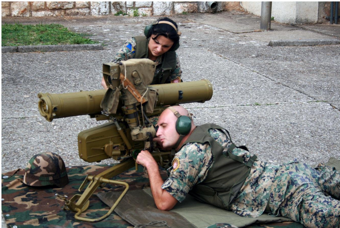
Entrenamiento con lanzamisiles antitanque.

En el siglo VI, el emperador Justiniano había reconquistado el área para el Imperio Bizantino. Los eslavos, provenientes del sudeste de Europa aliados con los Avaros, invadieron el Imperio Romano de Oriente, estableciéndose en lo que hoy es Bosnia y Herzegovina.