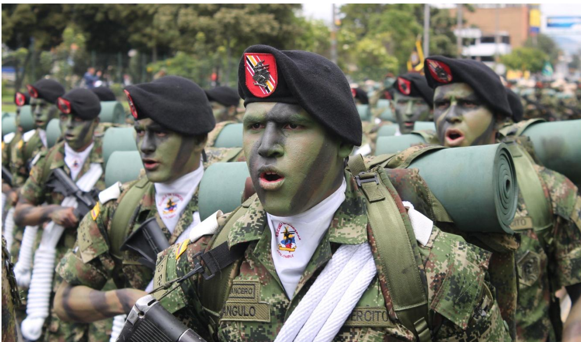
Los lanceros están entre los más aplaudidos en los desfiles militares del día de la independencia nacional

Luego de diez semanas (un estimado de 1.020 horas efectivas), y superadas las fases de Adaptación, en la Escuela de Lanceros; Fundamentación Táctica, en el Centro de Entrenamiento del Lancero; Operaciones en Montaña, en el área del alto del Sumapáz; y Operaciones en Selva, en el Fuerte Amazonas II, cada una con sus complejidades y alto nivel de exigencia, no solo física sino también psicológica, el participante adquiere la capacidad de “planear y conducir misiones de combate irregular en los diferentes ambientes operacionales (llanura, montaña y selva), empleando las técnicas de asalto aéreo, el combate urbano y la supervivencia en el agua; con la finalidad de llevar su unidad al cumplimiento de la misión”.