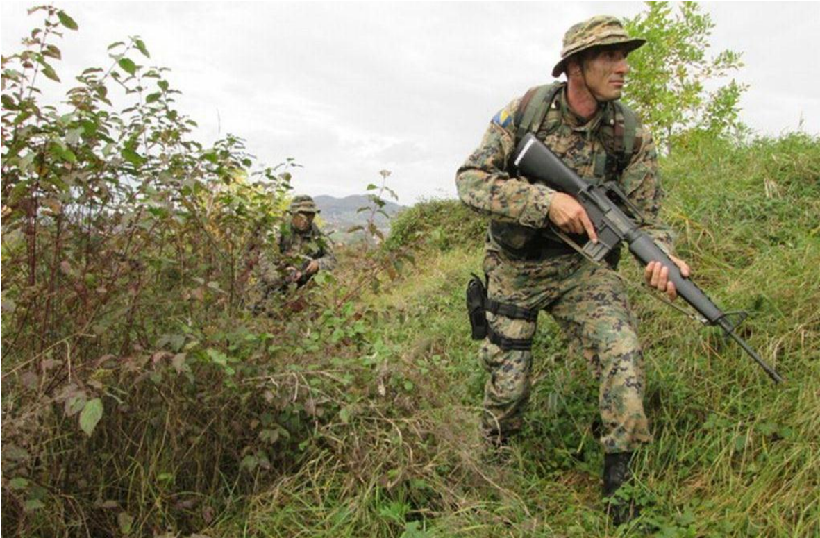
Maniobras de entrenamiento táctico del Ejército de Bosnia y Herzegovina.