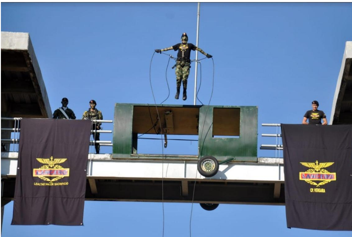
Personal de la Escuela de Lanceros demostrando el llamado "Salto del Ángel" en "Las (torres) Trillizas".

El Curso de Lancero del Ejército Nacional de Colombia es uno de los más exigentes del mundo. En él se capacita a líderes de pequeñas unidades, para el desarrollo de la guerra irregular. Es un verdadero honor y un privilegio portar uno de los distintivos otorgados por la Escuela de Lanceros (ESLAN), institución que recibe los calificativos de "cuna de la mística", "templo de la milicia", y "universidad del combate", reconociendo con ello la importancia de la formación que allí se imparte.