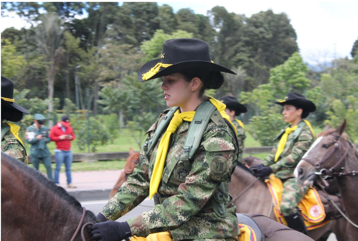
En el año 2016 se activó el primer pelotón montado compuesto solo por mujeres. Se trata de 25 oficiales y suboficiales, que operan en el departamento del Casanare.

Para adelantar en entrenamiento diferencial, propio de los pelotones montados, la Escuela de Unidades Montadas y Equitación despliega el Comité de Entrenamiento Móvil, conformado por un oficial, un suboficial, y un soldado experto en herraje. Este personal se desplaza desde la sede de la ESUME en Bogotá hasta las distintas unidades montadas para ofrecer capacitación en materias como: pelotón montado en operaciones, planeamiento, organización y manejo de pelotón remonta y ganado mular, asiento ecuestre, ejercicio de tiro a caballo, herraje, natación, primeros auxilios, entre otras.