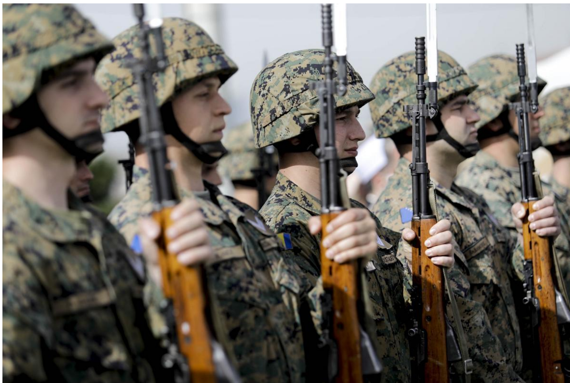
Parada militar del Ejército de Bosnia y Herzegovina.

Finalizada la Primera Guerra Mundial, y con más de un 10% de la población muerta, Bosnia fue incorporada en el estado eslavo del Sur o Reino de los Serbios, croatas y eslovenos (luego rebautizado Yugoslavia). En 1929 se establece el reino de Yugoslavia y divide su territorio en varias regiones administrativas. Yugoslavia es invadida por Alemania el 6 de abril de 1941, el territorio bosnio es cedido al Estado Independiente Croata, aliado de Alemania, en ese momento se inicia la persecución y asesinato de más de 340.000 de serbios y decena de miles de judíos.