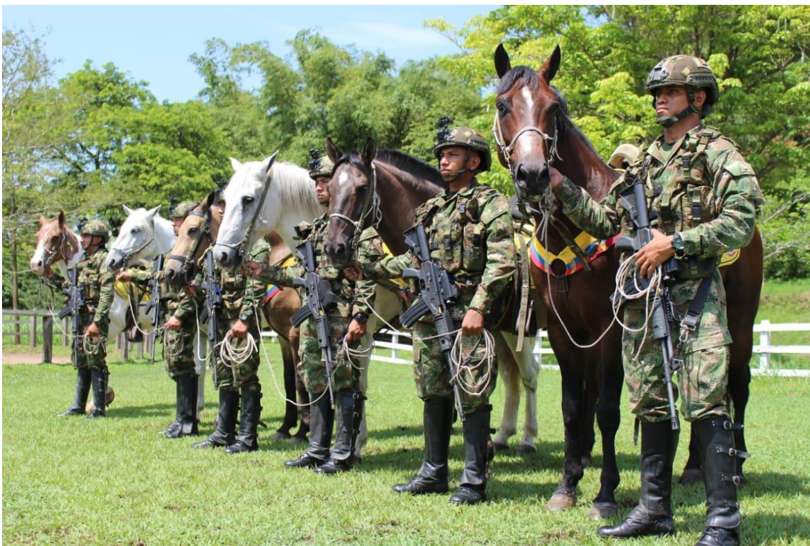
Personal de un pelotón montado del Ejército Nacional de Colombia.

La topografía colombiana presenta importantes obstáculos naturales, incluyendo páramos, desiertos, selvas, montañas, múltiples ríos, quebradas, y zonas anegadizas, que dificultan o impiden el empleo de vehículos. Debido a esta realidad, y a la ausencia de infraestructura vial en amplias zonas del territorio, el Ejército Nacional de Colombia creó pelotones a caballo, que permiten patrullar y hacer presencia efectiva en zonas de difícil acceso, contando con la movilidad que otorgan los equinos, superando con ello las capacidades de las unidades de infantería.