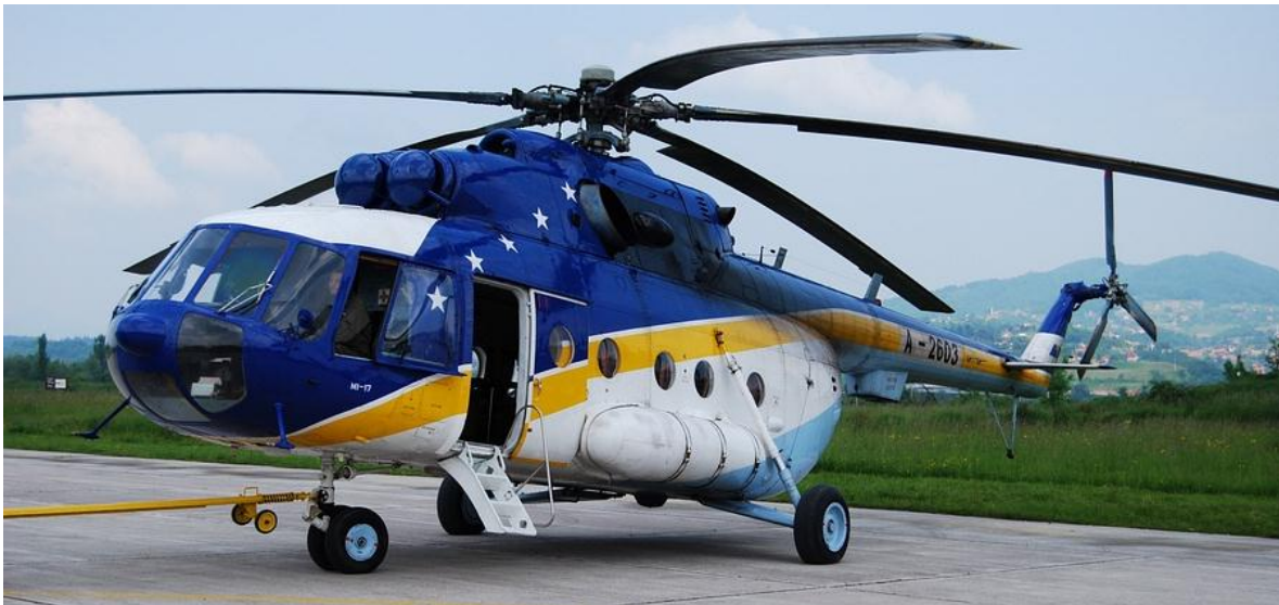
Helicóptero de transporte Mil Mi-8 de la Brigada de Aviación del Ejército de Bosnia y Herzegovina.