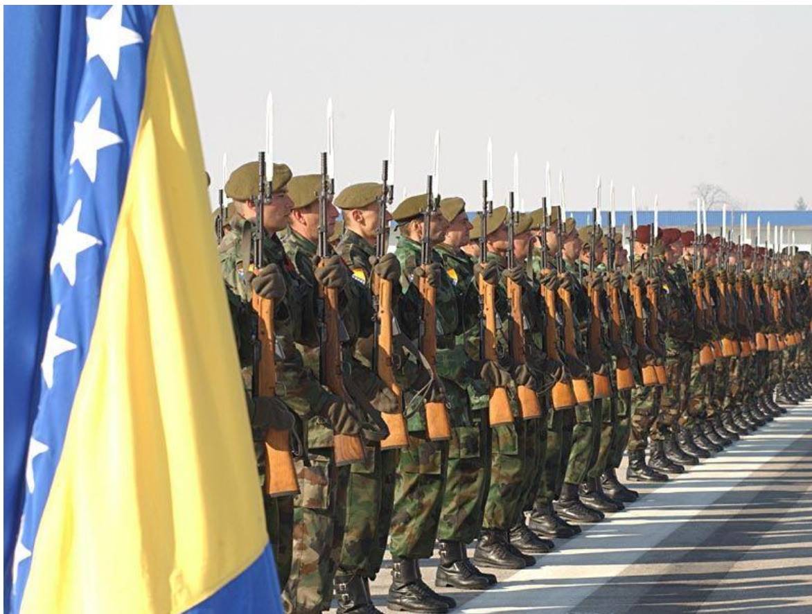
Parada militar del Ejército de Bosnia y Herzegovina.

Herencia de la época comunista son las variadas industrias militares que quedaron en el territorio bosnio y que suplen a las fuerzas. Desde fábricas de armamento ligero y municiones hasta aquellas que producen partes de vehículos de combate o partes de motores de aviación.