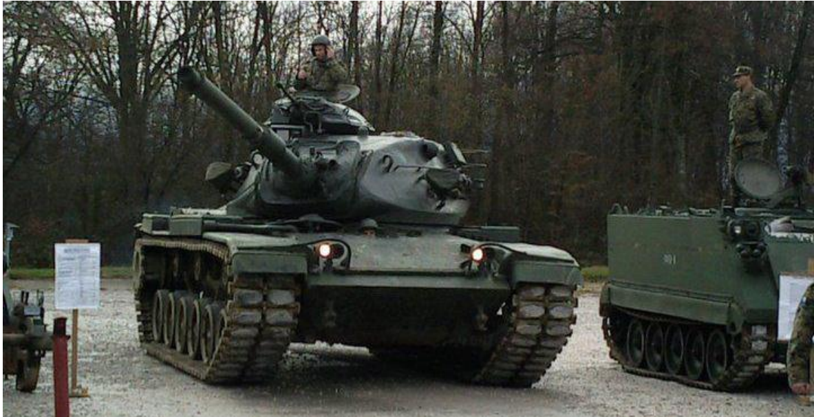
Tanque M-60 A3 del Ejército de Bosnia y Herzegovina.