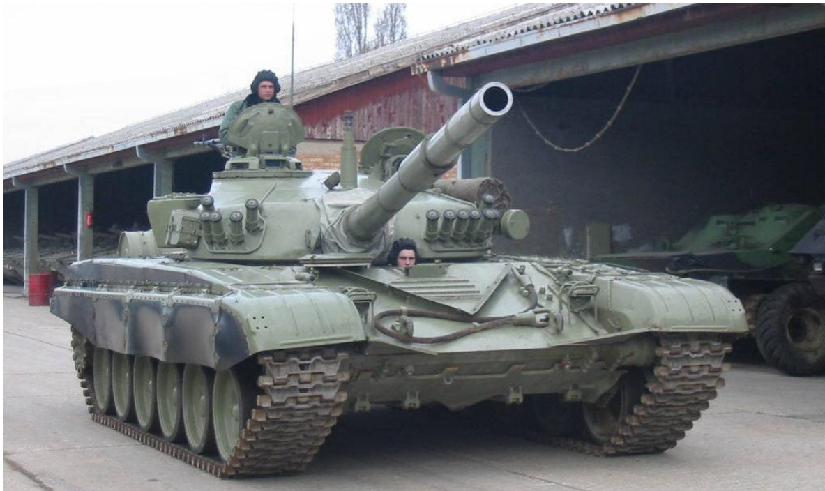
Tanque M-84, desarrollo de la antigua Yugoslavia a partir del T-72 ruso.