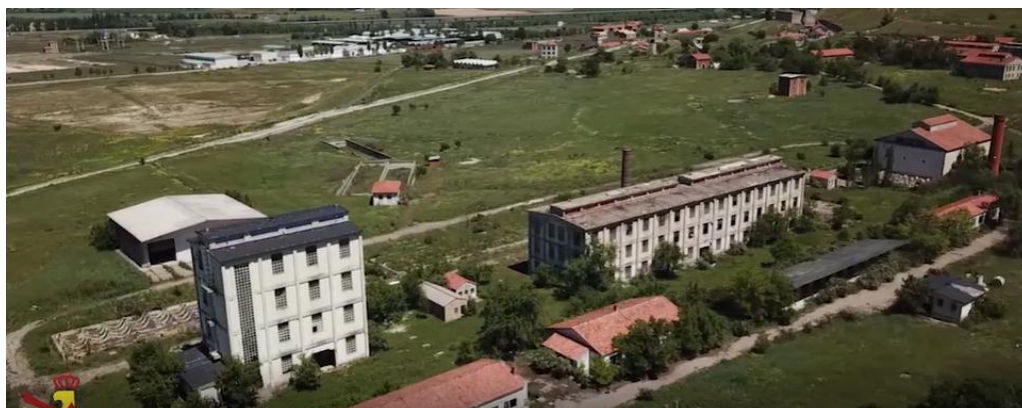
Zona de entrenamiento en combate urbano del ejército español. Valladolid

A título de ejemplo, vayan algunos entornos donde las tropas occidentales realizan sus entrenamientos en combate urbano. ¡Nada más alejado de la realidad!