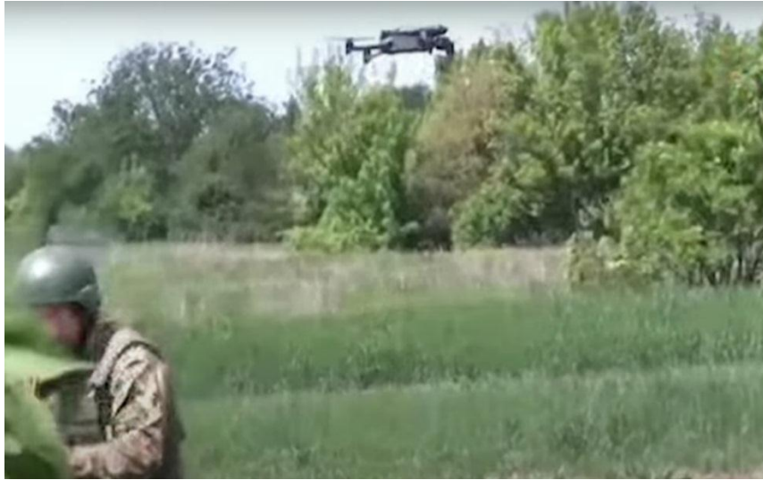
Drone Mavic en despegue para reconocimiento o dirección de tiro artillería

Junto a estas herramientas, como decía, han destacado sobre manera las armas anticarro que han minimizado notablemente el uso de las fuerzas acorazadas, y quizá hasta puesto en duda los sistemas de protección de estas. No solo los famosos blindajes reactivos, sino también los sistemas de última generación Shtora-1 (equipo de interferencia infrarrojo, un sistema de advertencia con cuatro receptores de advertencia de láser, un sistema de lanzamiento de granadas que produce una pantalla de aerosol y un sistema computarizado de control. Wikipedia), lo cual nos permitiría cuestionar la efectividad, por ejemplo, del famoso sistema israelí Trophy. En la guerra, la teoría es una cosa y la práctica otra. El enemigo también piensa.