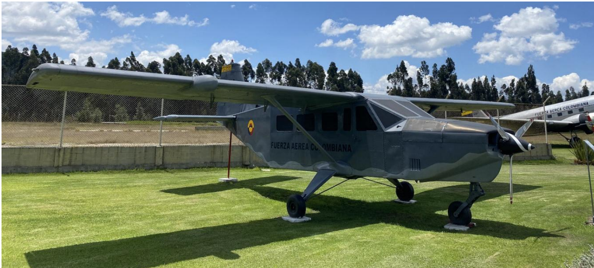
Gavilán 358 FAC 5062 en el Museo Aeroespacial (MAECO) de la Fuerza Aérea Colombiana.

A propósito, este caso podría tener cierto parecido a lo ocurrido en Brasil con el tanque Engesa Osorio, mismo que superaba en mucho a sus rivales en el mercado mundial de armas, pero que no fue adquirido por Arabia Saudí, como cliente de lanzamiento, debido a presiones de los Estados Unidos, que condujeron al país árabe a decantarse por el Abrams, aun sabiendo que el tanque brasilero era mejor, este descalabro llevó a Engesa a la quiebra, y el Osorio nunca pasó de los cuatro prototipos. En el caso del Gavilán, su bajo costo y capacidades le convertían en un serio competidor para el Caravan. No es de extrañar que tuviese tantos problemas para ser certificado por la FAA de los Estados Unidos, donde seguramente la Cessna tiene gran influencia. Al final el proyecto se vendió a una empresa canadiense, que, teniendo la capacidad y los recursos para aprovechar este proyecto al máximo, incursionando en el mercado con una aeronave altamente competitiva, simplemente engavetaron todo, y el gavilán desapareció del mundo de la aviación. Como diría Álvaro Uribe Vélez, ex presidente de Colombia, “ahí, ¿qué supone uno?”