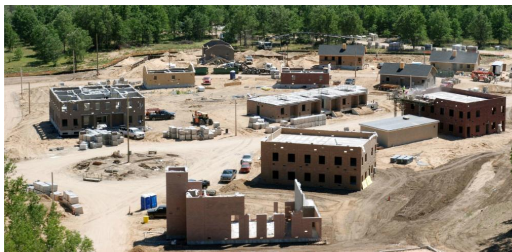
Zona de combate urbano Ejército USA. Camp Grayling, Michigan

En España, de hecho, no hace muchos días un periódico digital ( El confidencial Digital. Militares entrenan por su cuenta el combate urbano y los primeros auxilios (elconfidencialdigital.com) ) sorprendía con este titular: Militares entrenan por su cuenta el combate urbano y los primeros auxilios. Critican que la formación práctica en sus unidades es limitada y está desactualizada. Impartirán cursos en un campo de airsoft en Madrid. Sobre las empresas que van a facilitar este adiestramiento extra, nada que decir no las conozco, pero si están