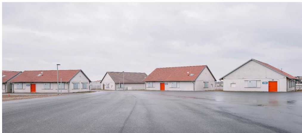
Zona de combate urbano en Alemania (GHOST TOWN - David Altrath). Military training town Schnöggersburg