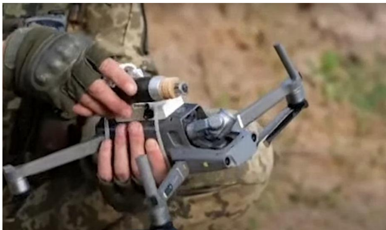
Drone Mavic Pro o Zoom con porta cargas al que se le acopla una pequeña bomba

Debemos ser claros, los medios hablan a menudo de drones turcos (Bayraktar TB2) o iraníes (SHAHED 136) o Switchblade americanos...etc, pero lo que más muestran las redes son drones comerciales; como ocurrió hace más de lustro en Siria; como digo también fui testigo. Y he de precisar que a pesar de que los medios hablan de que se “transforman”, no es del todo cierto. Son drones tipo DJI Mavic a los que se les adapta tras adquirirlo vía Amazon un “porta cargas” y que como se puede ver en los videos que se suben a YouTube, tienen un impacto moral muy elevado. Ya pudimos observarlo también no hace demasiado en la guerra entre Armenia y Arzabayan en Nagorno Karabag.