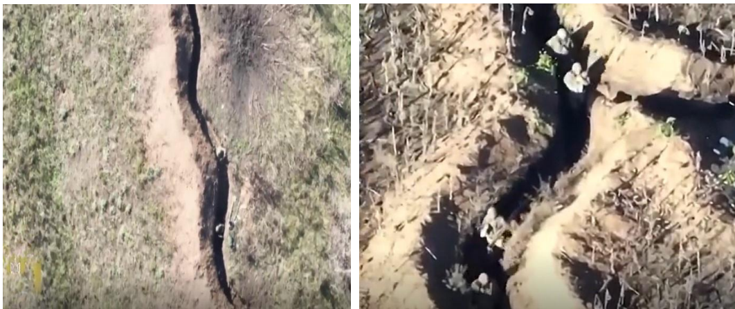
Trincheras en el frente

Si en este enfrentamiento pudiéramos hablar de protagonismo, no cabe duda de que casi el primer lugar lo ocuparían los drones; nada nuevo, ya durante mi estancia en el conflicto sirio se utilizaban con asiduidad en 2013, tanto para tareas de bombardeo como para reconocimiento. Podríamos decir en el caso de la invasión de Ucrania que se les agregó la función de observador para la artillería, aumentando la efectividad de esta de forma exponencial y convirtiéndola en protagonista en una guerra curiosamente bastante convencional y estática (podemos observar que se vuelve a las trincheras). Comparten protagonismo las armas contra carro que han esquilado las fuerzas acorazadas rusas, además de la torpeza de los responsables logísticos y de mantenimiento de estas. Cabría preguntarse dónde está el famoso T-14 “armata”.