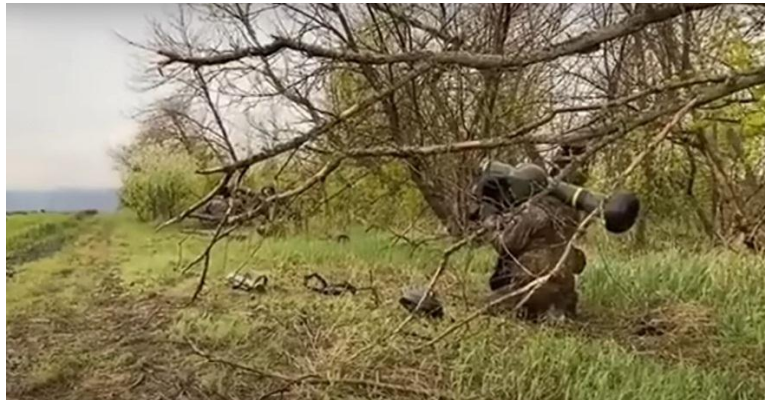
No debemos dejar de lado el efecto moral que esto produce en las tripulaciones

Junto a estas herramientas, como decía, han destacado sobre manera las armas anticarro que han minimizado notablemente el uso de las fuerzas acorazadas, y quizá hasta puesto en duda los sistemas de protección de estas. No solo los famosos blindajes reactivos, sino también los sistemas de última generación Shtora-1 (equipo de interferencia infrarrojo, un sistema de advertencia con cuatro receptores de advertencia de láser, un sistema de lanzamiento de granadas que produce una pantalla de aerosol y un sistema computarizado de control. Wikipedia), lo cual nos permitiría cuestionar la efectividad, por ejemplo, del famoso sistema israelí Trophy. En la guerra, la teoría es una cosa y la práctica otra. El enemigo también piensa.