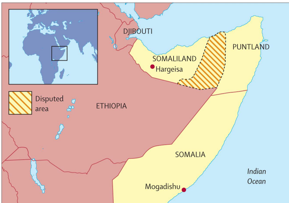
El mapa destaca la ubicación de Somalia en el cuerno de África, así como las regiones separatistas en el norte de ese país.

En Somalia, el año comenzó con nuevos focos de violencia. Tras el estallido de una disputa por la posesión de la ciudad de Laascaanood, que dejó al menos treinta muertos, entre Somalilandia y Puntlandia, dos pseudo estados escindidos de Somalia en 1991, sin ningún reconocimiento internacional ni de Naciones Unidas. Esta disputa agrega un tono más oscuro a la ya trágica historia somalí, que no deja de sorprender al mundo, cada vez con más muerte, cada vez con más violencia.