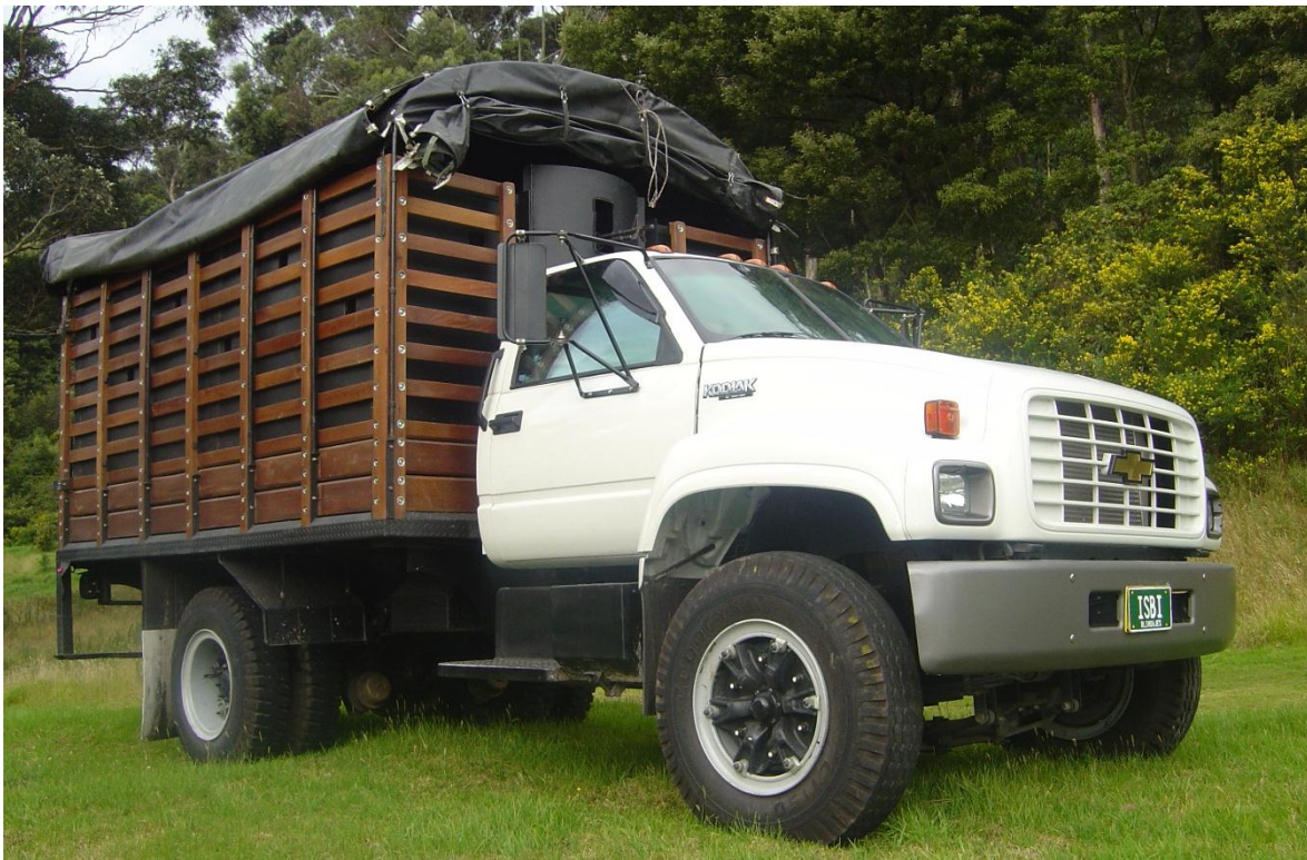
Camión de línea civil, con habitáculo blindado y torreta de ametralladora mimetizados bajo la lona. La cabina también es blindada, (ISBI). Vehículo pensado para acercarse a los retenes ilegales, y emboscar a los criminales.

En Colombia, el Ejército Nacional posee camiones tácticos de línea militar, como, por ejemplo, los REO, los Abir, los Engesa, y los HMMWV, en diferentes versiones. Estos camiones cumplen funciones específicas en unidades tácticas con responsabilidades ante una hipotética guerra regular, contra un enemigo convencional. Entre otras funciones, podemos mencionar que los REO están asignados al remolque de piezas de artillería, los Abir montan los misiles de largo alcance Nimrod, y los Fusiles Sin Retroceso de 106 mm., los Engesa hacen parte del tren logístico de la caballería, y están configurados como carro-taller o como transporte/dispensador de aceites, grasas y lubricantes, en tanto que los HMMWV portan sistemas misilísticos de distinto tipo y otras armas de apoyo.