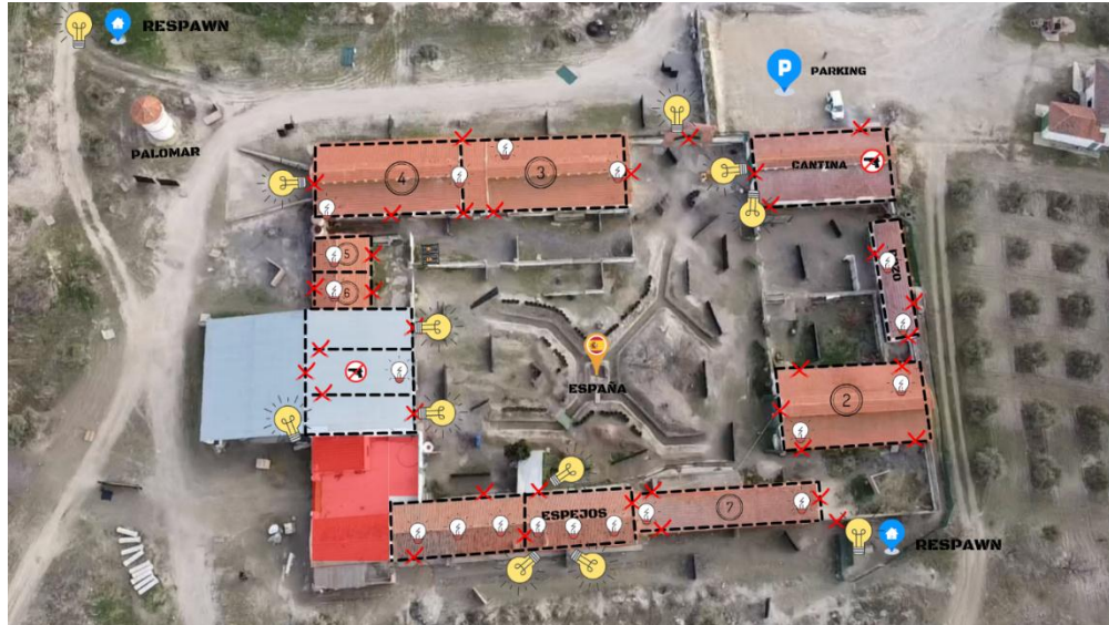
Foto tomada de la página web del campo de airsoft

compuestas por antiguos militares, algunos incluso de fuerzas especiales, pero si curioseamos en entorno donde van a realizar este aprendizaje, nos encontramos con lo mismo que en los llamados “campos oficiales de entrenamiento”. Véase foto.