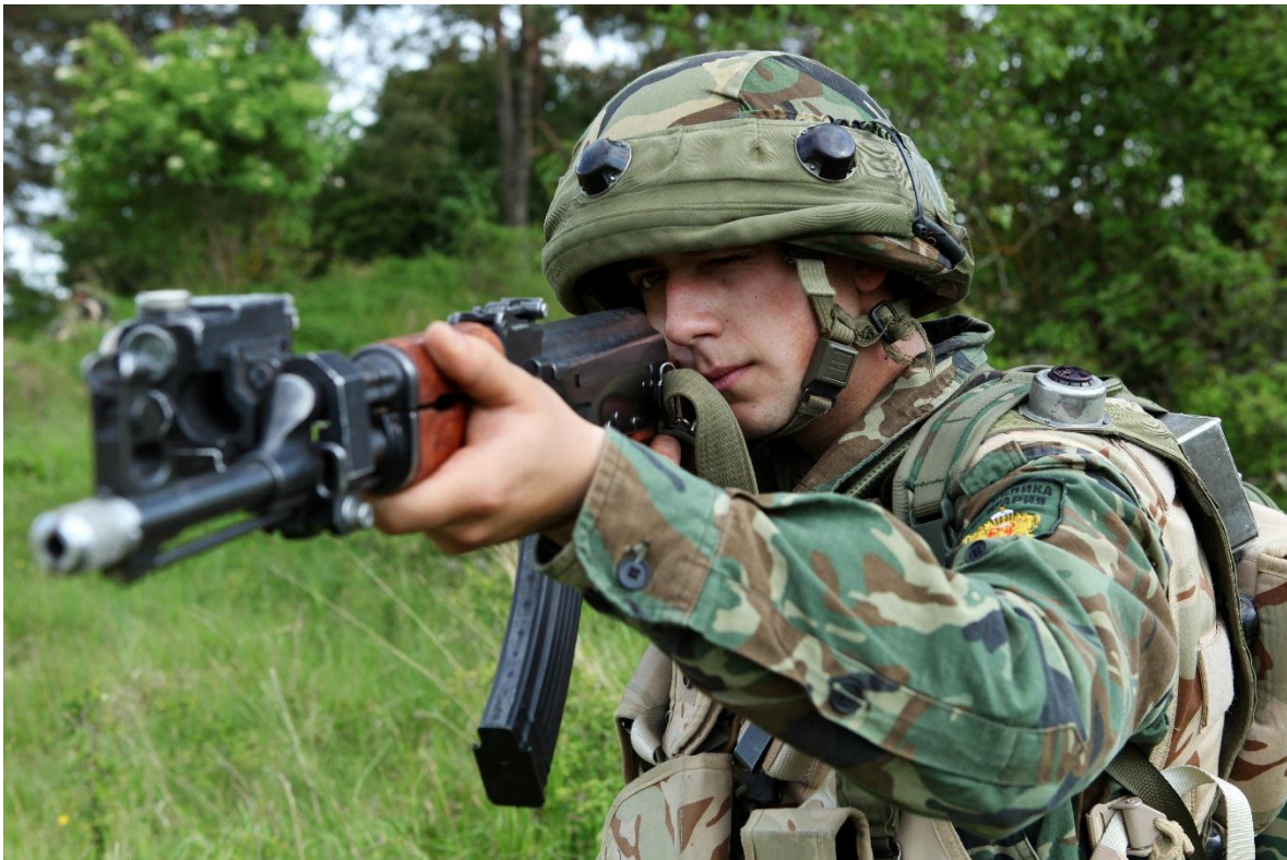
Tropas del Ejército Búlgaro en entrenamiento. Se observa que el soldado lleva lo que parece ser el equipo MILES (Multiple integrated laser engagement system).