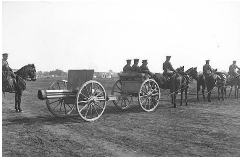
Tropas Búlgaras con cañón Schneider 75mm en la Primera Guerra Mundial.

Durante el período de entreguerras, al ejército búlgaro no se le permitió tener aviones de combate o buques de guerra activos, y el ejército se redujo a unos veinte mil hombres en tiempos de paz. A principios de la década de 1920, oficiales del ejército participaron en represiones durante el régimen de Tsankov como parte de grupos