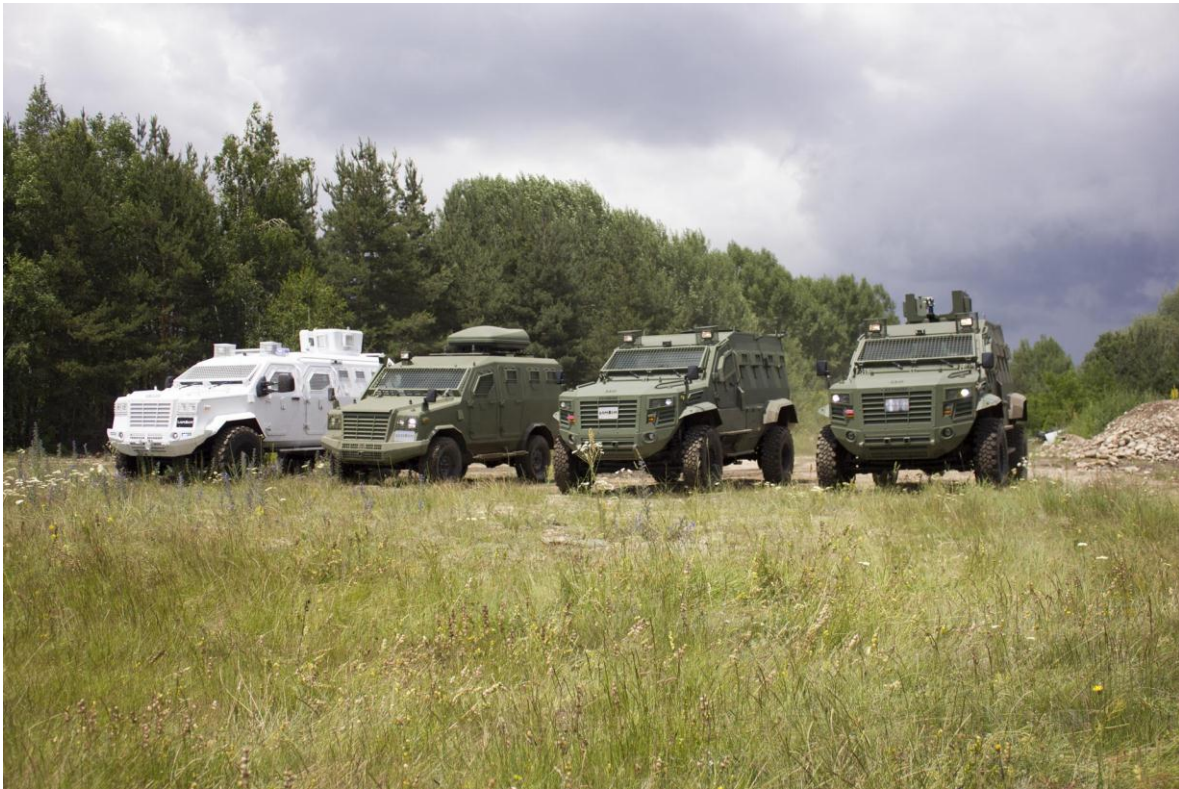
Blindados de fabricación nacional.

Después del colapso del pacto de Varsovia, Bulgaria perdió la capacidad de adquirir combustible y repuestos baratos para su ejército. Una gran parte de sus casi 2.000 T-55 se deterioraron y, finalmente, casi todos fueron desechados o vendidos a otros países. A principios de la década de 1990, el presupuesto era tan pequeño que los proveedores habituales solo recibían pagos simbólicos. Muchos oficiales educados y bien entrenados perdieron la oportunidad de educar a los soldados más jóvenes, ya que el equipo y la base necesarios carecían de la financiación adecuada. El gasto militar aumentó gradualmente, especialmente en los últimos años. A partir de 2005, el presupuesto no superó los $400 millones, mientras que el gasto militar para 2009 ascendió a más de $1.300 millones – casi un triple aumento durante 4 años. A pesar de este crecimiento, el ejército todavía no recibe fondos suficientes para la modernización. Un ejemplo de malos planes de gastos es la compra a gran escala de aviones de transporte, mientras que la Fuerza Aérea tiene una gran necesidad de nuevos cazas (los MiG-29, aunque modernizados, se acercan a sus límites operativos). Se canceló la adquisición planificada de 2 a 4 corbetas de la clase Gowind. A partir de 2009, el gasto militar fue de alrededor del 1,98% del PIB. En 2010 el presupuesto será sólo del 1,3% debido a la crisis financiera internacional.