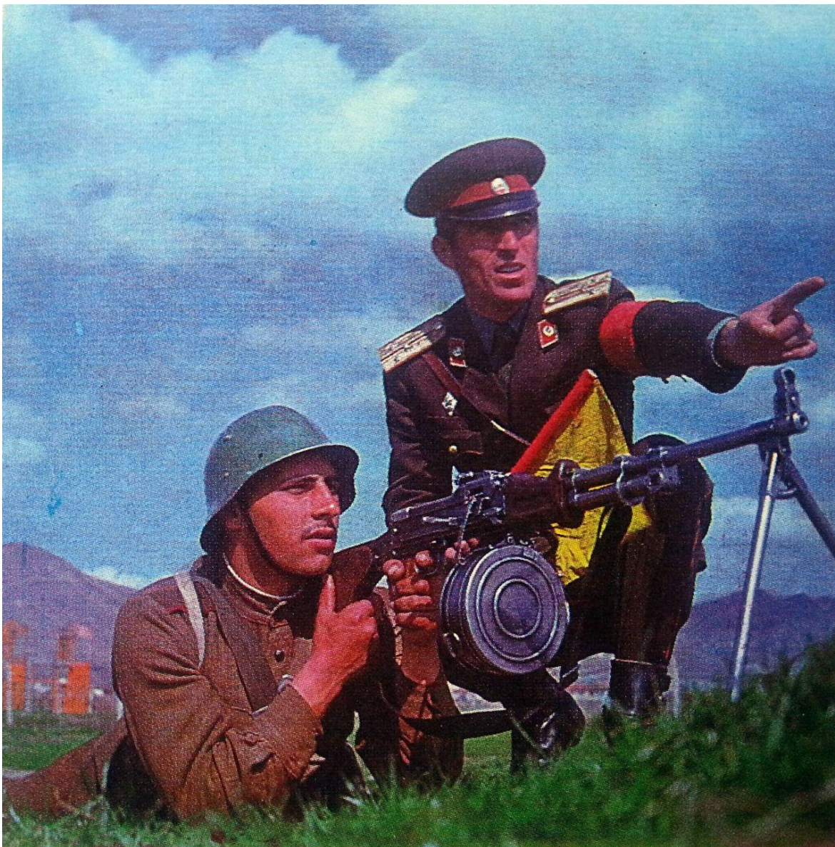
Entrenamiento de tropas del Ejército del Pueblo Búlgaro.

A finales de 1955, las Fuerzas Terrestres de Bulgaria tenían una estructura en tiempos de paz de dos ejércitos y dos cuerpos de fusileros independientes, compuestos por un total de 9 divisiones de fusileros y otras 14 formaciones. La 16. a Brigada de Fusileros de Montaña se había establecido en 1950 con su cuartel general en Zvezdets, y se le asignó el antiguo número de la 16. a División de Infantería. Además de eso, en caso de guerra se movilizarían cinco divisiones de fusileros adicionales y otras 9 formaciones de las diferentes armas. Con la adhesión de Bulgaria al Pacto de Varsovia el 14 de mayo de 1955 se inició una nueva etapa. Las Fuerzas Terrestres operaban 800 tanques y tenían un formidable cuerpo de artillería.