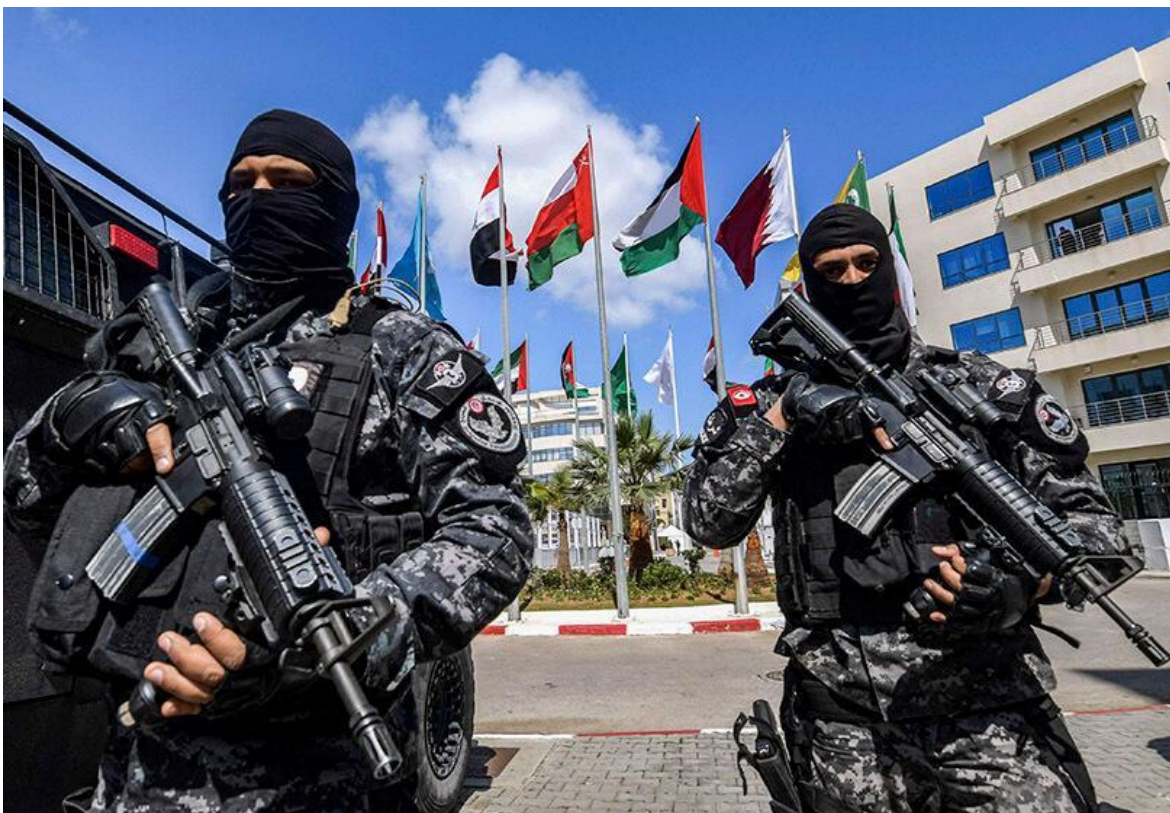
Todos los países del mundo han creado fuerzas especiales antiterroristas, y la legislación castiga fuertemente este delito.

La experiencia adquirida durante los “Grandes Eventos” en Brasil, por ejemplo, los Juegos Panamericanos de 2007, los Juegos Mundiales Militares de 2011, la Jornada Mundial de la Juventud de 2013 y los Juegos Olímpicos de 2016 realizados en Río de Janeiro, quedó en el olvido después de ese período, no permitiendo la continuidad de la integración de las agencias ABIN - Agencia Brasileña de Información, las FFAA - Fuerzas Armadas y Fuerzas Policiales, involucradas en la lucha contra el terrorismo.