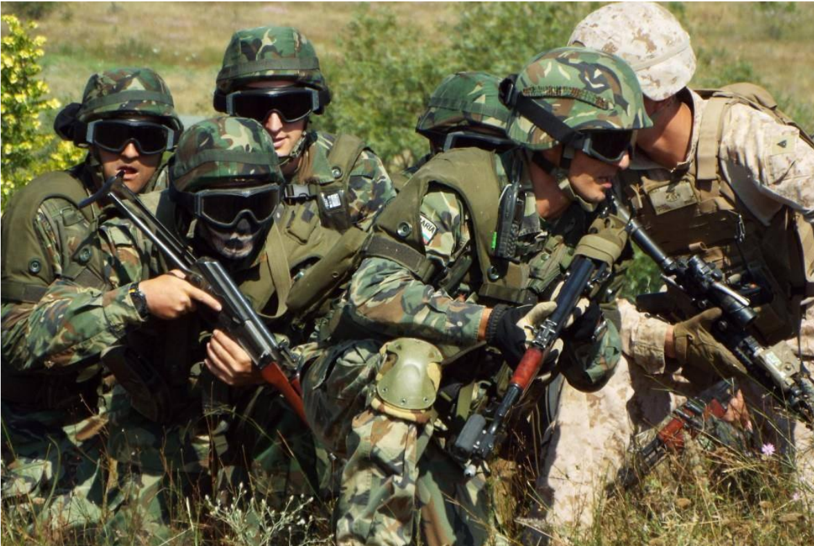
Entrenamiento conjunto con tropas de los Estados Unidos de América.

La revista Foreign Policy enumera la base aérea de Bezmer como una de las seis instalaciones en el extranjero más importantes utilizadas por la USAF.