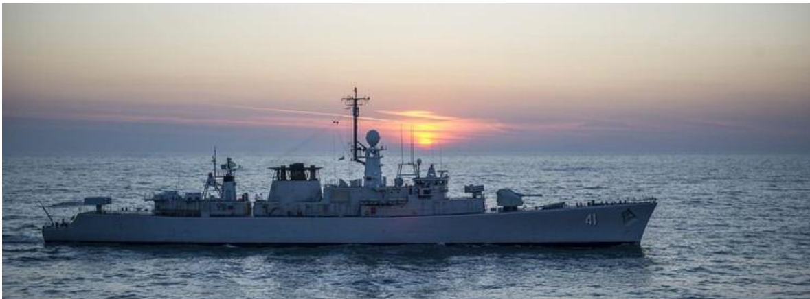
Fragata de la Marina Búlgara.