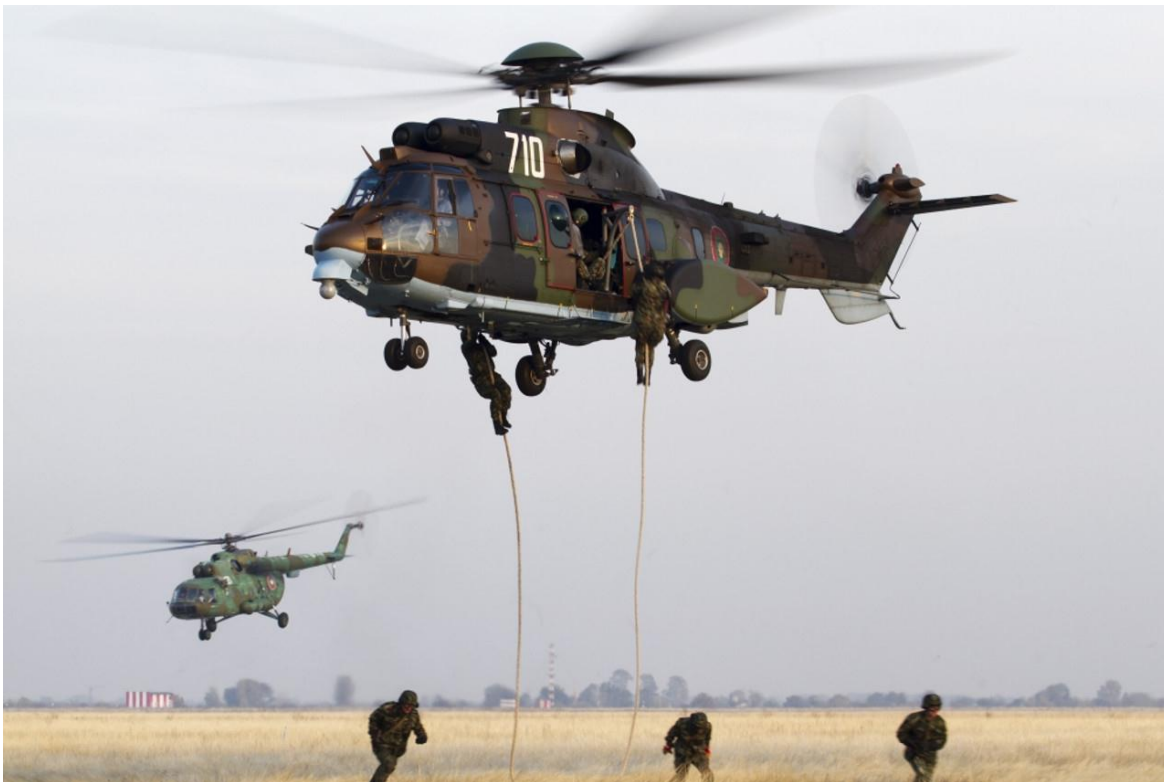
Despliegue helicóptico del Ejército de Bulgaria.