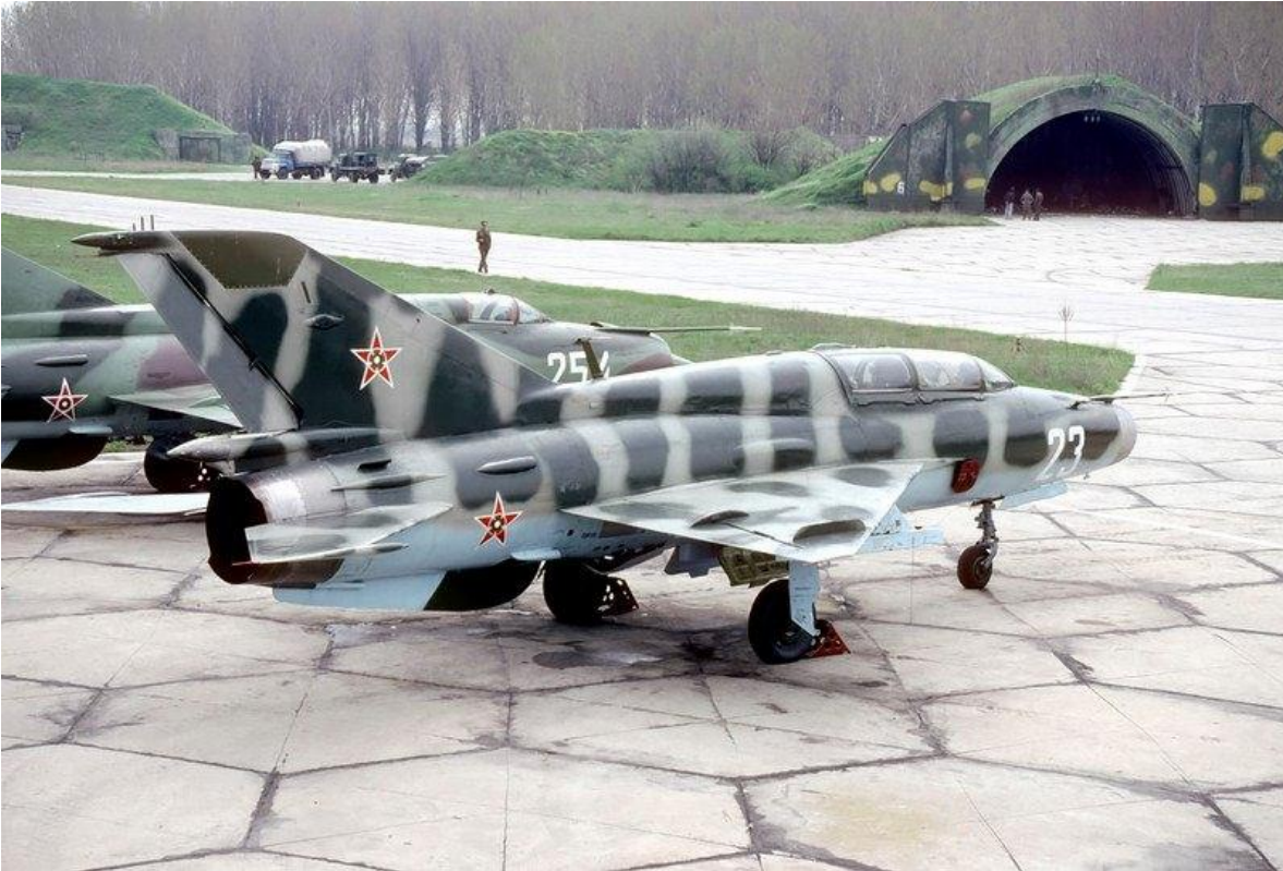
Aviones Mig-21U del Ejército del Pueblo Búlgaro.

Las tres brigadas de artillería de cohetes incluían 3 divisiones de artillería de cohetes, con lanzacohetes múltiples BM-21 Grad de 18x 122 mm; una División de Artillería de Cohetes, con lanzacohetes múltiples RM-51 de 130 mm; y unidades logísticas, de mantenimiento, de defensa química, médicas, de seguridad y de señalización.