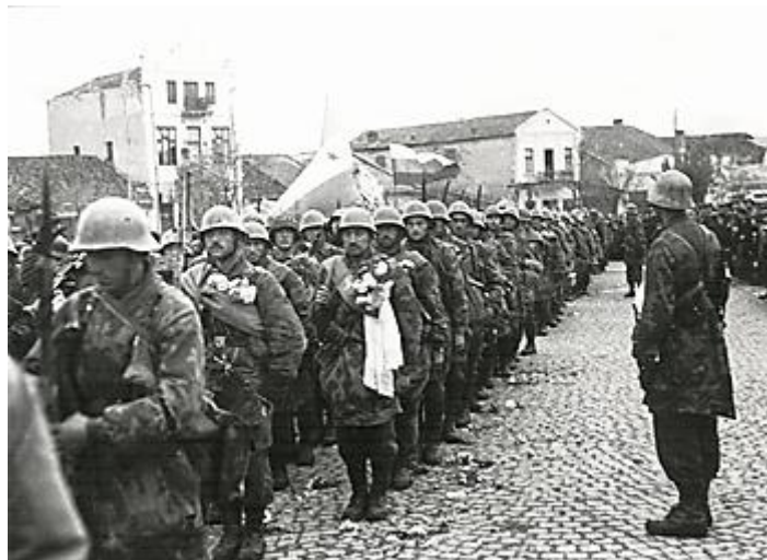
Paracaidistas Búlgaros en Macedonia en 1944.

Durante la Segunda Guerra Mundial, las tropas búlgaras no participaron ni en las invasiones de Yugoslavia ni en Grecia, pero ocuparon partes del norte de Grecia y Macedonia yugoslava después de que Alemania las conquistara. El ejército fue la principal herramienta para imponer una política de reubicación y expulsión de la población griega local en las áreas ocupadas. A finales de 1941, más de cien mil griegos habían sido expulsados de la zona de ocupación búlgara. El aumento de los ataques de los partisanos en los últimos años de la ocupación resultó en una serie de ejecuciones y matanzas masivas de civiles como represalia. En septiembre de 1944, un golpe de Estado de izquierda respaldado por el Ejército Rojo derrocó al gobierno pro-alemán e instaló un gobierno del Frente de la Patria. Todas las tropas búlgaras activas se incorporaron al 3er frente ucraniano soviético y comenzaron a luchar contra sus antiguos aliados alemanes. El 1er ejército búlgaro participó en la campaña yugoslava. Durante la Operación Frühlingserwachen, envió 101.000 hombres. A finales de marzo de 1945, el 1er Ejército dirigió la Ofensiva Nagykanizsa-Körmend. Después de derrotar a las unidades alemanas, los búlgaros llegaron a los Alpes austríacos y el 13 de mayo se encontraron con el 8º ejército británico cerca de Klagenfurt. La ofensiva de Viena fue una de las operaciones finales con participación búlgara durante la Segunda Guerra Mundial.