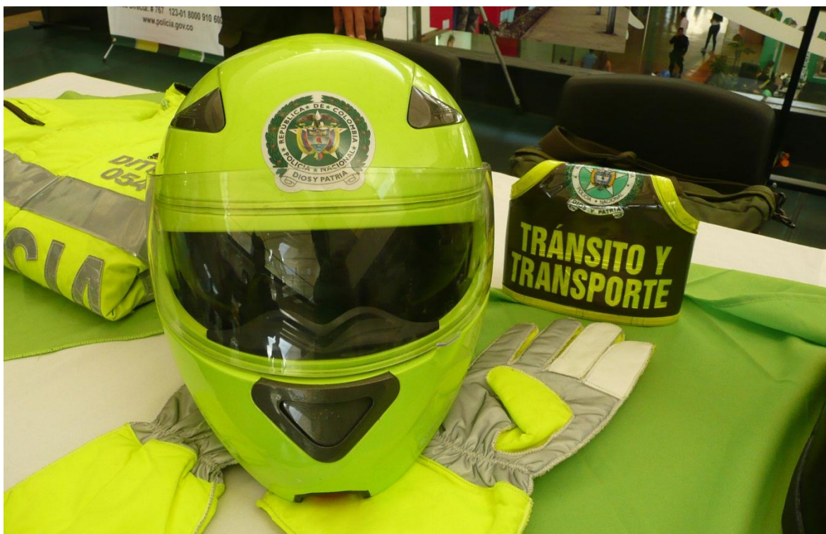
Dotación de intendencia de la especialidad de tránsito y transporte de la Policía Nacional de Colombia.

Quisiera que no fuese así, pero es un hecho que el tema de la corrupción permea al personal de la Policía Nacional de Colombia, mismo que se ve envuelto en sucesivos escándalos, que tienen relación con las más disimiles circunstancias, y que en su conjunto enlodan el buen nombre y el prestigio de una institución que debería ser ejemplo de transparencia y cumplimiento estricto de la ley.