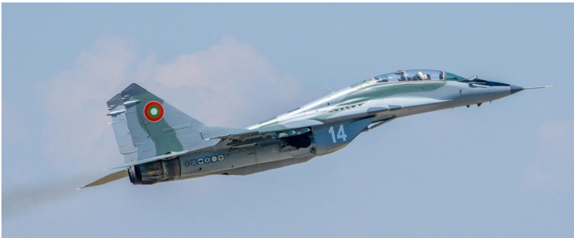
Mig 29 de la Fuerza Aérea de Bulgaria.

En la última década, Bulgaria ha estado tratando activamente de reestructurar su ejército en su conjunto y se ha puesto mucha atención en mantener operativos los viejos aviones rusos. Actualmente, las ramas de ataque y defensa de la fuerza aérea búlgara son principalmente MiG-29 y Su-25. Se han modernizado unos 15 cazas MiG-29 para cumplir con los estándares de la OTAN. El primer avión llegó el 29 de noviembre de 2007 y la entrega final estaba prevista para el 09/03. En 2006, el gobierno búlgaro firmó un contrato con Alenia Aeronautica para la entrega de cinco aviones de transporte C-27J Spartan para reemplazar los An-24 y An-26 de fabricación soviética, aunque el contrato se cambió más tarde a solo tres aviones. En 2005 se compraron modernos helicópteros de transporte fabricados en la UE y se han entregado un total de 12 Eurocopter Cougar (ocho de transporte y cuatro CSAR). Tres Eurocopter AS565 Panther para la Armada búlgara en 2016.