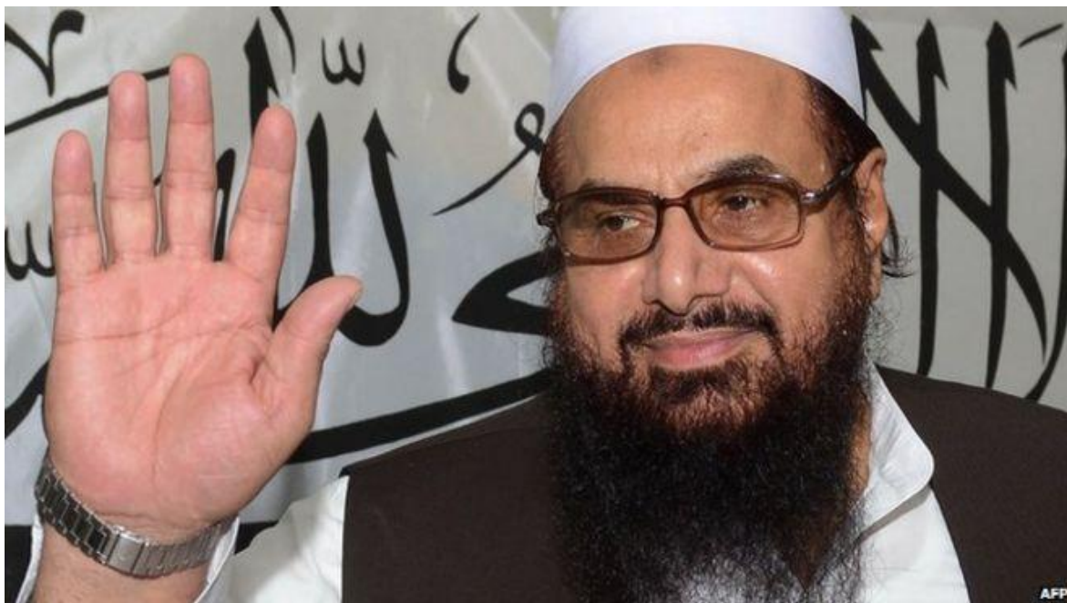
Muhammad Hafiz Saeed

En las primeras horas de la mañana del lunes treinta de enero, se conoció, un nuevo atentado en Pakistán, el que se produjo en una mezquita sunita, ubicada dentro del cuartel general de la policía de la ciudad de Peshawar, en el noroeste del país, a unos 190 kilómetros de Islamabad, la capital de Pakistán, y apenas a doce de la frontera con Afganistán. La operación produjo cerca de cincuenta muertos y más de ciento cincuenta heridos, entre ellos muchos policías, que se encontraban en oficinas cercanas. Se estima que al momento de la explosión la dotación de esa fuerza era de cuatrocientos hombres.