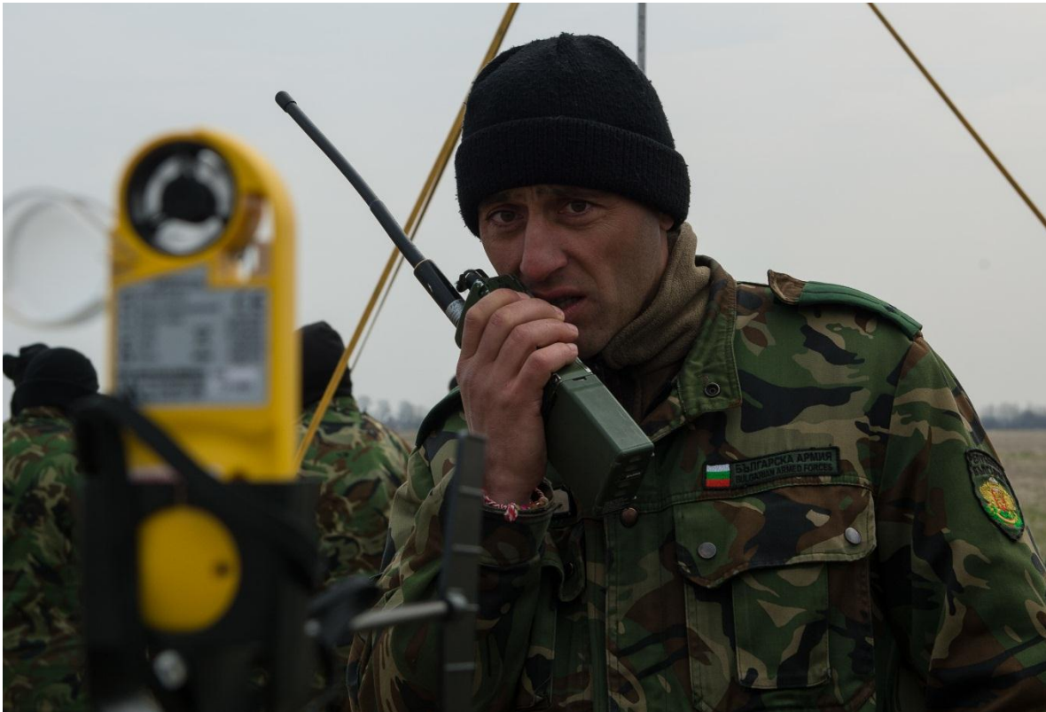
Tropas del Ejército Búlgaro en Maniobras.

La 62ª Brigada de Señales anterior en Gorna Malina era responsable de mantener las líneas de comunicación militares superiores. Junto a las funciones del Regimiento de Señales en el suburbio de Suhodol en Sofía, la brigada tenía al menos tres regimientos de señales dispersos para comunicaciones gubernamentales, como el 75º Regimiento de Señales (Lovech), el 65º Regimiento de Señales (Nova Zagora) y al menos uno Regimiento de señales desconocido adicional en el macizo montañoso Rila - Pirin. El sucesor moderno de la 62 Brigada de Señales es el Sistema de Información y Comunicación Estacionario (Стационарна Комуникационна Информационна Система (СКИС)) del Estado Mayor de la Defensa (que cumple también las tareas de SIGINT y Ciberdefensa junto a su misión estratégica de comunicaciones) y el Sistema de Información y Comunicación Móvil (Мобилна Комуникационна Информационна Система (МКИС)) del Mando de Fuerzas Conjuntas.