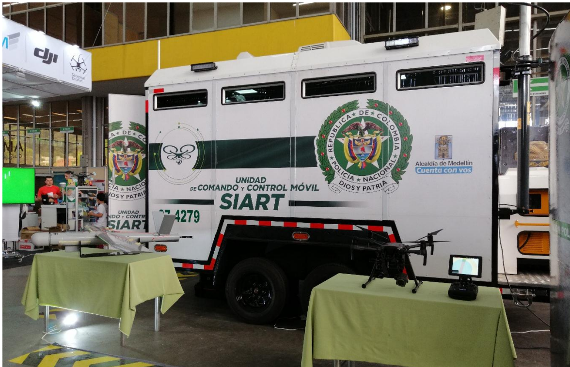
Shelter de control de Sistemas Aéreos Remotamente Tripulados de la Policía Nacional de Colombia.

El 13 de diciembre de 2018, los medios de comunicación reportaron que la Policía Nacional de Colombia se fortalecía con la incorporación de nuevas tecnologías para la lucha contra el narcotráfico. Concretamente, la Dirección Antinarcóticos recibió del Gobierno de los Estados Unidos, Sistemas Aéreos Remotamente Tripulados, SIART por sus siglas, y un Sistema Integrado de Comunicaciones. Todo lo cual permite la interacción de imágenes y su integración con datos, en las áreas de operaciones, todo a través de un software diseñado para este propósito.