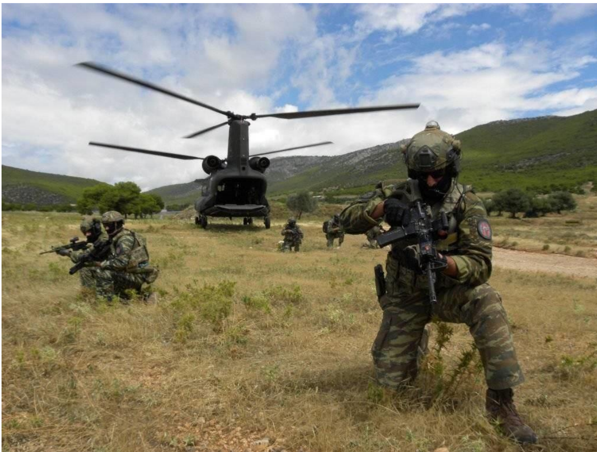
Entrenamiento multinacional de las tropas del Ejército Búlgaro.

En 2001, la unidad de la Guardia Nacional fue designada unidad militar oficial del ejército búlgaro y uno de los símbolos de la autoridad estatal, junto con la bandera, el escudo de armas y el himno nacional. Es una formación directamente subordinada al Ministro de Defensa, y, aunque legalmente forma parte de las fuerzas armadas, es totalmente independiente del Estado Mayor de la Defensa.