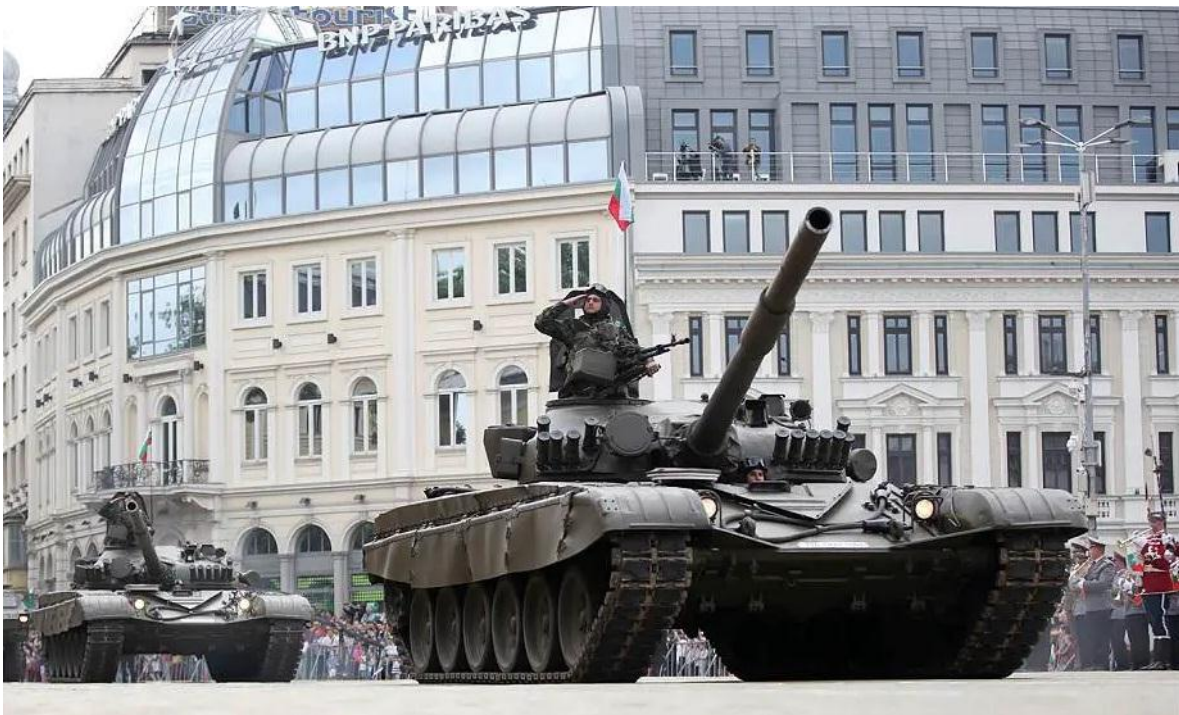
Tanques T-72 del Ejército Búlgaro, en reciente desfile militar en la capital de ese país.

En tiempos de crisis, las tareas principales de las Fuerzas Terrestres se relacionan con la participación en operaciones contra las actividades terroristas y la defensa de instalaciones estratégicas (como plantas de energía nuclear y grandes instalaciones industriales), ayudando a las fuerzas de seguridad a prevenir la proliferación de armas de destrucción masiva, tráfico ilegal de armas, y combate del terrorismo internacional. En caso de conflicto de baja y mediana intensidad, las Fuerzas Activas que integran las Fuerzas Terrestres participan en la realización de las tareas iniciales para la defensa de la integridad territorial y soberanía del país. En caso de conflicto militar de alta intensidad, las Fuerzas Terrestres, junto con la Fuerza Aérea y la Armada, tienen por objeto contrarrestar las agresiones y proteger la integridad territorial y la soberanía del país.