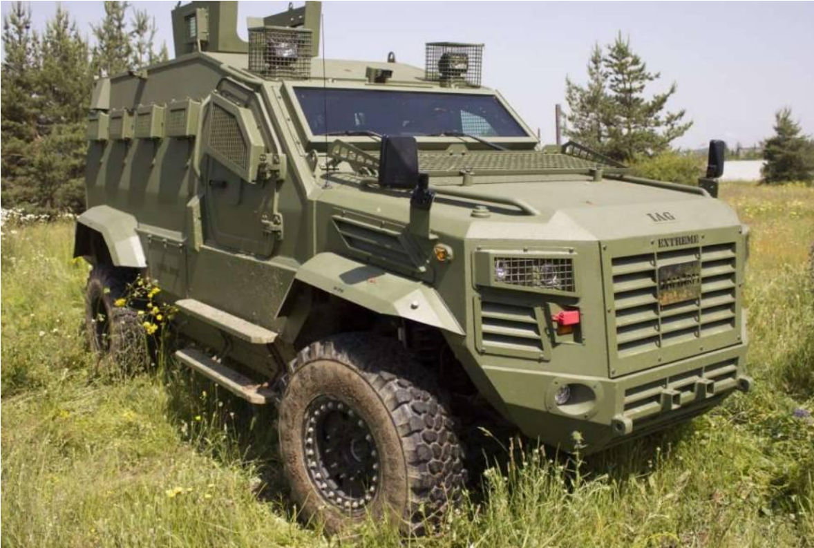
Vehículo Blindado de fabricación nacional.