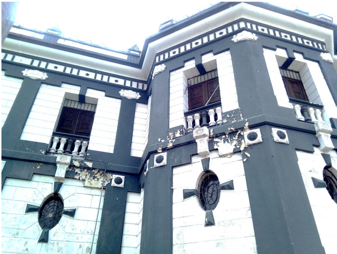
Fachada de la Academia Técnica Militar Bolivariana, Maracay, Estado Aragua.

Los medios nos dicen que Maduro se aferra al poder, con el apoyo de los militares, a los que tiene “comprados” con constantes y abundantes dádivas. Se asegura que el gobierno de Venezuela otorga privilegios al sector militar, para mantener su simpatía y apoyo. Yo no lo sé. No tengo conocimiento de tales maniobras, que ciertamente son muy probables en el contexto latinoamericano, donde los militares tienen un gran peso en la política, y tienen experiencia tumbando gobiernos democráticos.