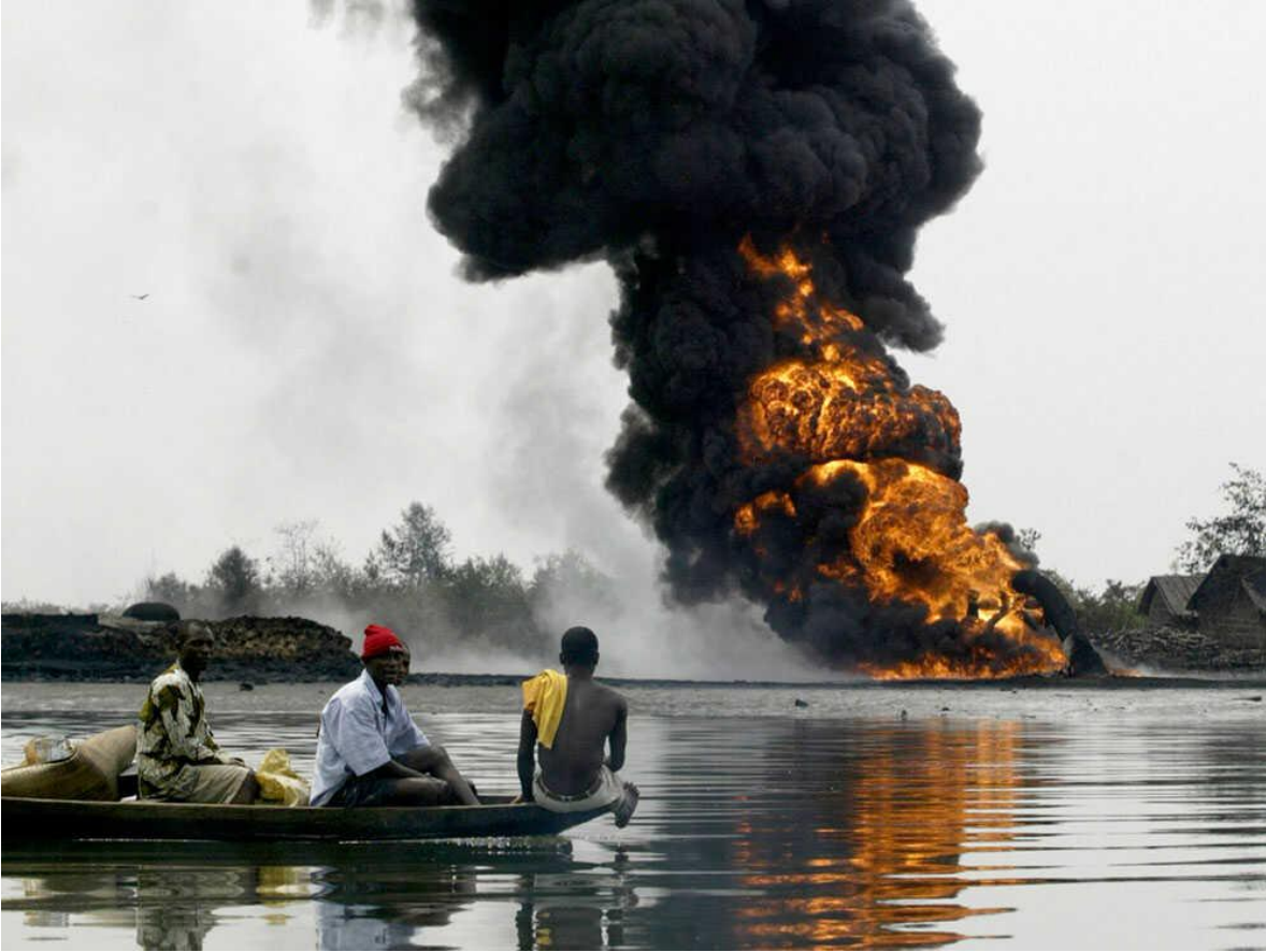
Las Fuerzas Armadas del gobierno, y dos grupos terroristas, enfrentados entre sí y atropellando a la población civil, en un todos contra todos que convierte la situación en un peligroso caos.