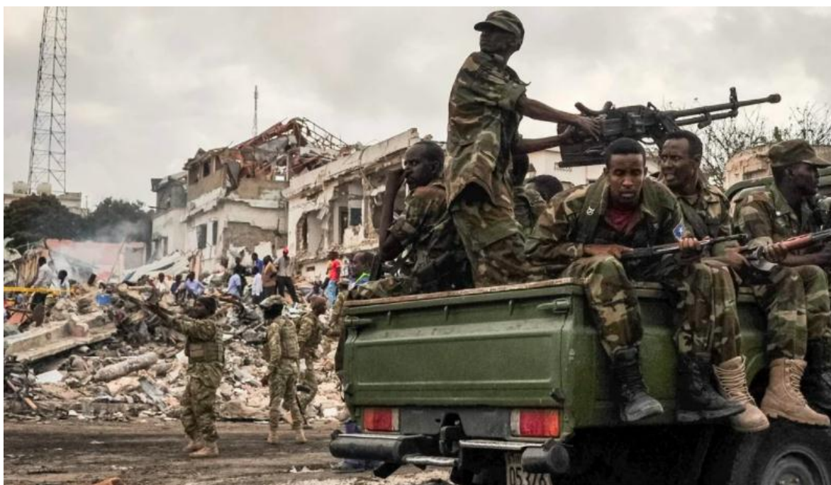
Somalia, el epítome del Estado fallido.

Tras el ataque explosivo, reivindicado por la organización terrorista al-Shabbab , al restaurante del hotel Pearl Beach , en la playa de Lido, uno de los más lujosos de Mogadishu, la capital de Somalia, resultaron muertas nueve personas: seis civiles y tres militares, además de que otras veinte fueron heridas.