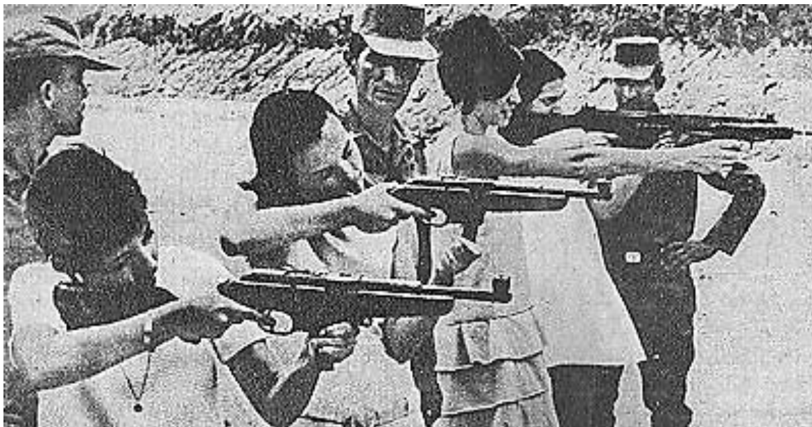
Guerrilleros brasileiros en instrucción de tiro. 1970

Dos años después del inicio del régimen militar en Brasil, grupos armados de izquierda iniciaron una articulación que puso al país en estado de guerra civil no declarada. Entre 1966 y 1974, la izquierda armada robó 3,8 millones de dólares, cantidad que convirtió a la guerrilla brasileña en la más rica del mundo en ese momento.