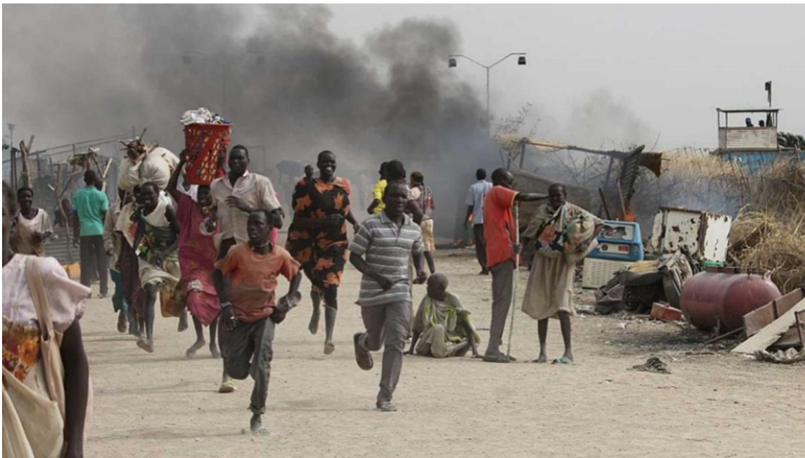
Los civiles, las víctimas inocentes del conflicto.

Con reproches cruzados, se han ahora solo se han llevado protección, armando campamentos interrumpido el pasado miércoles negociaciones acerca de un alto el 31, al menos temporariamente, las fuego, siempre momentáneo, para cinco kilómetros de la frontera con negociaciones que se llevaban en la establecer cordones sanitarios y de Sudán. Esta última oleada se suma ciudad saudita de Jeddah, entre las seguridad, por donde pueda correr a los más de 900 mil refugiados partes beligerantes que, desde el la asistencia a los civiles atrapados sudaneses que había en el Chad, quince de abril, libran la guerra civil en el conflicto y nada se discute uno de los cinco países más pobres del mundo, desde antes del inicio en Sudán: Las Fuerzas Armadas de Sudán (FAS), el ejército regular al solución política de la crisis.