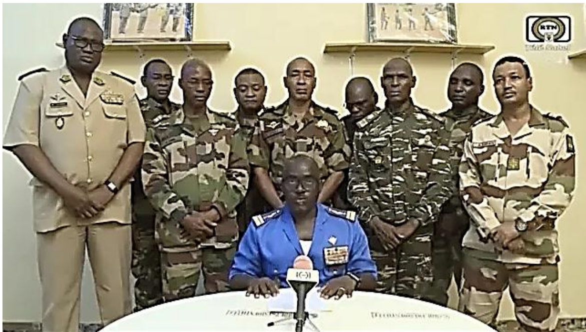
Coronel Mayor Amadou Abdramane, anuncia la toma del poder por los militares de Níger.

Temprano el miércoles 26 de julio, corrieron rumores en Niamey, la capital de Níger, acerca de que la guardia presidencial, un grupo de elite compuesto por dos mil hombres, había retenido al presidente, Mohamed Bazoum. Noticia que se terminaría confirmando horas después y frente a la inquietud pública, hacia el final del día, el coronel mayor Amadou Abdramane, acompañado por otros nueve militares, pertenecientes a un grupo interno del ejército autodenominado Consejo Nacional para la Salvaguardia de la Patria , comunicó oficialmente que las fuerzas de defensa y seguridad de la nación, habían decidido terminar con el gobierno elegido en 2021.