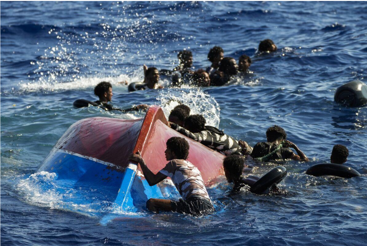
Nafragio de migrantes ilegales en el mar mediterráneo. Miles intentan llegar a Europa, huyendo de la pobreza, la persecución y la guerra.

Al tiempo que la Unión Europea (UE) sigue intensificando sus operaciones en el Mediterráneo, para evitar la llegada de más refugiados al continente, imprime mayor presión política y aporta millones de euros, para que los países emisores, contengan en sus territorios a los miles de desplazados, que sueñan con la oportunidad de llegar finalmente a algún punto de la costa europea. Más allá de estos esfuerzos, que representan miles de millones de euros, el 2022, ha sido el año que mayor cantidad de migrantes llegaron desde 2016.