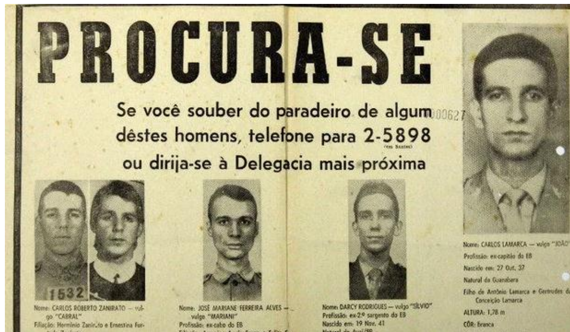
Cartel de "Se Busca" con los que el gobierno de Brasil intentaba dar con el paradero de algunos de sus adversarios político/militares.

Dos años después del inicio del régimen militar en Brasil, grupos armados de izquierda iniciaron una articulación que puso al país en estado de guerra civil no declarada. Entre 1966 y 1974, la izquierda armada robó 3,8 millones de dólares, cantidad que convirtió a la guerrilla brasileña en la más rica del mundo en ese momento. En el apogeo de las acciones, entre 1968 y 1971, los militantes asaltaron 154 establecimientos bancarios y carros blindados. La acción también implicó atentados: los grupos realizaron cerca de 40 atentados con bomba, secuestraron ocho aviones comerciales y cuatro diplomáticos, el único momento en la historia en que hubo secuestro de embajadores en Brasil.