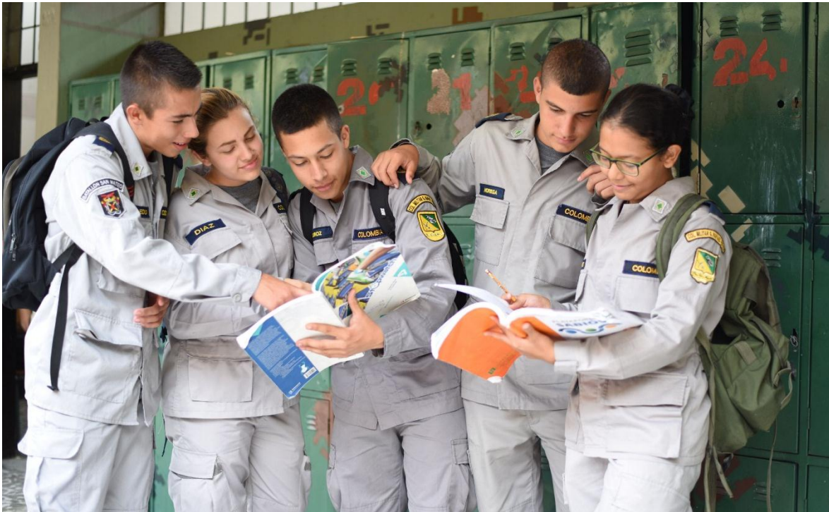
Estudiantes del Colegio Militar Rafael Reyes, de Pereira.

Durante varias décadas, y por distintas circunstancias, las Fuerzas Militares de Colombia basaron su estrategia defensiva en la guerra terrestre, con el empleo de muchas unidades de infantería ligera, apoyadas por unidades de artillería mixta, con obuses de 105 mm. M-101 y morteros Brand AM-50 de 120 mm., fuego y maniobra en una topografía bastante accidentada. Las demás unidades de las armas y los servicios, eran relativamente pocas para los compromisos proyectados en las hipótesis de conflicto.