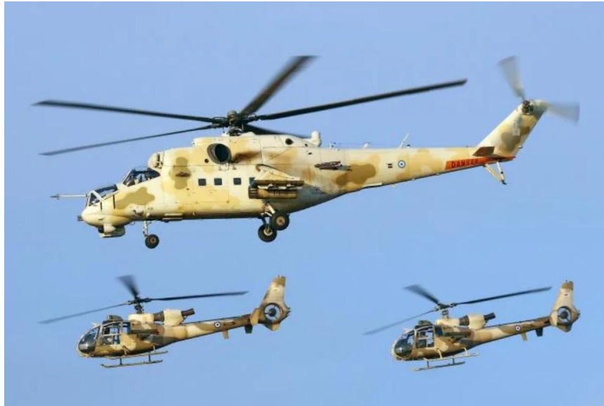
El componente aéreo consta de una mezcla de aeronaves rusas y occidentales, como podemos ver en esta fotografía.

El Componente Aéreo de la Guardia Nacional de Chipre es denominado Comando Aéreo de Chipre. El Comando Aéreo Chipriota consiste del 449 Escuadrón de Helicópteros Antitanque (con 4 SA-342L Gazelle y 2 Bell-206L-3), el 450 Escuadrón de Helicópteros de Ataque (con 11 Mi-35PN Hind-F helicópteros de ataque pesados, 1 PC-9 y 1 BN2B-21), el 460 Escuadrón de Helicópteros (con 3 AW-139), y un escuadrón secreto de UAV (designación y equipamiento no reconocido oficialmente).