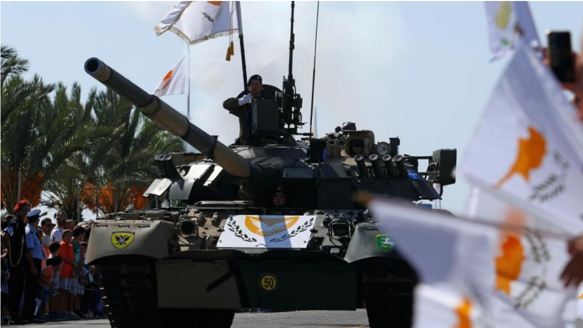
Tanques T-80 de origen ruso, pertenecientes a la Guardia Nacional de Chipre, que presuntamente serán transferidos a Ucrania, para apoyarle en su guerra contra Rusia.

En 1974, Turquía lanzó por sorpresa un ataque a gran escala sobre Chipre con el pretexto de intervenir contra un golpe militar de la Guardia Nacional de Chipre en Nicosia. La invasión resultó en dos ofensivas turcas concentradas (Atila-1 y Atila-2) y una contraofensiva grecochipriota dispersa (Afrodita-2). Dentro de un mes, las fuerzas turcas capturaron el 38% de la región septentrional de la isla, consiguiendo biseccionar Nicosia y tomando Kyrenia, Morphou y Famagusta. Las fuerzas de la Guardia Nacional Chipriota, apoyadas por un pequeño número de tropas griega, solo pudieron prevenir la pérdida del Aeropuerto Internacional de Nicosia y el corredor de Kato Pyrgos durante la segunda ofensiva turca.