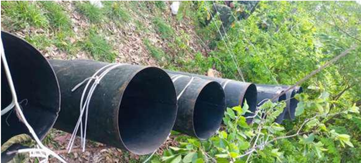
Sistema de lanzamiento de cargas explosivas, basado en cilindros de gas doméstico, modificados.

desde 2011 en Siria, ya 12 años. ¿Amigos israelíes, que ocurrirá la próxima vez que os veáis las caras? Lo peor es la soberbia y las ganas de no aprender.