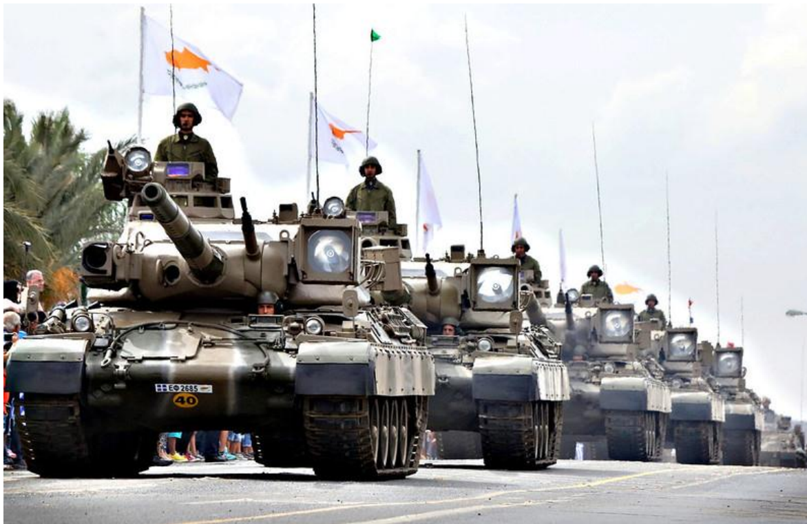
Tanques AMX-30 de origen francés, pertenecientes a la Guardia Nacional de Chipre.