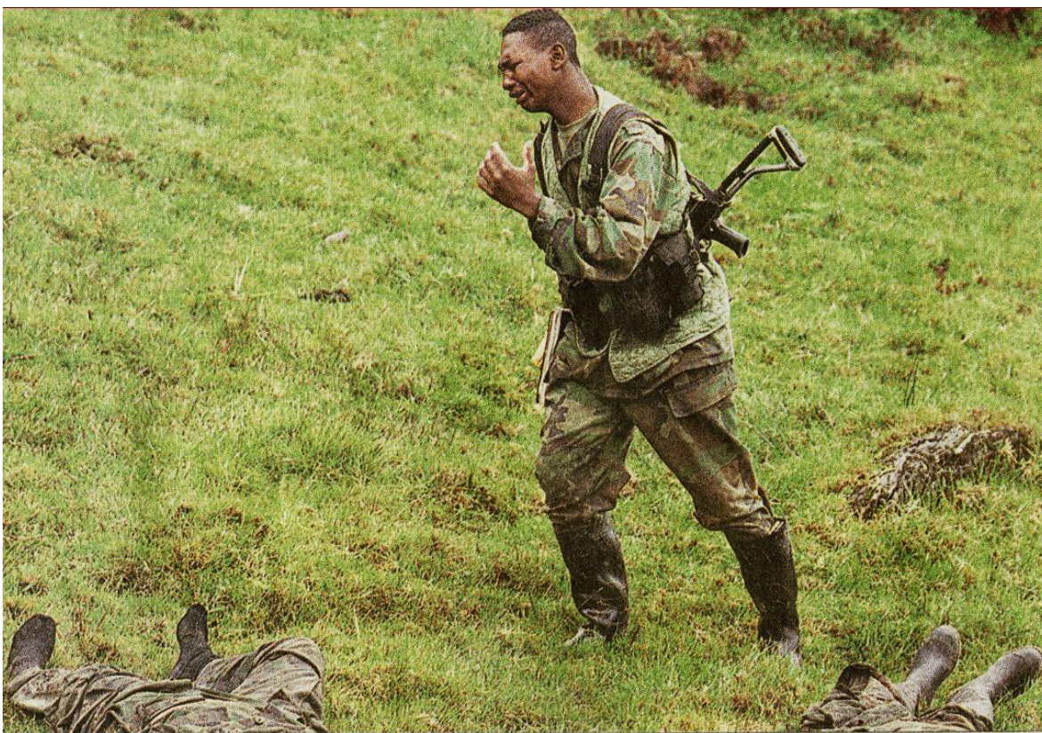
Batalla de Gutiérrez (Cundinamarca, 1999). 38 militares asesinados. La cara del soldado lo dice todo. Los mandos “lavan sus manos”: “el resultado a nivel estratégico de la batalla fue indeciso, pues los insurgentes también sufrieron pérdidas y no pudieron llevar a cabo todos los ataques planeados...” ¡Serán huevones!

presunción de “duda”, nos pone sobre la mesa un total de 18.800 militares muertos, en algo que estúpidamente ustedes denominan; perdón por la expresión, “conflicto armado”, cuando no es más que terrorismo, puro y duro.