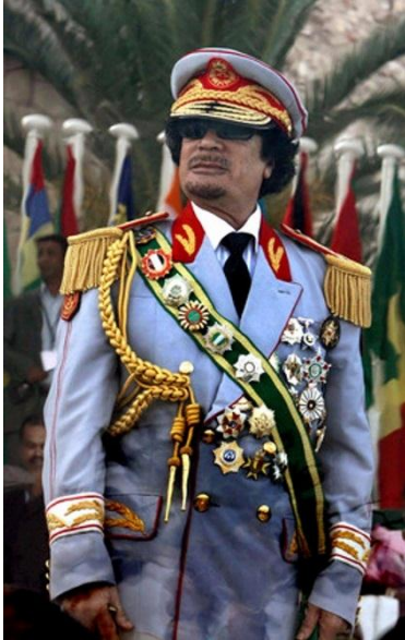
Muamar el Gadafi

A medida que transcurren las horas, desde el anuncio del golpe de estado en Níger (Ver: Níger: Ruidos en el patio trasero de Francia) por parte de los líderes de las Fuerzas de Defensa y Seguridad y el autodenominado Consejo Nacional para la Salvaguardia de la Patria (CLSP) , el grupo de militares que ejecutaron la asonada del miércoles, se perfila con mayor claridad la dirección que el nuevo gobierno del país saheliano pretende dar, mientras los grandes jugadores internacionales han empezado a mover sus fichas.