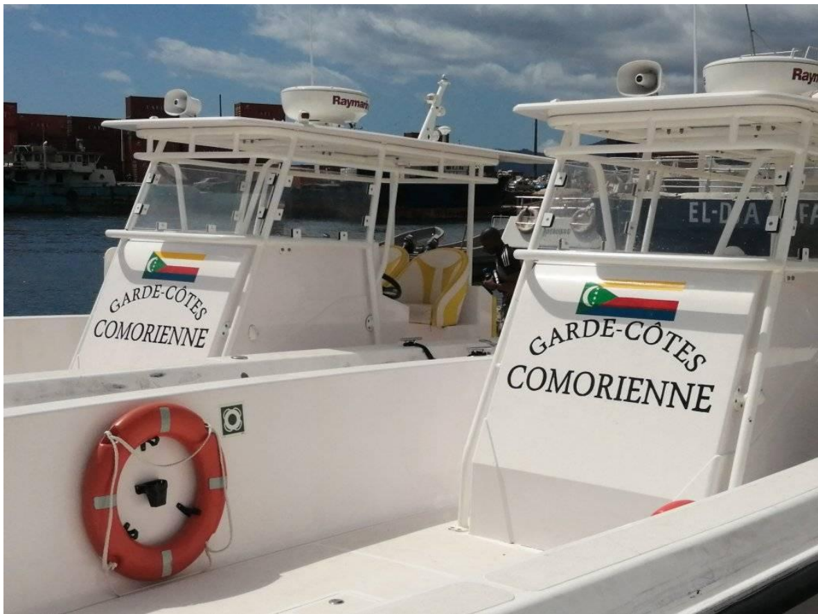
Botes de patrulla de los guardacostas de Comores.

El 2 de enero de 2010, el presidente de las Comoras anunció la creación de la Guardia Costera.