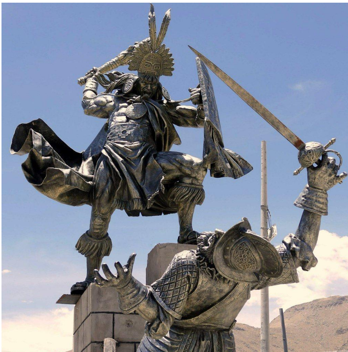
Monumento a Cahuide, valiente guerrero Inca, en Maca, departamento de Arequipa. Obra de los hermanos Luis Alberto, Raúl Oswaldo y Rodolfo Edwin Yanqui Yucra.

“...y llegados al otro (torreón) tenía un orejón por capitán tan valeroso que cierto se podría escribir de él lo que de algunos romanos, este orejón traía una adarga en el brazo, y una espada en la mano, y una porra en la mano de la adarga, y un morrión en la cabeza. Estas armas había habido este de los españoles que habían muerto en los caminos, y otras muchas que los indios tenían en su poder. Andaba pues este orejón como un león de una parte a otra del cubo (torreón) en lo alto de todo, estorbando a los españoles que querían subir con escalas y matando a los indios que se les rendían... Pues avisándole los suyos que subía algún español por alguna parte, agujaba (estoqueaba) a él como un león con la espada en la mano y embrazada la adarga... y mandó Hernando Pizarro a los españoles que subían que no matasen a este indio sino que lo tomasen a vida... Visto este orejón que se lo habían ganado (el torreón) y le habían tomado por dos o tres partes el fuerte,