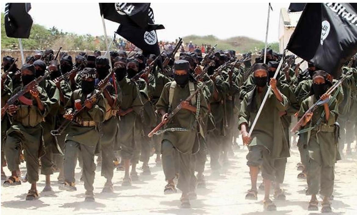
Combatientes Al-Shabbab, en la foto se observa a niños que han sido reclutados a la fuerza por el grupo terrorista.

No importa cuando suceda, en Somalia siempre se observa ese mismo gesto congelado, en el terror y el espanto, de una guerra que perpetuamente está empezando.