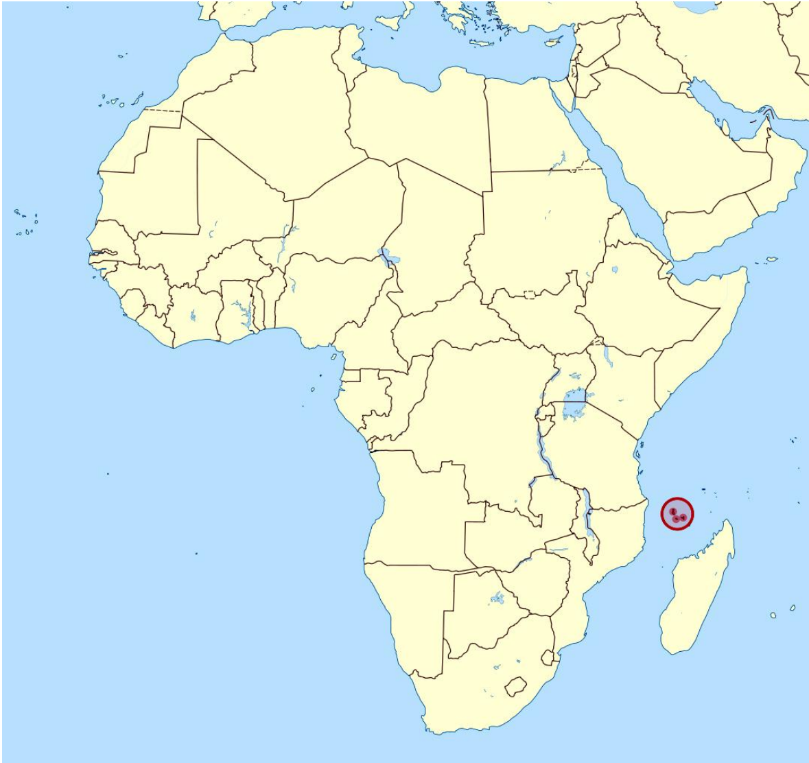
Ubicación de Las Comoras en África, al norte de Madagascar.

aproximadamente la mitad de la población vivía por debajo del índice internacional de pobreza de 1,25 dólares al día.