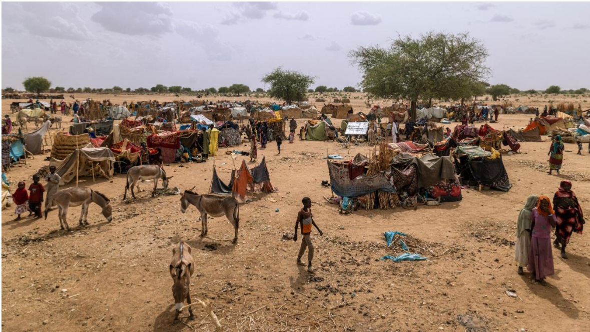
La guerra, la pobreza y el clima, se ensañan con los sudaneses, pero a nadie parece importarle, el mundo mira hacia Ucrania. Allá tienen piel blanca y pelo liso.

Las inundaciones en el este de Libia, que ya superan los doce mil muertos, y que prácticamente se tragó la ciudad de Derna; el terremoto al suroeste de Marrakech, en la región rural de la cordillera del Atlas en el centro de Marruecos, que dejó más de tres mil muertos y cinco mil heridos; Los diez mil refugiados, que solo en tres días, llegaron a la isla italiana de Lampedusa provenientes de África, y que se suman a los 115 mil arribados previamente, solo en lo que va del año; La seguidilla de derrocamientos de gobiernos pro occidentales, en las ex colonias francesas, que reconfiguran el mapa político y militar del Sahel, cerrando y poniendo tensión en fronteras que hasta ahora funcionaban sin mayores conflictos, como la de Níger con Nigeria; que junto a las operaciones desbordadas de las khatibas de al-Qaeda y el Daesh, en Burkina Faso,