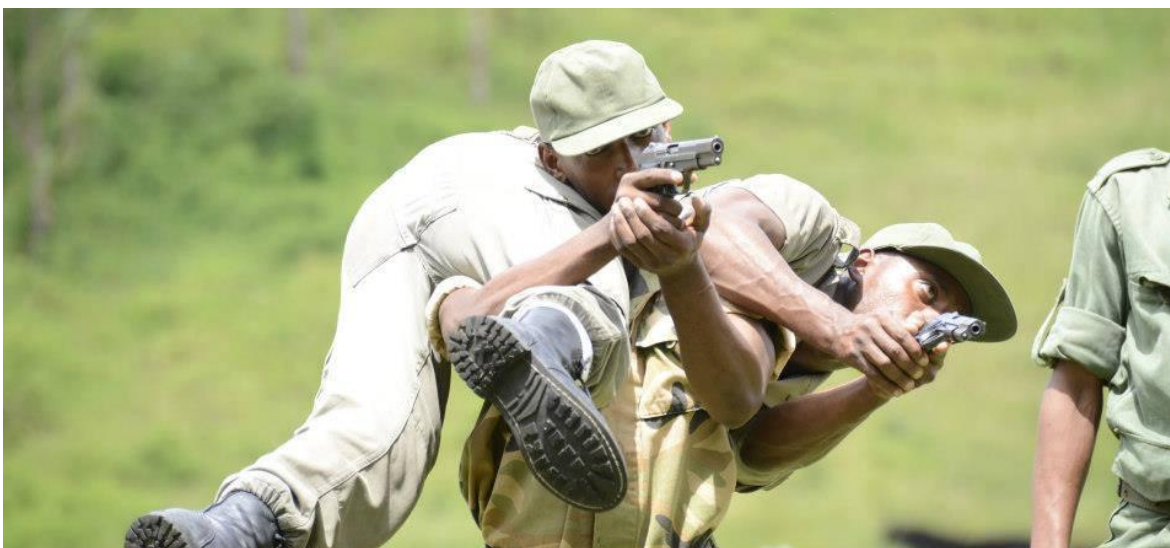
Entrenamiento de evacuación de heridos, en combate.