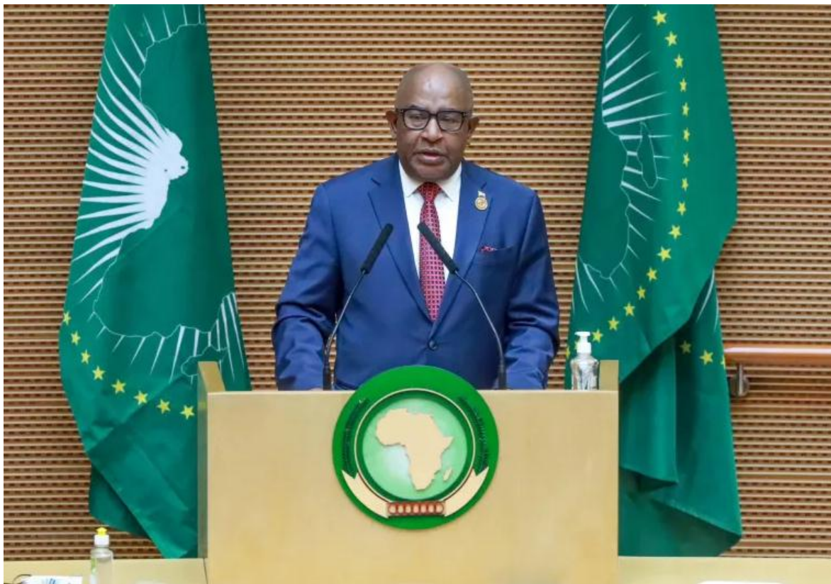
El presidente Azali Assoumani de la Unión de las Comoras asumió el cargo de presidente rotativo de la Unión Africana (UA) para 2023 durante la 36.ª sesión ordinaria de la Asamblea de la Unión celebrada el 18 de febrero en la sede de la UA en Addis Abeba, Etiopía.

Más recientemente, la Asamblea ha mantenido este punto en su orden del día, pero lo ha aplazado de año en año sin tomar medidas. Otros organismos, como la Organización de la Unidad Africana, el Movimiento de Países No Alineados y la Organización de Cooperación Islámica, han cuestionado de forma similar la soberanía francesa sobre Mayotte. Para cerrar el debate y evitar integrarse por la fuerza en la Unión de las Comoras, la población de Mayotte eligió por abrumadora mayoría convertirse en departamento de ultramar y región de Francia en un referéndum celebrado en 2009. El nuevo estatus entró en vigor el 31 de marzo de 2011 y Mayotte ha sido reconocida como región ultraperiférica por la Unión Europea el 1 de enero de 2014. Esta decisión integra jurídicamente a Mayotte en la República Francesa.