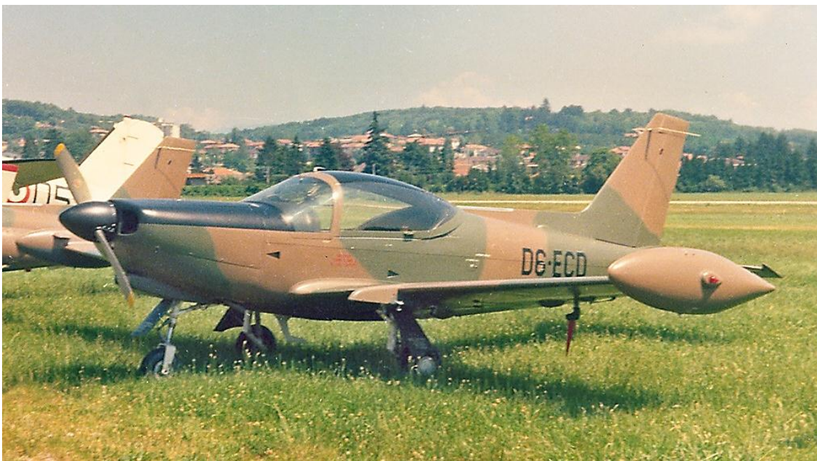
Avión ligero SIAI Marchetti SF.260